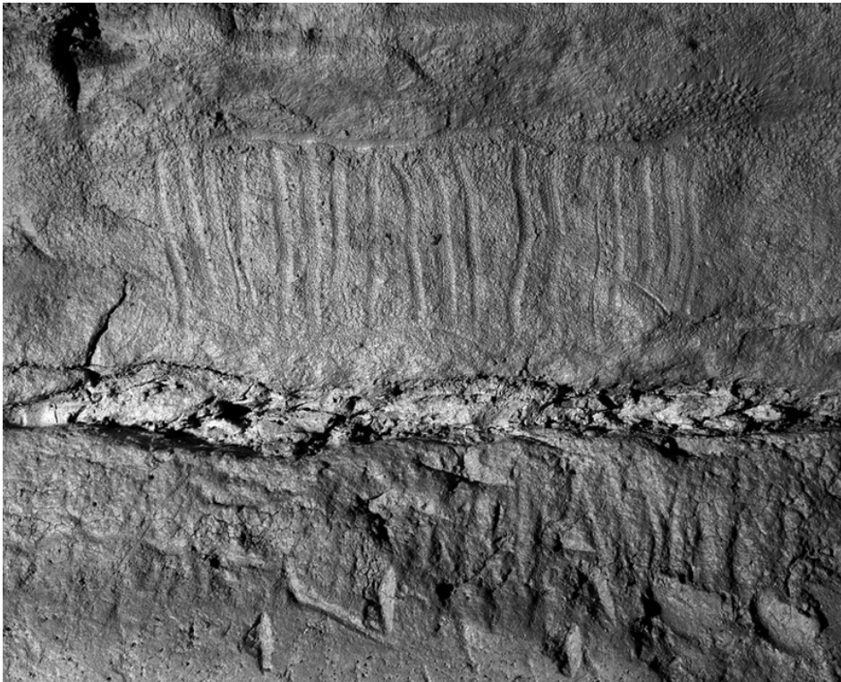
Fig. n°2 : Secteur 3 - Motif quadrangulaire complexe formé d'une juxtaposition de tracés digités verticaux, régulièrement espacés et encadrés de tracés horizontaux ; impacts d'outils dans la partie inférieure

Auteur(s) : Petrogani, Stéphane (CNRS) ; Bourillon, Raphaëlle (DOC). Crédits : Raphaëlle Bourillon DOC ; Stéphane Petrognani CNRS (2007)