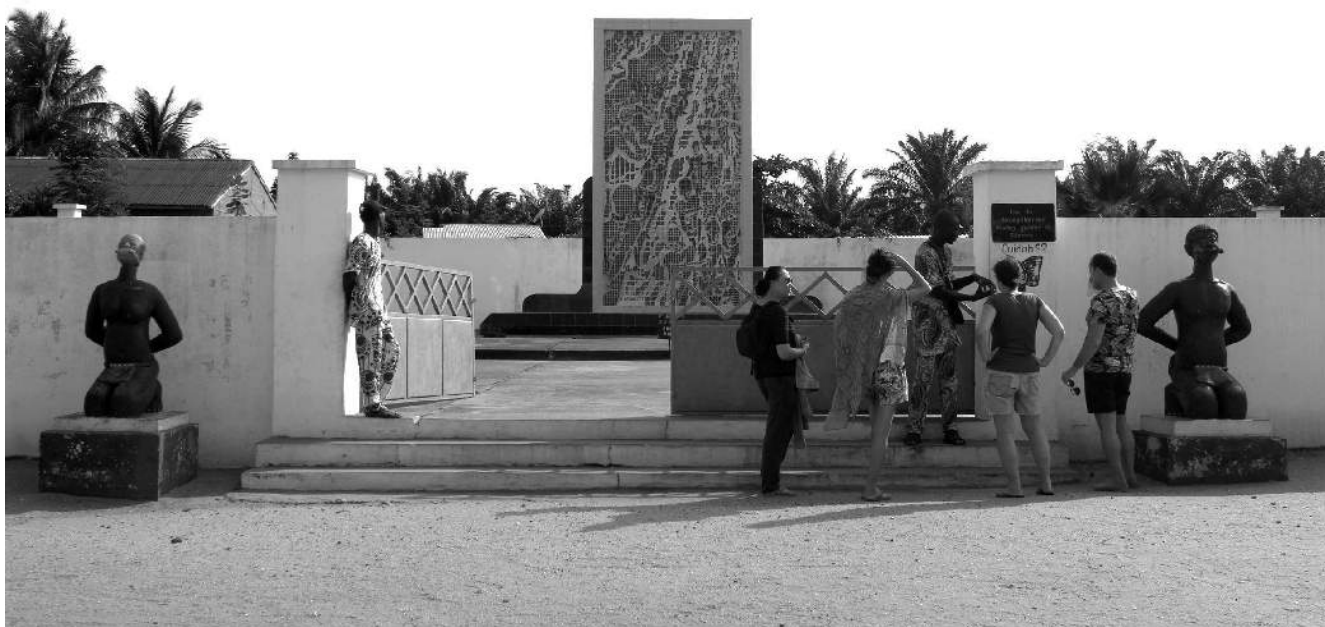
Illustration 2 – Visite guidée de la Route de l'esclave effectuée avec un groupe de visiteurs français. Le guide décrit les sculptures représentant des personnes enchaînées à Zoungbondji, devant la fosse commune (Ouidah, 2018).

Route de l'esclave, deux logiques de « détournement » sont observées.