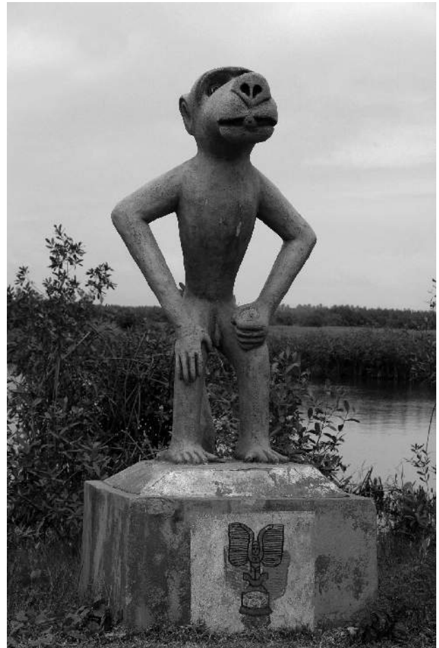
Illustration 3 – Sculptures présentes le long de la Route de l'esclave servant de support au détournement des guides (Ouidah, 2016, R. Goussanou).

À travers cette réinterprétation, les guides permettent une persistance des mémoires endogènes et familiales malgré la mise en place de récits officiels sur la mémoire béninoise. Au-delà de la présentation d'un parcours devenu touristique, c'est l'expression mémorielle de leur groupe identitaire qui est véhiculée. Au cours des visites guidées, d'autres références au royaume xwéda