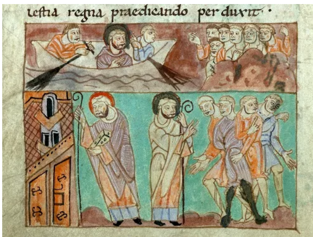
Fig. 3 : Valenciennes, Bibliothèque municipale, Première Vie de saint Amand , ms. 502 (fin XI e -début XII e siècles). Folio 18 v : Saint Amand et l'évangélisation des Slaves, au-delà du Danube (voir l'image au format original)

La scène de retour est donc placée stratégiquement entre le moment où il est élevé par Dieu à cette dignité, et celui où il en reçoit la confirmation terrestre. L'effort physique annonce alors les difficultés de son nouveau devoir. Il s'agit d'une préfiguration des épreuves qu'il va rencontrer et qu'il devra surmonter en tant que missionnaire. Amand continue de se déplacer, pourtant, il faut attendre le folio 18 v pour avoir de nouveau une représentation de son voyage (fig. 3).