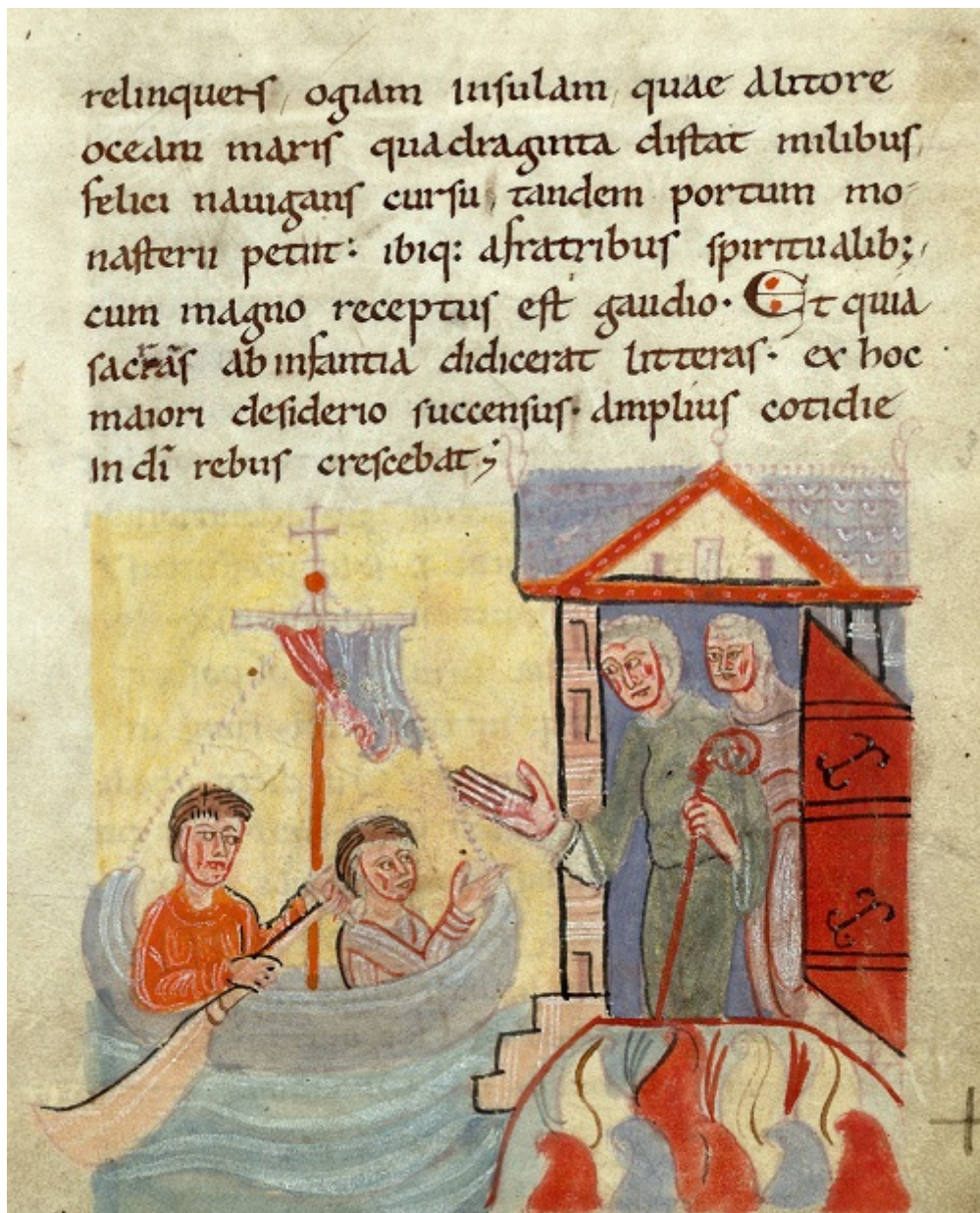
Fig. 1 : Valenciennes, Bibliothèque municipale, Première Vie de saint Amand , ms. 502 (fin XI e -début XII e siècles). Folio 6 : Saint Amand arrivant à l'île d'Yeu pour se faire moine (voir l'image au format original)