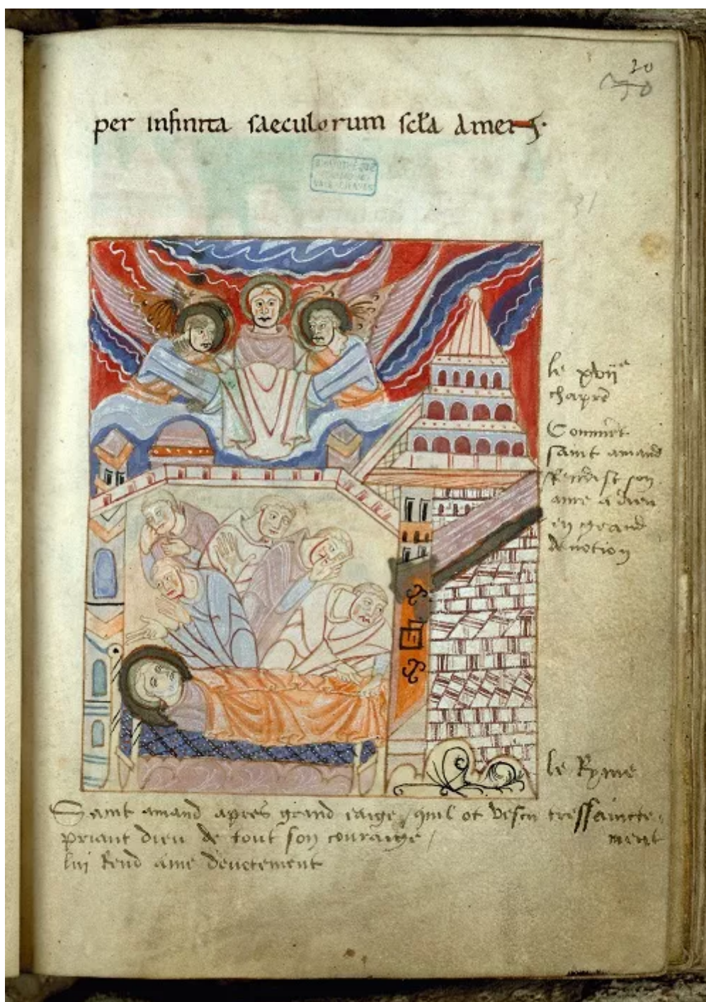
Fig. 5 : Valenciennes, Bibliothèque municipale, Première Vie de saint Amand , ms. 502 (fin xi e -début xii e siècles). Folio 30 : Mort et ascension de l'âme de saint Amand (voir l'image au format original)

lit, à l'infirmerie de l'abbaye au folio 30 (fig. 5) [22]. L'iconographie est somme toute assez classique ici, avec les deux anges emmenant son âme dans un linge. La vision que reçoit saint Maur de l'ascension de saint Benoît, dans le même manuscrit que précédemment évoqué, le présente de façon très similaire. Les exemples pourraient être multipliés [23].