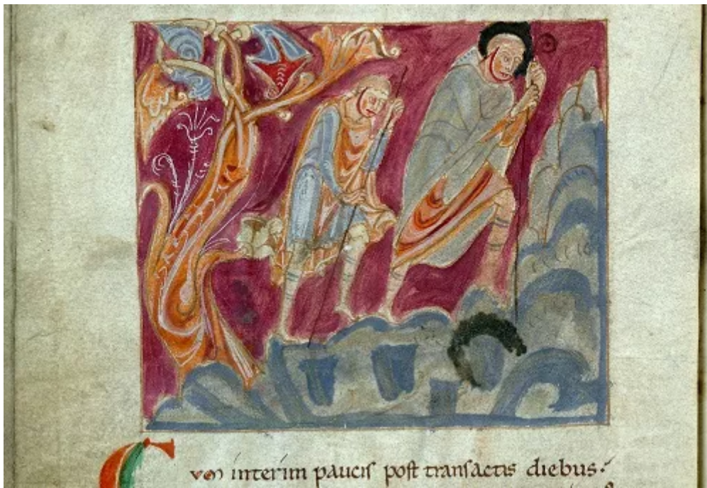
Fig. 2 : Valenciennes, Bibliothèque municipale, Première Vie de saint Amand , ms. 502 (fin XI e -début XII e siècles). Folio 10 v : Saint Amand retournant en Gaule ( voir l'image au format original )