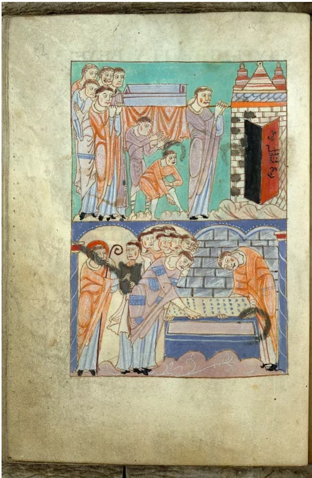
Fig. 6 : Valenciennes, Bibliothèque municipale, Première Vie de saint Amand , ms. 502 (fin x e -début xii e siècles). Folio 30 v : Funérailles de saint Amand (voir l'image au format original)