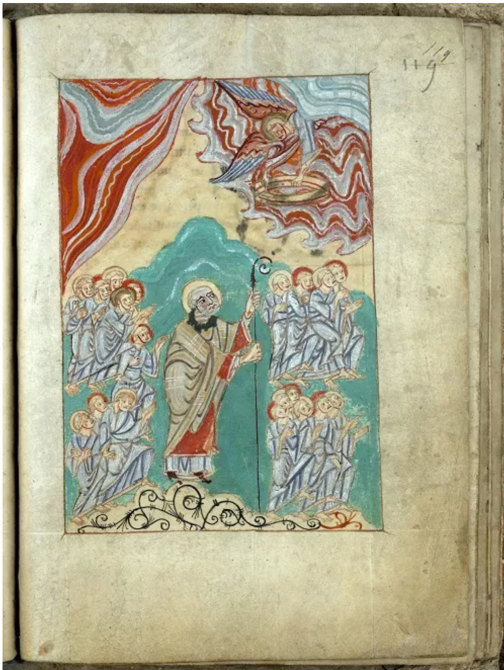
Fig. 7 : Valenciennes, Bibliothèque municipale, Première Vie de saint Amand , ms. 502 (fin XI e -début XII e siècles). Folio 119 : La vision de l'apothéose de saint Amand ( voir l'image au format original )

Amand est cette fois représenté en pied, au sommet d'une montagne avec quatre groupes d'élus qui grimpent à sa suite. Nimbé, il a de nouveau sa barbe blanche qu'il avait perdue dans le sinus des anges, retrouvant en même temps sa dignité d'évêque, par laquelle Amand a mérité la couronne des élus qu'un ange lui apporte.