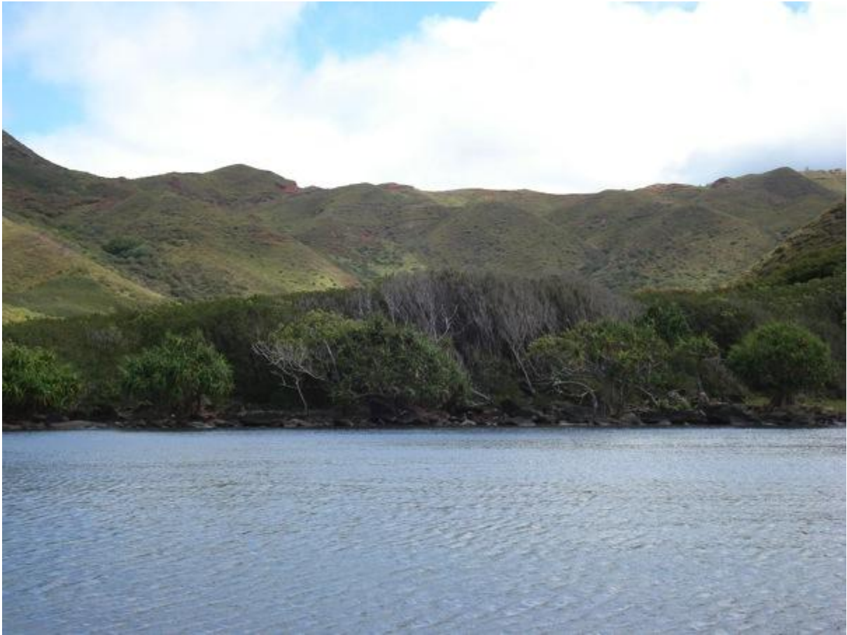
Fig. 5 : vue du site depuis la mer sur la face ouest en fond de baie de 'Angaira'o

vallée, comme cela a été le cas des marae de Polynésie française en général (Wallin 2003). Le mur nord de cette enceinte descend jusqu'à la mer où il s'enfonce (Fig. 9), et devant le site lithique on devine dans l'eau l'alignement de pierres d'un ancien parc à poissons aujourd'hui abandonné, constitué de pierres particulièrement imposantes, qui en font une structure unique à Rapa.