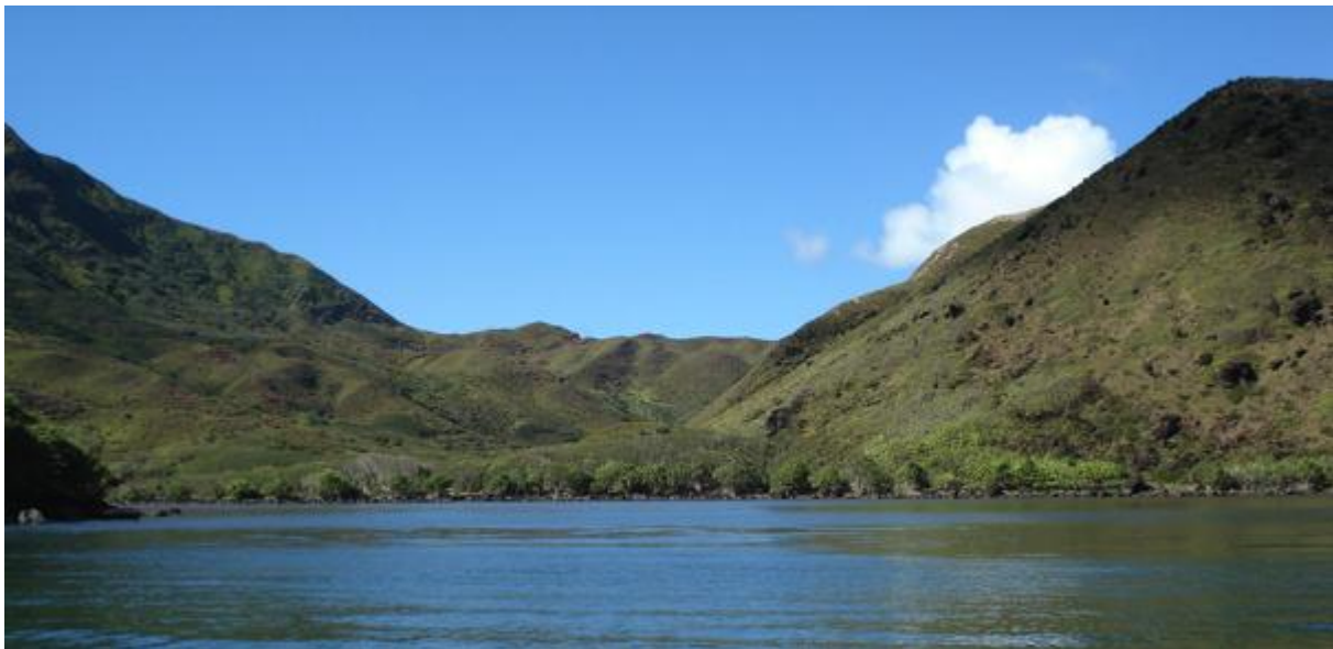
Fig. 3 : Vue du fond de la baie de 'Angaira'o depuis la mer

Après trois-quarts d'heure de navigation par bateau par le nord-ouest de l'île, nous atteignons la baie de 'Angaira'o (Fig. 3), une belle et large baie à la pente douce, au milieu de laquelle serpente une rivière (Fig.4). Entièrement consacrée à la culture du taro jusque dans les années 1960, elle est aujourd'hui abandonnée aux troupeaux de taureaux et chèvres sauvages. Nous installons à l'ombre de pandanus un grand pe'ue sur lequel nous déposons nos sacs à dos. Un feu est fait entre des pierres, en prévision du déjeuner. Puis les femmes présentes partent immédiatement ramasser des poulpes et des akaekae (limaces de mer), les enfants se déshabillent et barbotent dans l'eau, et un petit groupe composé du maire, du pasteur, de la pompière, de mon épouse et moi, part à la découverte du vestige terrestre mentionné par Stokes.