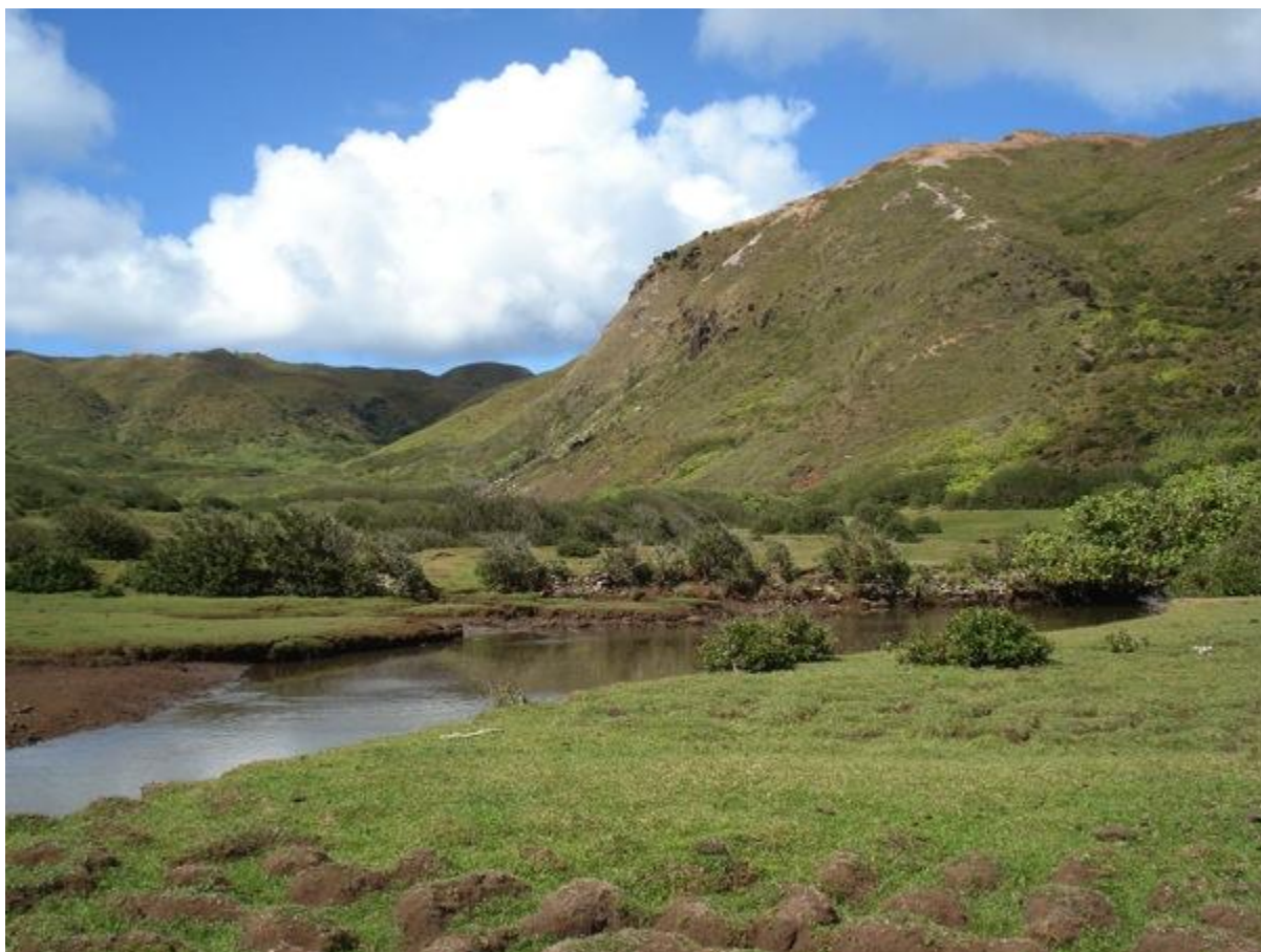
Fig. 4 : vue de la rivière en fond de baie de 'Angaira'o

Le site ( Fig. 5 ) se situe en bord de mer, sur la rive sud-sud-ouest de la baie, caché par une végétation très dense de goyaviers sauvages, dont les troncs minces forment un rideau quasi impénétrable ( Fig. 6 ), et de pandanus. Le maire a apporté un coupe-coupe et tâche d'éclaircir un chemin au milieu de cette brousse. Nous finissons par tomber sur un gros amas de pierres d'environ 30 à 50 cm de côté ( Fig. 7 ), dans le prolongement sud-nord d'un premier muret d'une trentaine de centimètres de hauteur dessinant une enceinte de trois mètres de large sur six mètres de long environ ( Fig. 8 ) qui aurait été pavée (des pierres subsistent encore de part en part, la face plate affleurant le sol) comme le note Stokes : « la surface de cette terrasse est située de 60 à 75 cm au-dessus du contour du sol, et est pavée avec des pierres de taille moyenne ». La baisse de la hauteur moyenne du muret, ainsi que la disparition quasi complète du pavage, sont sans doute dues au fait que les pierres ont pu être utilisées par les Rapa pour la construction de murs de soutènement dans les champs de taro de la