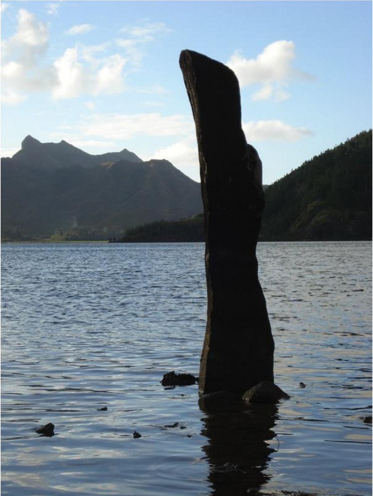
Fig. 1 : la pierre levée du site de Otoko à l'est de Aurei