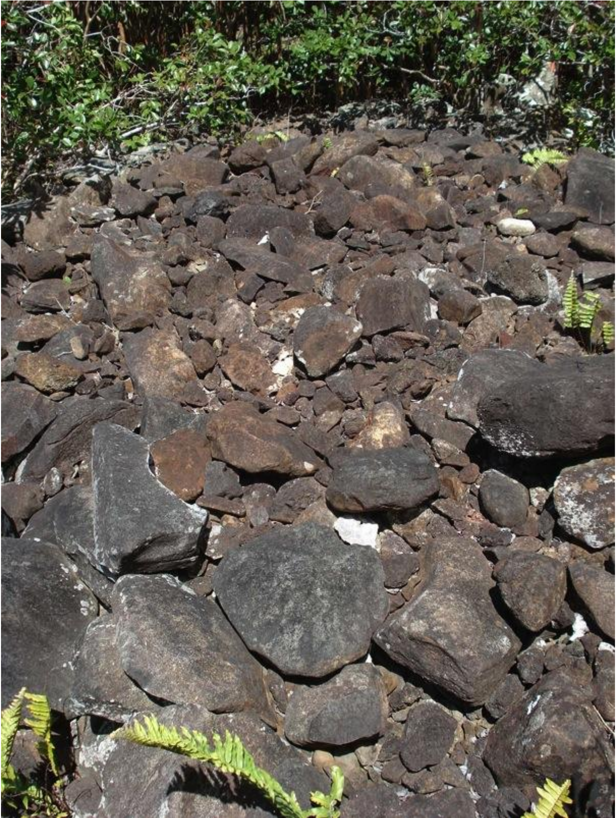
Fig. 7 : un amas de pierres dans le prolongement de murets d'enceinte