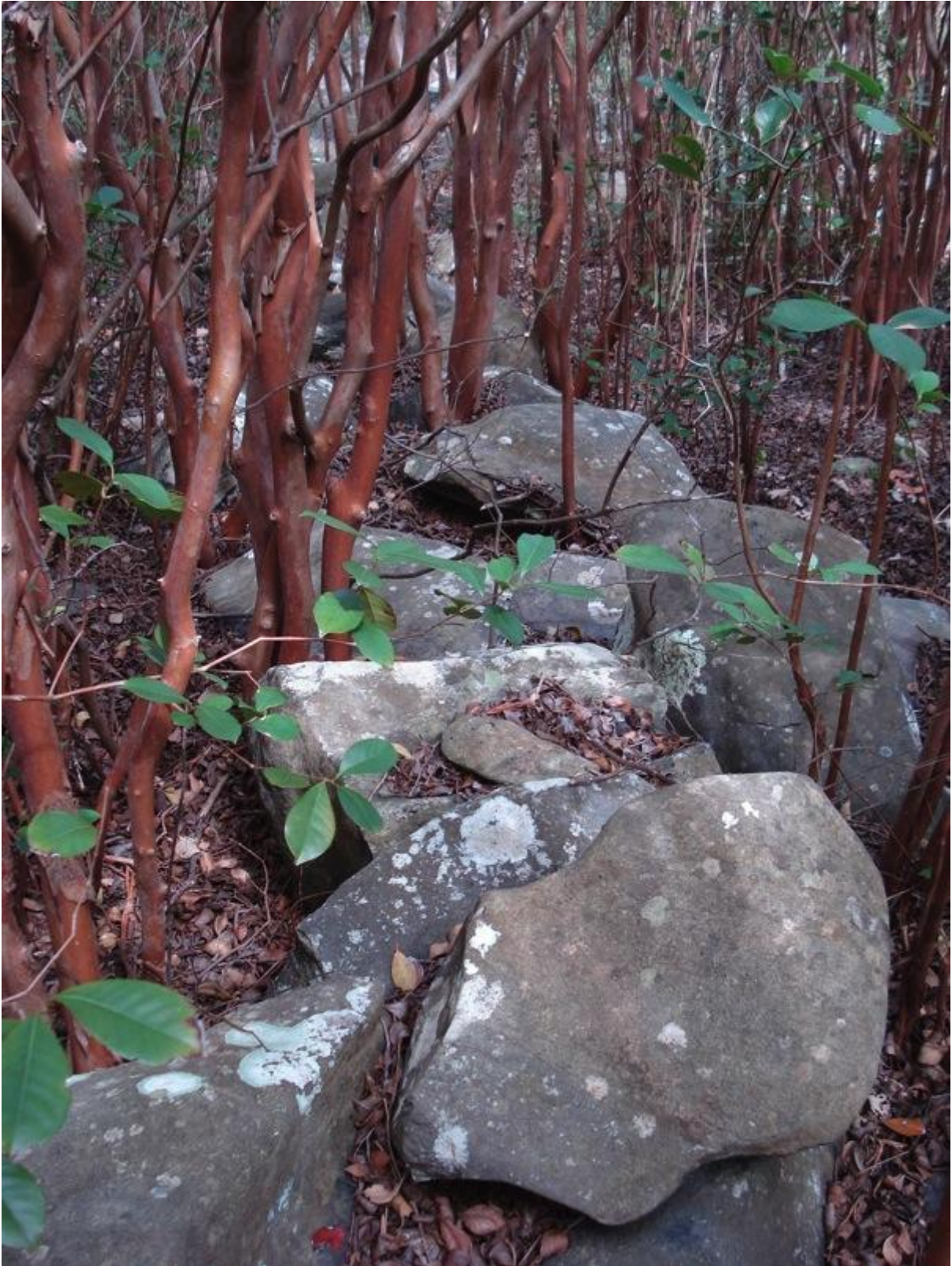
Fig. 8 : les restes du muret nord-sud d'enceinte