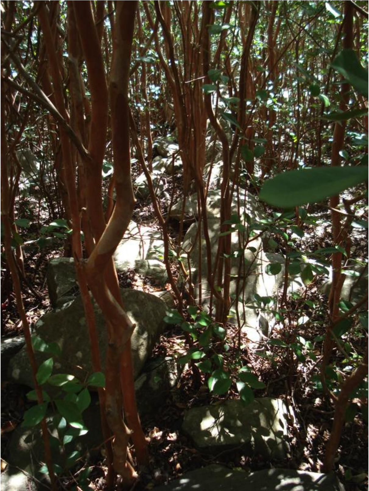
Fig.6 : le rideau quasiment impénétrables de goyaviers sur le site