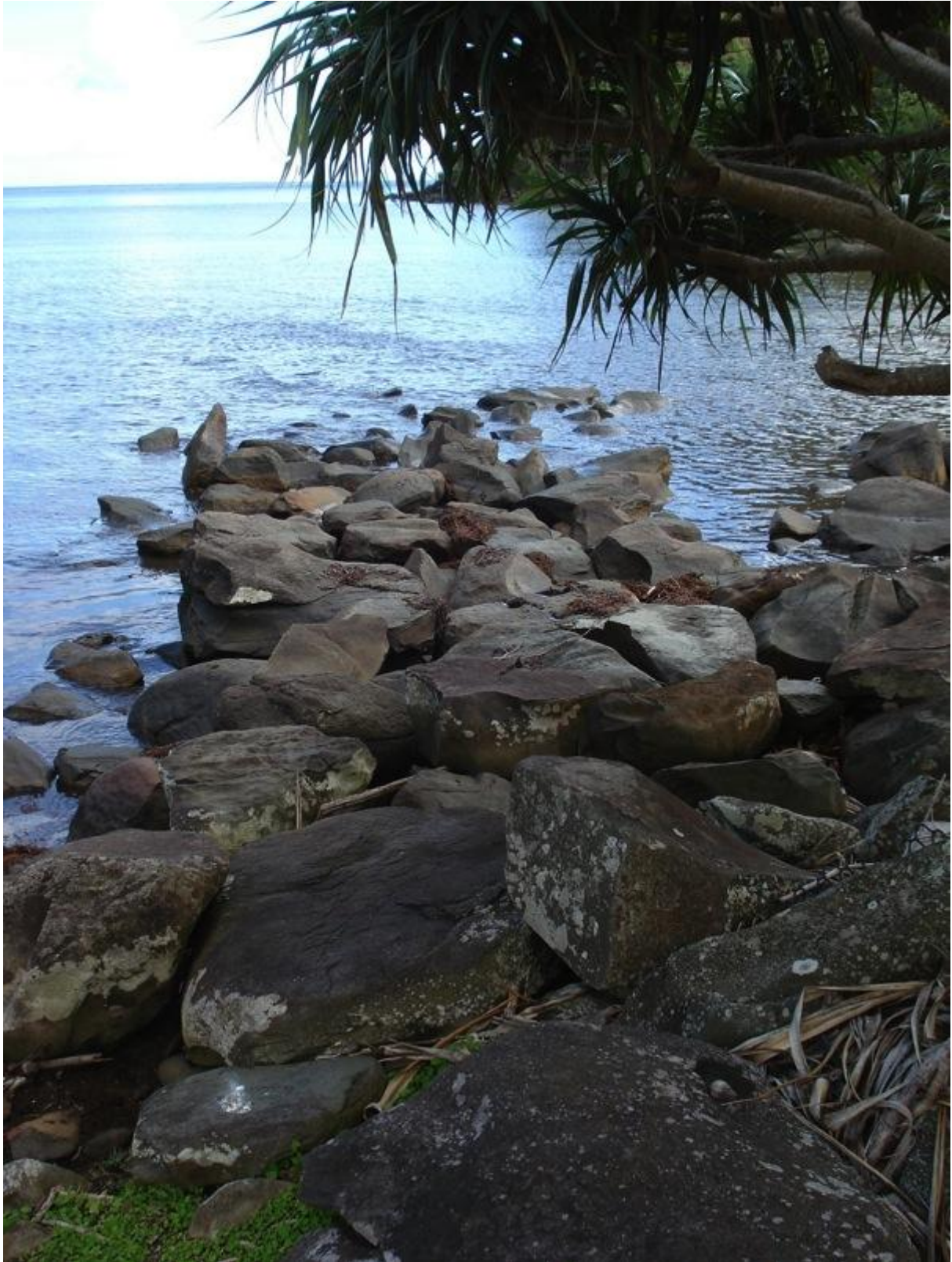
Fig. 9 : le muret ouest-est qui se prolonge dans la mer

Les restes d'une deuxième enceinte apparemment non pavée de six mètres de côté apparaissent immédiatement derrière la première par rapport à la mer, soit sur sa partie ouest. Le muret qui