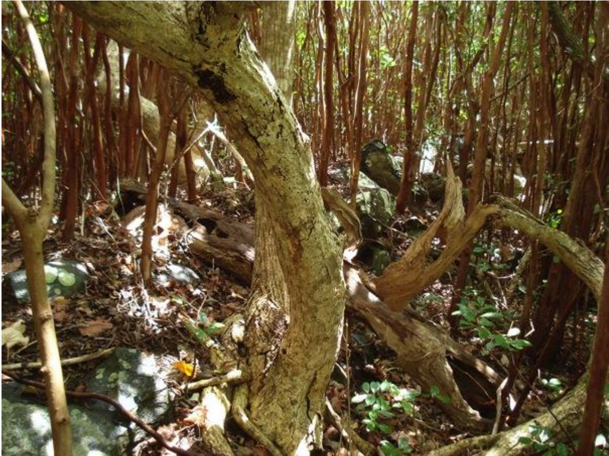
Fig. 13 : une vue de la partie ouest-est du mur d'enceinte extérieur en équerre

La totalité du site telle que nous avons pu l'observer constitue donc un ensemble (voir Fig. 14 « Plan général du site ») qui semble formé d'un temple en bord de mer, menant à un parc à poisson, flanqué à l'arrière d'une structure plus large (peut-être destinée à l'habitation du prêtre), le tout ceint d'un mur de pierres, et entouré de structures plus petites et peut-être de terrassements destinés à contenir des cultures de taro, le tout englobé dans ce qui semble être une vaste enceinte pour une surface totale d'environ cinq mille mètres carrés.