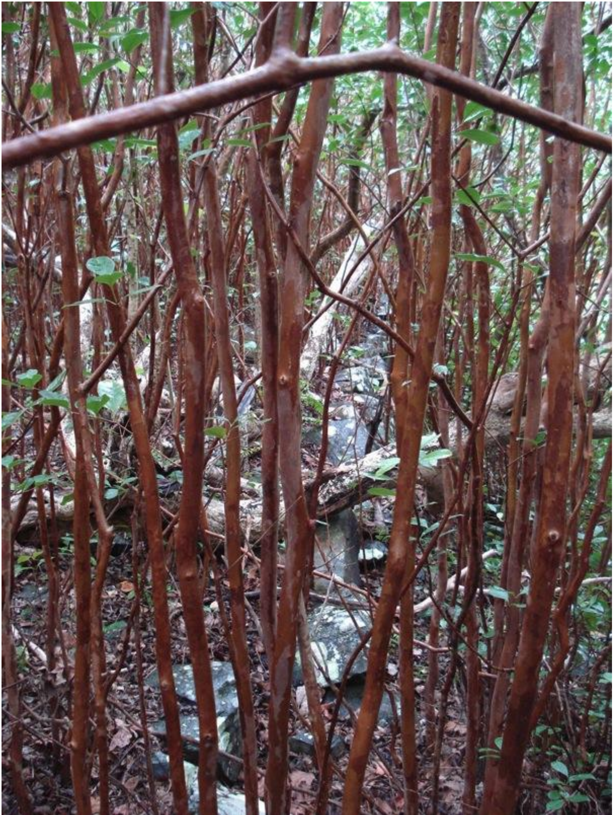
Fig. 12 : une vue de la partie nord-sud du mur d'enceinte extérieure en équerre