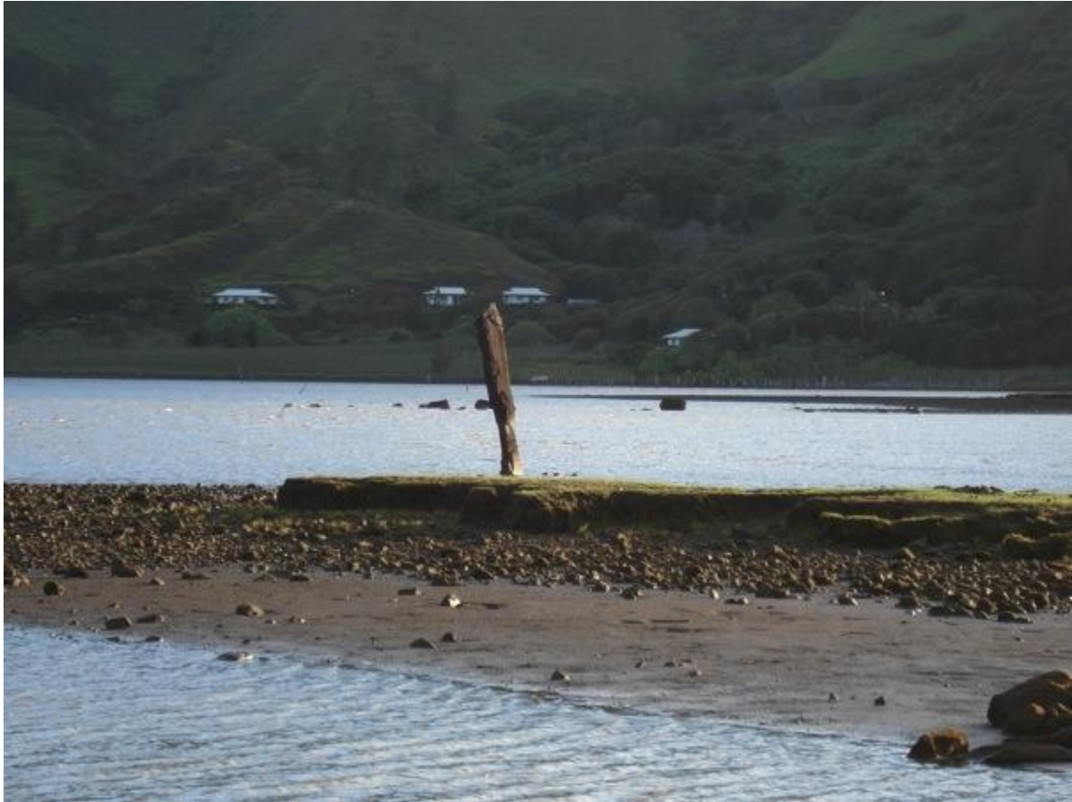
Fig. 2 : une des deux pierres levées visibles au fond de la baie de Aurei (Teneiare).