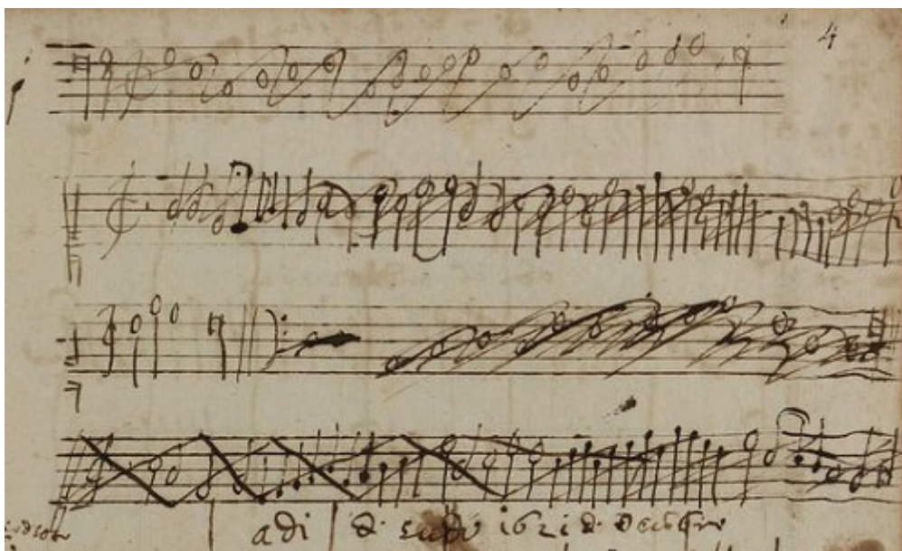
Fig. 2 - Ms. C.85, fol. 4 r , détail : contrepoints du 4 décembre 1621 (voir l'image au format original)

transparaît à travers une organisation méthodique du travail, le contenu pédagogique n'est pas non plus laissé au hasard. Ainsi, ces polyphonies à deux voix sont inventées sur un plain-chant en mode de ré , sauf les contrepoints du 19 et du 20 janvier 1621. Ce changement engage à penser que le maître de contrepoint souhaitait ensuite confronter l'élève à d'autres modes comme celui de mi et de fa . Francesco Maria Bassani semble avoir suivi une formation accélérée dans les derniers jours de janvier, car son maître prévoyait également de lui faire inventer des contrepoints avec un plain-chant au soprano ( ut 1).