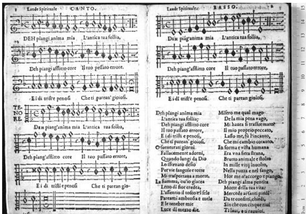
Fig. 6 - Il Terzo Libro delle Laudi Spiritualis , Roma, Blado, 1577 (voir l'image au format original)

Esempi di questo genere sono numerosi. Tuttavia, hanno un interesse prevalentemente anedddotico. Più interessanti sono invece gli errori che vanno ad incidere sul testo musicale. Si consideri ad esempio Il terzo libro delle laudi spirituali , una raccolta collettiva pubblicata a Roma dagli eredi di Antonio Blado nel 1577.