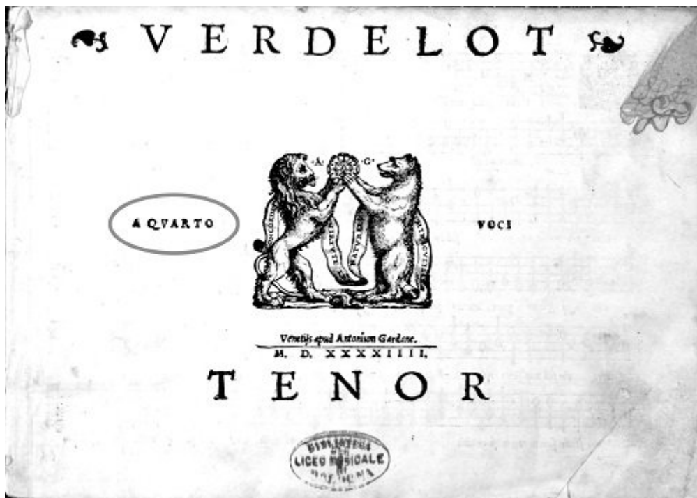
Fig. 5 - Verdelot a quarto voci , Venezia, Gardano, 1544 (voir l'image au format original)

Esempi di questo genere sono numerosi. Tuttavia, hanno un interesse prevalentemente anedddotico. Più interessanti sono invece gli errori che vanno ad incidere sul testo musicale. Si consideri ad esempio Il terzo libro delle laudi spirituali , una raccolta collettiva pubblicata a Roma dagli eredi di Antonio Blado nel 1577.