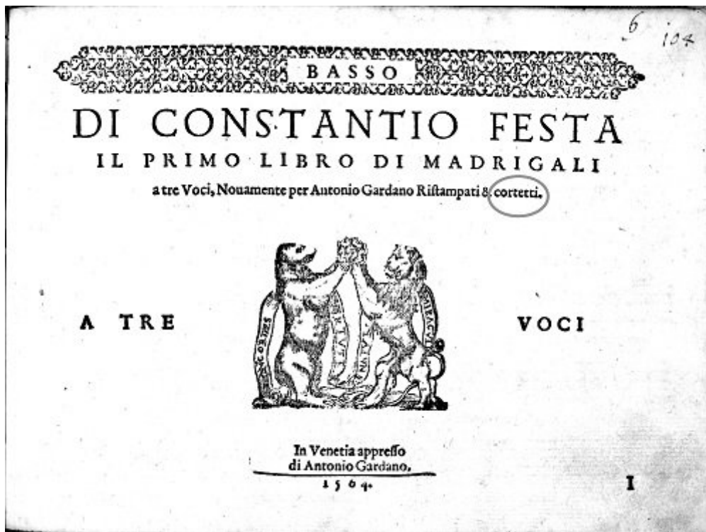
Fig. 3 - Di Constantio Festa il Primo Libro di Madrigali a tre voci , Venezia, Gardano, 1564 (voir l'image au format original)

Un altro buffo errore è nel frontespizio di una ristampa fatta da Scotto nel 1586 del Secondo libro dei madrigali di Orlando di Lasso (fig. 4). L'editore non ha scritto «con ogni diligentia corretto»; e bene ha fatto, perché nel bel mezzo della pagina si legge «Il secodo libro...». E poiché la matrice del frontespizio veniva riutilizzata per tutti i libri-parte, cambiando solo la specifica della voce, l'errore si ritrova in tutti i fascicoli.