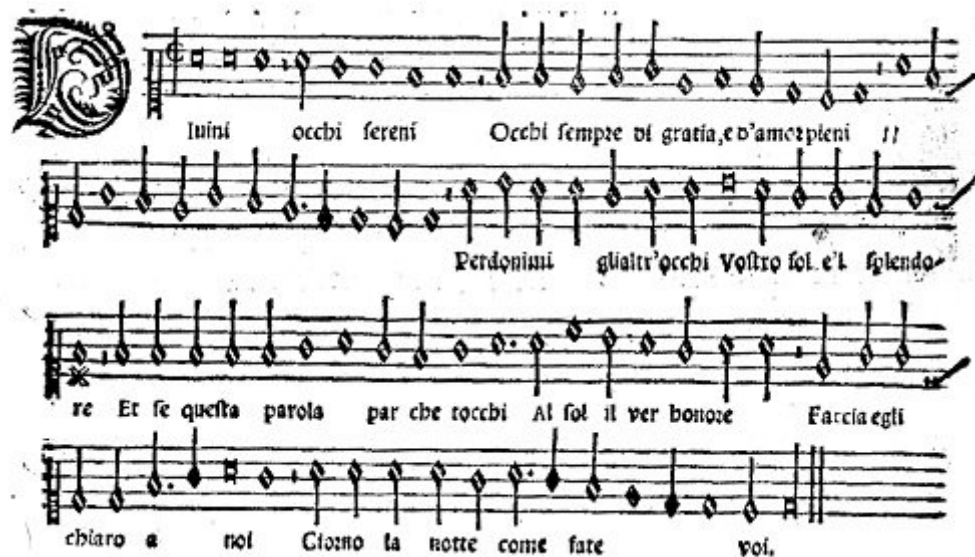
Fig. 7a - Il primo libro de Madrigali di Verdelotto , Venezia, Scotto, 1537 (voir l'image au format original)

(«fingono»). Per capire esattamente come abbia lavorato Merulo, prendiamo il madrigale Divini occhi sereni , e confrontiamo la sua edizione con quella del 1537, di Scotto (la prima giunta completa) (fig. 7a) [21] . Il pezzo è in re per bequadro (primo modo); e su re finiscono quasi tutte le cadenze. Si può notare che Merulo indica chiaramente il do# in cadenza, sulla parola «pieni» (fig. 7b). Nella stampa del 1537 il # non c'è; e questa è una tipica alterazione che sarebbe stata applicata automaticamente da un cantore esperto, ma forse non da un principiante.