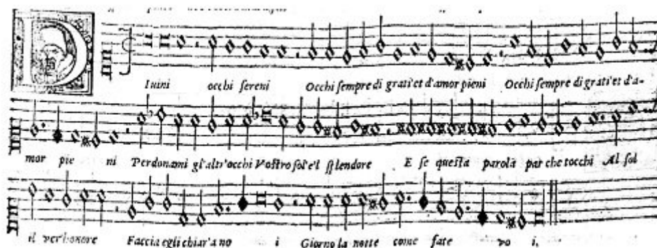
Fig 7b - I Madrigali del Primo e Secondo Libro di Verdelot , Venezia, Merulo, 1566 (voir l'image au format original)

Poi sulla frase «Perdonami gli altr'occhi» Merulo mette il bemolle a tutti e due i si . Nell'edizione 1537 il bemolle non c'è, perché un cantore esperto avrebbe cantato automaticamente sib , basandosi sulla regola che «una nota supra La semper est canendum Fa ». Ancor più interessante è la ripetizione del # per tutti i fa della frase «Et se questa parola». Merulo si premura di ripetere il # perché un principiante poteva non sapere che,