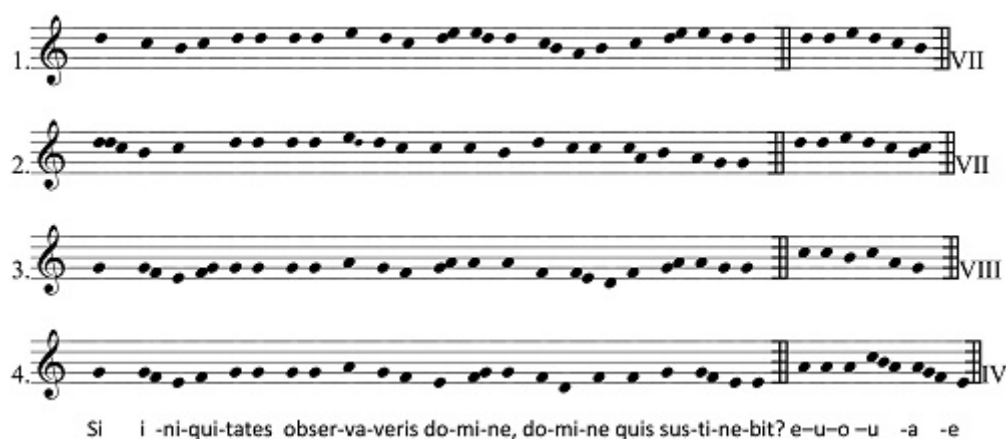
Fig. 1 - Antienne Si iniquitates : 1. Antiphonaire anglais, Cambridge Univ. Add. 2602, xiv e s., fol. 264 ; 2. Lucca, Bib. Cap. 601, xi e s. ( Paléographie Musicale , 9), fol. 560 ; 3. Worcester, F 106 xiii e s. ( Paléographie Musicale , 12, p. 435) ; 4. Antiphonarius ad modum amplius secundum solennem Cenomanensis dioceseos ritum , Paris/Le Mans, '1529' [s. p.] [Exemplaire numérisé p. 130 v ] (voir l'image au format original)

Dans l'exécution de la psalmodie antiphonée de l'office, le ton psalmodique est choisi selon le mode de l'antienne et noté par sa terminaison à la suite de l'antienne. Remarquons avec ces mélodies de l'antienne Si iniquitates que ces terminaisons diffèrent alors que toutes les mélodies commencent de la même manière, attestant une communauté de composition [10] (voir fig. 1). Le copiste de l'antiphonaire conservé à Cambridge note sur ré une formule de 7 e mode et finit sur ré , dessinant ce que Jean Claire appelait un mode archaïque [11] . Le chantre de Worcester propose la même mélodie, tournant autour d'un même axe de récit et de finale, mais l'écriture sur sol et l'attraction de ce degré comme teneur et finale appellent une psalmodie de 8 e mode avec teneur sur do . Celui de Lucques note une mélodie qui dès la deuxième incise descend vers la finale sol , avec psalmodie de 7 e mode. Du Mans, à côté de versions assez communes signalons celle-ci, qui commence, comme celle de Worcester, sur sol , mais finit sur mi avec une psalmodie de 4 e mode.