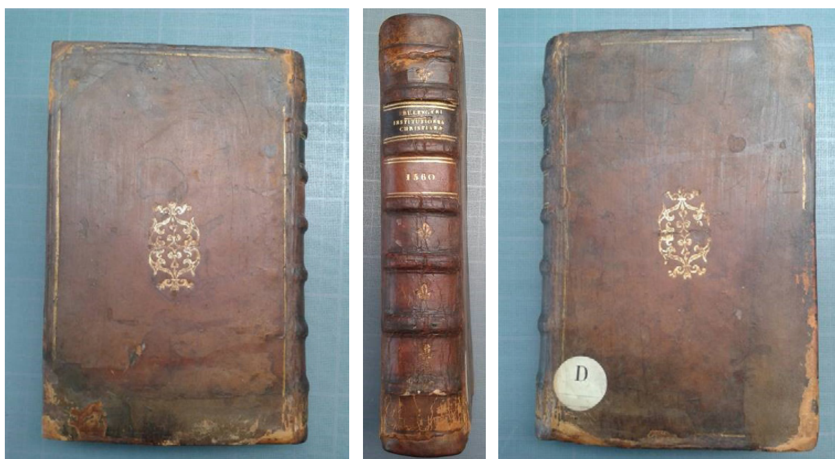
Figure 5 Ouvrage comportant une ancienne greffe de cuir (après intervention). Une nouvelle greffe de cuir a été ajoutée à la première en queue.

À l'inverse, si le choix est porté sur l'instance esthétique, l'ajout appelle le plus souvent la suppression ( fig. 6 ). La conservation-restauration des documents doit mesurer l'importance relative de ces deux instances pour choisir un traitement, en gardant à l'esprit que malgré la teneur critique et argumentée du choix, il ne peut dépendre que d'un jugement de valeurs. Les livres ont donc un statut particulier au sein de la famille des objets patrimoniaux. Si l'instance esthétique est prépondérante dans le cas des œuvres d'art, l'importance de l'instance historique dans le cas des livres octroie aux deux valeurs des dimensions très proches - voire égales - qui entrent en compétition avec la valeur d'usage. Ce constat permet d'expliquer