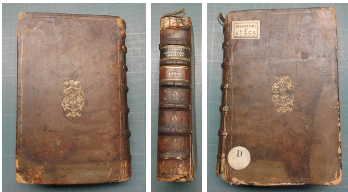
Figure 4 Ouvrage comportant une ancienne greffe de cuir (avant intervention).