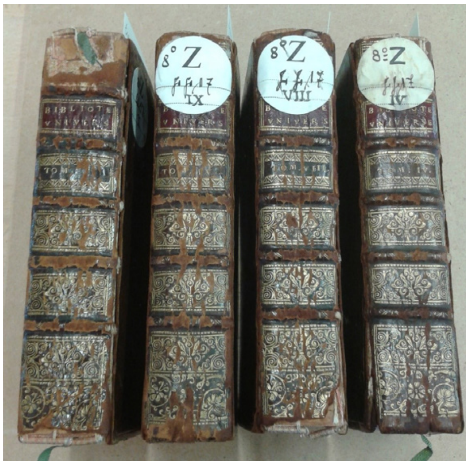
Figure 3 Ouvrages dont les cuirs de couverture présentent des fissures verticales sur le dos. Ces altérations mécaniques sont liées aux ouvertures répétées des volumes.