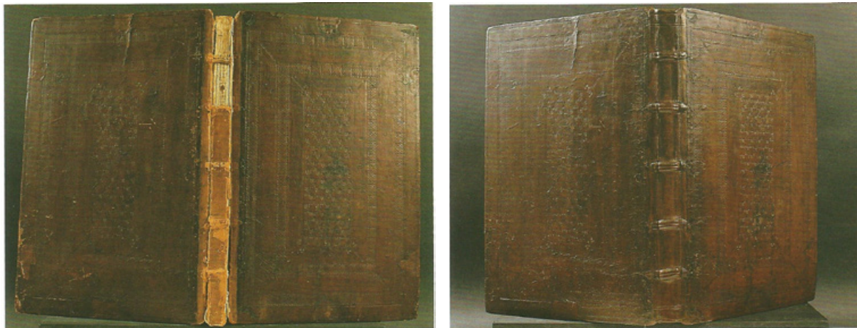
Figure 6 Dérestauration et pose d'un nouveau dos sur une reliure vénitienne du xv e siècle. La greffe de cuir effectuée dans le passé sur le dos de l'ouvrage a été supprimée et remplacée.

en partie les différences de traitement, dans le passé comme dans le présent, sur les livres anciens.