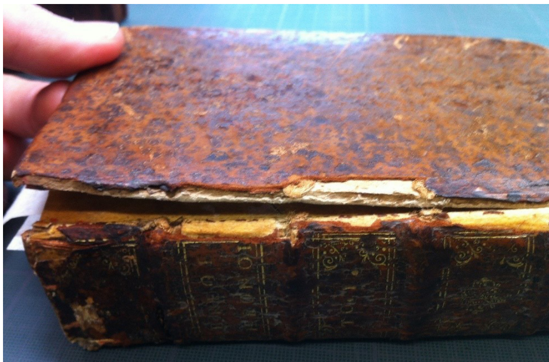
Figure 1 Reliure courante du XVII e siècle portant des traces de cirage et de recollage. La rupture du mors est au moins en partie imputable à l'usage de l'objet.

Bien qu'un objet technique ne puisse être résumé à sa seule fonction, les opérations visant à lui rendre son utilité compliquent la tâche du conservateur-restaurateur. L'exemple de l'instrument de musique est particulièrement approprié : l'intervention devrait-elle avoir pour but la mise en état de jeu ? Si oui, l'opération requiert les compétences d'autres intervenants (musiciens spécialistes de l'époque de l'instrument). De la même façon, on peut estimer que le rétablissement de la fonction d'un livre (disponibilité à la consultation par le public) nécessite les connaissances spécifiques du relieur et de l'historien de la reliure, en plus du travail de conservation-restauration. La question se complique encore davantage lorsque l'objet revêt un caractère de grande préciosité. Certains éléments sont jugés comme remplaçables, d'autres comme capitaux. En théorie, le travail de conservation-restauration et celui de remise en fonction ne doivent pas se nuire mutuellement. En pratique, la décision est bien souvent tributaire des valeurs accordées - parfois sans recul critique - à l'objet dans son ensemble et à ses éléments.