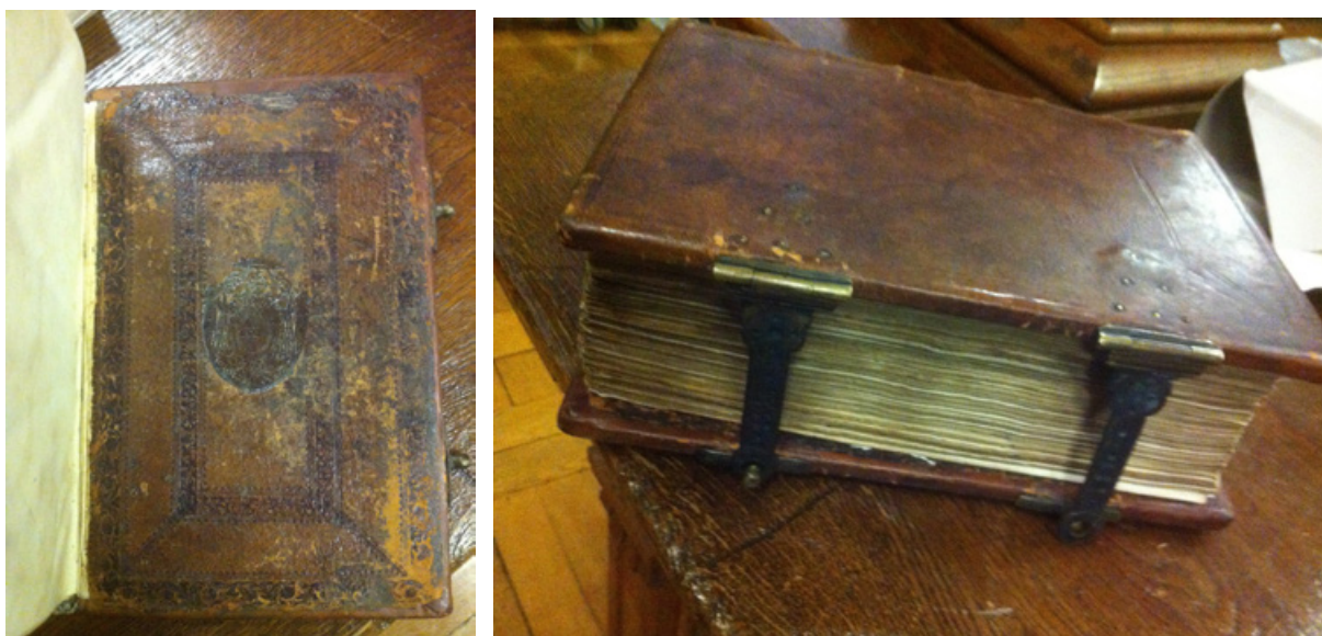
Figure 7 Volume dont la reliure a été refaite au xix e ou au xx e siècle. Les anciens plats ont été considérés comme suffisamment importants pour être réinsérés sur les contreplats de la nouvelle reliure.

La reliure présentant une démarche intimement liée à celle de la conservation-restauration, peut-elle être qualifiée de patrimoine culturel? La notion de bien culturel se réfère à tous les objets auxquels notre société porte un intérêt historique, artistique, anthropologique ou documentaire. Sa définition demeure vague et aboutit souvent à une énumération des objets en question. Le terme présente cependant l'avantage d'abolir les catégories anciennes (œuvres d'art, objets techniques, antiquités, objets ethnographiques) que l'intérêt grandissant des sciences humaines à l'égard des objets patrimoniaux a rendu désuètes. Le qualificatif de « patrimoine culturel » englobe non seulement les objets matériels (les biens culturels) mais aussi les traditions orales, chorégraphies, rituels, traditions, etc. Dans une perspective de préservation des savoir-faire artisanaux ayant permis la création d'un grand nombre