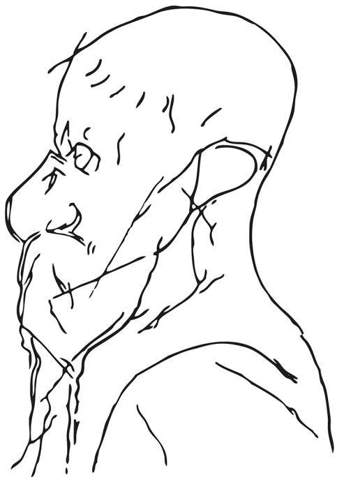
FIG. 2. — Individu humain gravé à La Marche (Vienne). (Pales & Tassin de Saint-Péreuse 1976: Obs. 6, relevé L. Pales).

nombreux d'individualisation des animaux peuvent être recensés dans les études monographiques correspondant aux sites ornés importants attribués au Magdalénien moyen: Las Monedas (Ripoll 1972), Le Tuc d'Audoubert (Bégouën et al. 2009), Les Trois-Frères (Bégouën et al. 2014), Altamira (Freeman & Gonzalez Echegaray 2001), Rouffignac (Barrière 1982; Plassard 1999), Niaux (Clottes 2010), Le Roc-aux-Sorciers (Iakovleva & Pinçon 1997), Altxerri (Altuna 1997), Ekain (Altuna 1997), Tito Bustillo (Balbín & Moure Romanillo 1981, 1982) et Le Portel (Beltrán et al. 1966).