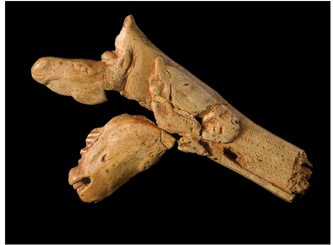
Fig. 6. — Fragment de propulseur sculpté et gravé de trois têtes de chevaux, dont une est décharnée. Grotte du Mas-d'Azil (Ariège). Musée d'Archéologie nationale de Saint-Germain-en-Laye (MAN inv. 47080).