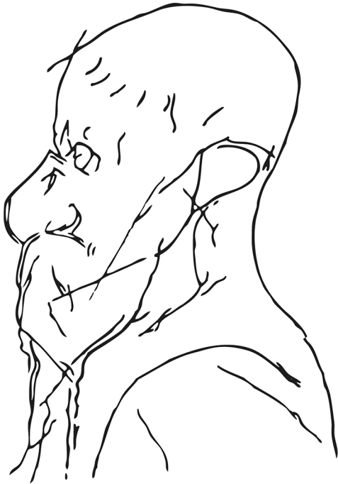
FIG. 2. — Individu humain gravé à La Marche (Vienne). (Pales & Tassin de Saint-Péreuse 1976: Obs. 6, relevé L. Pales).

nombreux d'individualisation des animaux peuvent être recensés dans les études monographiques correspondant aux sites ornés importants attribués au Magdalénien moyen: Las Monedas (Ripoll 1972), Le Tuc d'Audoubert (Bégouën et al. 2009), Les Trois-Frères (Bégouën et al. 2014), Altamira (Freeman & Gonzalez Echegaray 2001), Rouffignac (Barrière 1982; Plassard 1999), Niaux (Clottes 2010), Le Roc-aux-Sorciers (Iakovleva & Pinçon 1997), Altxerri (Altuna 1997), Ekain (Altuna 1997), Tito Bustillo (Balbín & Moure Romanillo 1981, 1982) et Le Portel (Beltrán et al. 1966).