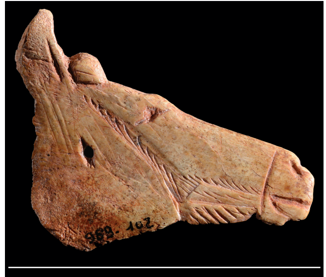
FIG. 4. — «Contour découpé» découvert dans la grotte d'Enlène (Ariège). Barre d'échelle: 5 cm.

souvent segmentaires dominant largement les figurations de têtes de chevaux (Cattelain & Bellier 2014). Dans la plupart des cas, ces objets sont façonnés sur la base d'un os stylohyoïde de cheval peu modifié (Cattelain & Bellier 2014) – un os plat dont la forme évoque naturellement la silhouette triangulaire d'une tête de cheval (Delporte 1990). Ce sont donc des objets particulièrement reconnaissables qui respectent un répertoire graphique et morphologique commun (Buisson et al. 1996). Ces contours découpés représentant des chevaux constituent paradoxalement des pièces très peu stéréotypées les unes par rapport aux autres, et chaque objet se différencie des autres au sein des collections importantes (Cattelain & Bellier 2014). Les contours découpés de Labastide (Fritz & Simonnet 1996) montrent en revanche une homogénéité très inhabituelle. Cette homogénéité est parfois extrapolée à l'ensemble de ce type d'objet, malgré l'absence de chevaux représentés dans cette collection et le caractère exceptionnel de ces pièces découvertes groupées dans un espace réduit.