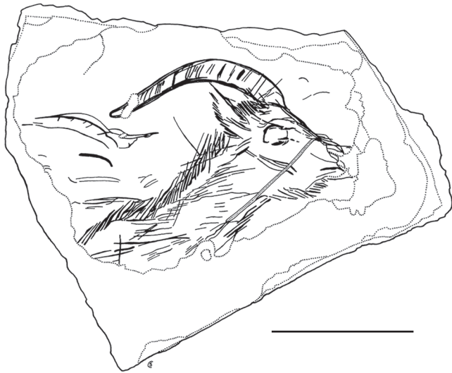
FIG. 3. — Bouquetin réaliste gravé sur une plaquette de grès de la grotte d'Enlène (Ariège). Coll. Bégouën au Musée de l'Homme, Paris; relevé Servelle. Barre d'échelle: 3 cm.

souvent segmentaires dominant largement les figurations de têtes de chevaux (Cattelain & Bellier 2014). Dans la plupart des cas, ces objets sont façonnés sur la base d'un os stylohyoïde de cheval peu modifié (Cattelain & Bellier 2014) – un os plat dont la forme évoque naturellement la silhouette triangulaire d'une tête de cheval (Delporte 1990). Ce sont donc des objets particulièrement reconnaissables qui respectent un répertoire graphique et morphologique commun (Buisson et al. 1996). Ces contours découpés représentant des chevaux constituent paradoxalement des pièces très peu stéréotypées les unes par rapport aux autres, et chaque objet se différencie des autres au sein des collections importantes (Cattelain & Bellier 2014). Les contours découpés de Labastide (Fritz & Simonnet 1996) montrent en revanche une homogénéité très inhabituelle. Cette homogénéité est parfois extrapolée à l'ensemble de ce type d'objet, malgré l'absence de chevaux représentés dans cette collection et le caractère exceptionnel de ces pièces découvertes groupées dans un espace réduit.