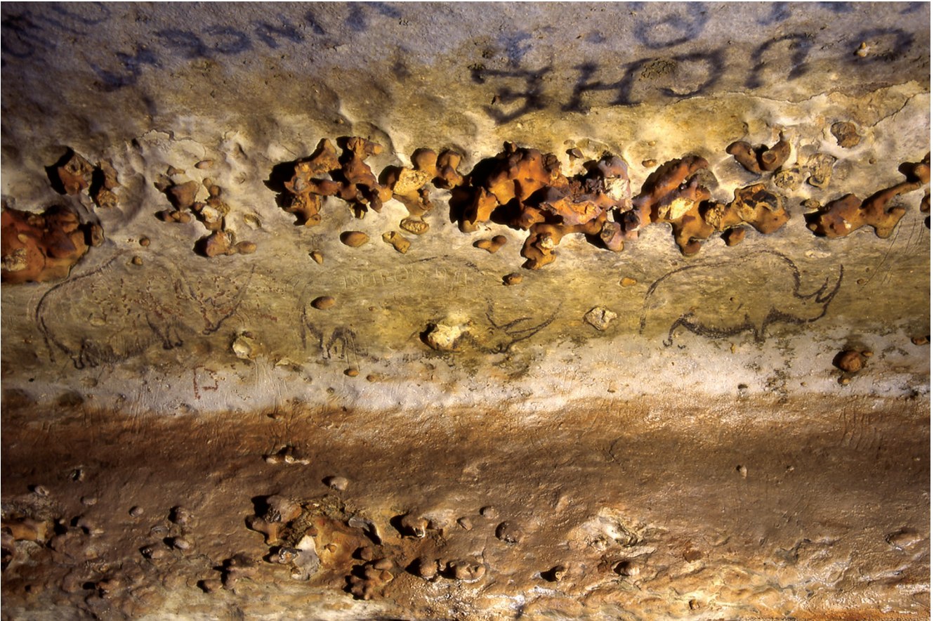
FIG. 1. — Grotte de Rouffignac (Dordogne). Frise de trois rhinocéros laineux ( Coelodonta antiquitatis Blumenbach, 1807) dont chacun est différenciable.