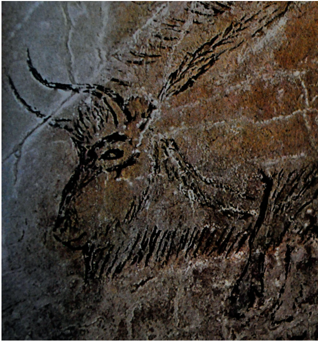
Fig. 7. — Bison du Salon noir de la grotte de Niaux (Ariège) donnant à voir un «visage».