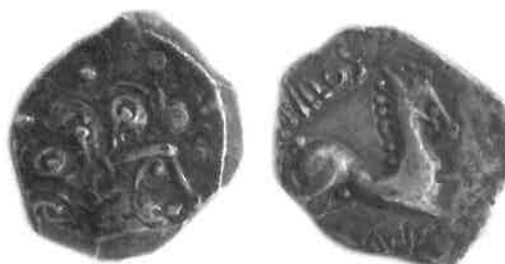
Fig. 5 : monnaie à la croix ANTILLOS COVRA/ COVERTOMOTVL (agrandissement x 2). Musée Saint-Raymond (Toulouse), n° inv. 2010.1.43.