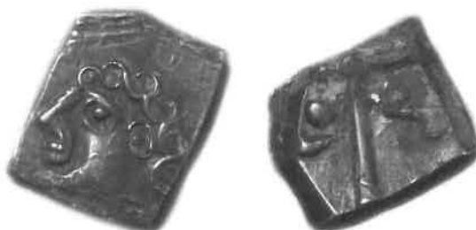
Fig. 10 : monnaie à la croix du groupe du Causé (agrandissement x 2). Trésor du Causé, musée Saint-Raymond (Toulouse), n° inv. 2000.18.77.

Ces monnaies, dont on ne connaît pas assez de provenances pour les attribuer à un peuple, sont datées entre 150 et 75 avant J.-C.