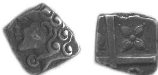
Fig. 6 : monnaie à la croix du groupe flamboyant (agrandissement x 2). Trésor de Dunes (Labrousse & Boudet, 1993), musée Saint-Raymond (Toulouse), n° inv. 80.1.196.

Les poids de ces monnaies sont souvent élevés. Leurs émissions ont pu commencer dès la fin du III e siècle avant J.-C.