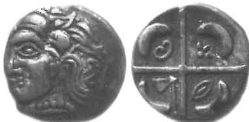
Fig. 3 : monnaie à la croix du groupe languedocien (agrandissement x 2). Société archéologique de Montpellier, n° 453 (Richard et Lope, 2017).

La dispersion des monnaies attribuées au groupe languedocien suggère qu'elles ont pu être frappées dans plusieurs ateliers distincts. Globalement, les émissions concernent la même région que les imitations de Rhodè, soit principalement l'axe Aude-Garonne et ses marges, mais pénètre davantage la plaine languedocienne en direction du Rhône.