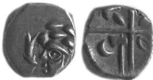
Fig. 4 : monnaie à la croix du groupe cubiste (agrandissement x 2). Trésor de Dunes (Labrousse & Boudet, 1993), musée Saint-Raymond (Toulouse), n° inv. 80.1.2.

L'épicentre du groupe cubiste se situe entre Toulouse et Narbonne. La diffusion de ce groupe est documenté par de très nombreux trésors qui illustrent le rôle joué par ces émissions dans les échanges ; certaines découvertes périphériques, comme le trésor de Lattes, peuvent résulter de capitaux portés jusqu'à ce port en vue d'une acquisition, par exemple une cargaison de marchandises. En dehors de ces ensembles, les monnaies de style cubiste sont aussi parmi les monnaies à la croix les plus répandues sur les sites d'habitat.