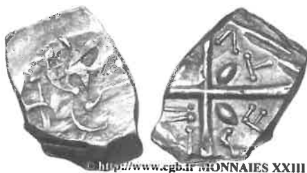
Fig. 3 : monnaie à la croix COVERTOMOTVL (CGB.fr bga_411517) (agrandissement x 2).