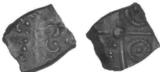
Fig. 11 : monnaie à la croix du groupe au torque (agrandissement x 2). Ville de Périgueux - collection du Musée d'art et d'archéologie de Périgueux, n° inv. L.371.

Enfin, le troisième type est tout à fait emblématique et marque l'originalité des Rutènes, puisque la croix du revers est remplacée par un sanglier, qui peut être traité de manières très différentes. Au droit, la tête à gauche peut être très petite et entièrement cernée d'un grènetis ou traitée en masses juxtaposées, obtenues par la répétition d'un même motif. Plusieurs variantes en sont connues. Sa datation se situe vers 75-50 avant J.-C.