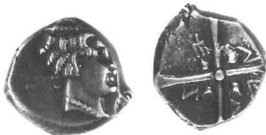
Fig. 1 : monnaie à la croix AUNTIKI (BnF 3558) (agrandissement x 2).

Plusieurs légendes latines sont également attestées sur les monnaies à la croix : un type associant un triscèle au droit et la légende SETVBO au revers (DCR-287 et 287A) (Fig. 4 15), dans les cantons d'une croix offrant une hache évidée accompagnée de trois points au 3e canton et une olive dans les autres cantons ; un type ORTVBO avec au droit un fleuron et au revers le même schéma que pour le type précédent (DCR-288) ; un type COVERTOMOTVL (DCR-289) (Fig. 3), avec au droit un fleuron à quatre pétales en S, entouré de S bouletés et au revers une hache évidée et trois points au 3e canton, une olive rattachée au centre par un petit trait aux 1er, 2e et 4e cantons et la légende COVE RTOM OTVL sur ces mêmes cantons ; un type ANTILLOS COVRA/ COVERTOMOTVL (DCR-292), avec un cheval bondissant à droite et au revers le même schéma que précédemment ; et enfin un type ANTILLOS COVRA (DCR-293) (Fig. 5, ex. du trésor du Causé II, MSR), avec au droit une tête à droite avec un fleuron derrière et au revers le même cheval bondissant à droite, avec la légende. Ces monnaies se trouvent dans la même zone que les précédentes, mais plus resserrée entre Le Causé (Tarn-et-Garonne) et La Lagaste (Aude). Elles sont datées entre 100 et 50 avant J.-C.