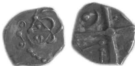
Fig. 7 : monnaie à la croix du groupe à la tête triangulaire (agrandissement x 2). Trésor de Dunes (Labrousse & Boudet, 1993), musée Saint-Raymond (Toulouse), n° inv. 80.1.119.

D'après la carte de répartition des monnaies de ce groupe, une attribution aux Cadurques (Cahors) est proposée. Mais leur éparpillement le long de l'axe Aude-Garonne recouvre probablement un groupe hétérogène qui reste à classer plus précisément.