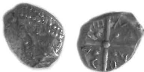
Fig. 2 : monnaie à la croix AKEREKONTON. Trésor de Dunes (Labrousse & Boudet, 1993), musée Saint-Raymond (Toulouse), n° inv. 80.1.148, (agrandissement x 2).