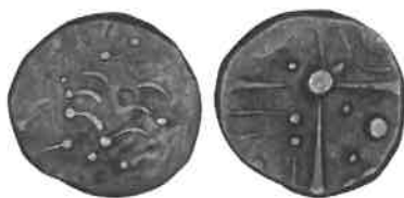
Fig. 8 : monnaie à la croix du groupe Cuzance (agrandissement x 2).

Ces monnaies pourraient avoir été frappées par les Cadurques ou les Nitobroges, dans le deuxième quart ou le milieu du 1er siècle avant J.-C.