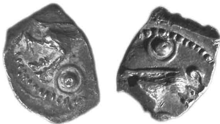
Fig. 7 : deux monnaies au sanglier attribuables aux Rutènes ; musée Fenaille (Rodez), Collection SLSAA n° 2 et n° 18.

L'application d'une telle méthode trouve son intérêt dès lors que l'on a affaire à des monnaies qui ne présentent pas la totalité de la gravure initialement inscrite sur le coin monétaire. Par exemple, considérons le revers des deux monnaies de la Fig. 7 : sans avoir reconstitué l'empreinte complète à partir de plusieurs exemplaires, il est impossible de conclure sur l'utilisation d'un coin monétaire unique ; l'étude des coins trouvait là un frein qu'il est aujourd'hui possible de lever.