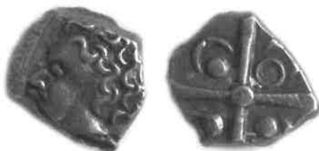
Fig. 5 : monnaie à la croix du groupe à la tête négroïde (agrandissement x 2). Trésor de Dunes (Labrousse & Boudet, 1993), musée Saint-Raymond (Toulouse), n° inv. 80.1.49.

Poids : autour de 3,50 g et séries légères.