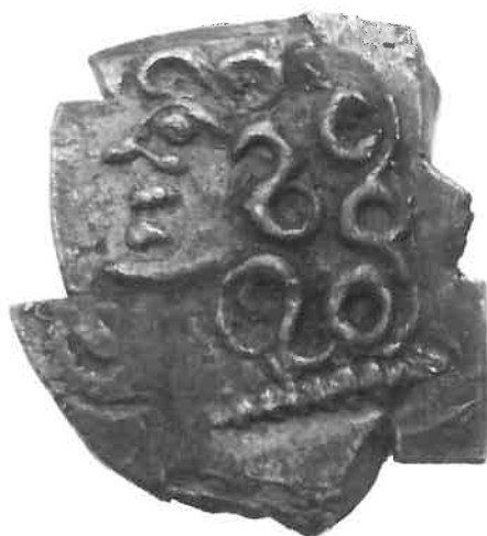
Fig. 6 : reconstitution réelle à partir de plusieurs exemplaires du trésor de Goutrens, musée Saint-Raymond (Toulouse), n° inv. 2000.18.111 (agrandissement x 3).

L'application d'une telle méthode trouve son intérêt dès lors que l'on a affaire à des monnaies qui ne présentent pas la totalité de la gravure initialement inscrite sur le coin monétaire. Par exemple, considérons le revers des deux monnaies de la Fig. 7 : sans avoir reconstitué l'empreinte complète à partir de plusieurs exemplaires, il est impossible de conclure sur l'utilisation d'un coin monétaire unique ; l'étude des coins trouvait là un frein qu'il est aujourd'hui possible de lever.