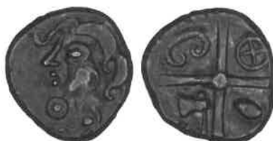
Fig. 9 : monnaie à la croix du groupe Belvès (agrandissement x 2).

Une attribution a été faite aux Pétrocères, mais très peu de provenances étant connues, celle-ci reste hypothétique. Les monnaies sont datées entre 75 et 50 avant J.-C.