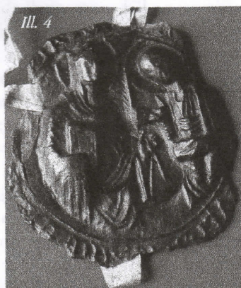
Saint-JEAN de Laon (1282)