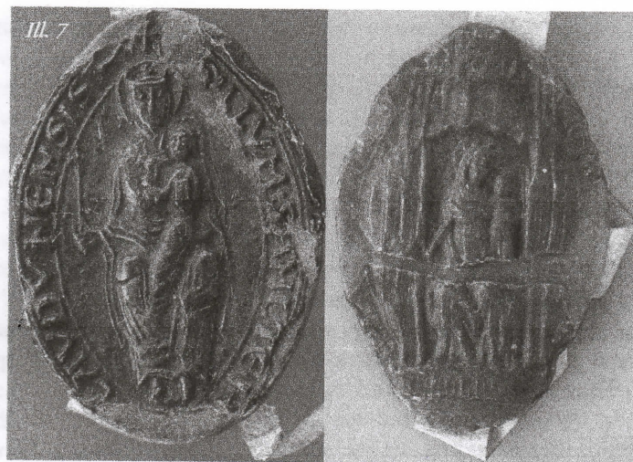
Chapitre cathédral de Laon (1209 et 1391)

Quand rencontre-t-on l'iconographie mariale sur les sceaux du Laonnois ? Celle-ci apparaît très tôt dans la région (1170) et se maintient jusqu'au XV e siècle au moins. Il semble ainsi que dès qu'il se dote d'une matrice, le chapitre cathédral de Laon adopte la figure en majesté de la Vierge à l'Enfant (Ill. 7). A partir de 1170, les empreintes montrent la Vierge de face, assise sur un trône qui reste invisible, portant l'Enfant assis sur son genou tandis qu'elle tient dans un geste raide un sceptre fleurdelisé sur le côté, entre le pouce et l'index. Marie est couronnée et nimbée tandis que Jésus, également nimbé, tient les évangiles et bénit de la main droite. Le chapitre,