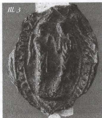
Aumônier de Saint-Jean de Laon (1420)