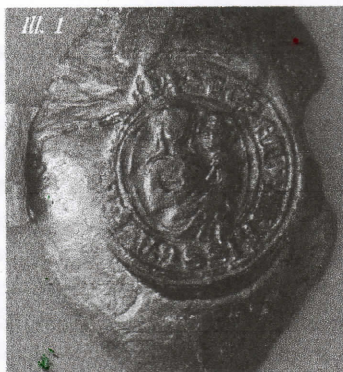
Contre-sceau d'Isabelle Abesse d'Origny (1303)

La figure de la Vierge devient centrale dans l'iconographie religieuse du Moyen Âge à partir du XII e siècle. Le Laonnois n'échappe pas à ce mouvement. Comme dans de nombreuses cités épiscopales, l'église cathédrale est consacrée à Marie et un certain nombre de communautés religieuses se placent sous le patronage de la Vierge : l'abbaye de Thenailles, Notre-Dame de Liesse ou encore Paix-Notre-Dame. Statues, peintures murales, enluminures, tableaux et vêtements liturgiques magnifient le rôle de la mère du Christ, souvent associée à l'Enfant. En dehors de ces documents prestigieux, on trouve des traces de cette dévotion mariale dans des objets du quotidien comme les bijoux ou les sceaux.