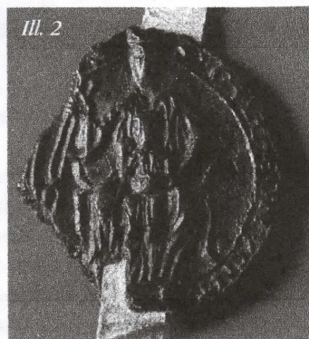
Abbaye de Thenailles (1303)

Mais d'autres images évoquent la Vierge sans la faire figurer en elle-même : par exemple le lys et la rose, deux fleurs qui lui sont dédiées. Cette iconographie est toutefois à manier avec prudence : le lys est également un symbole christique et trinitaire. De plus, dans le royaume de France, il peut être le signe d'un rattachement au pouvoir royal. Ainsi, sur 16 sceaux du Laonnois montrant comme figure principale un lys, 11 relèvent de l'administration royale (baillages, prévôtés et prévôts), 5 seulement appartiennent à des religieux. Dans ce cas, seuls les lys des sceaux des membres du clergé peuvent être envisagés comme des allusions à la Vierge. Par exemple, en 1226 les sceaux de Robert, sous-doyen de Laon, et de Garin, doyen du petit chapitre de chanoines de Saint-Julien de Laon, montrent des lys qui renvoient à une dimension religieuse et non royale. Quant à la rose, elle figure de 1214 à 1446 au contre-sceau de l'officialité de l'évêque de Laon, c'est-à-dire sa cour de justice (Ill. 6).