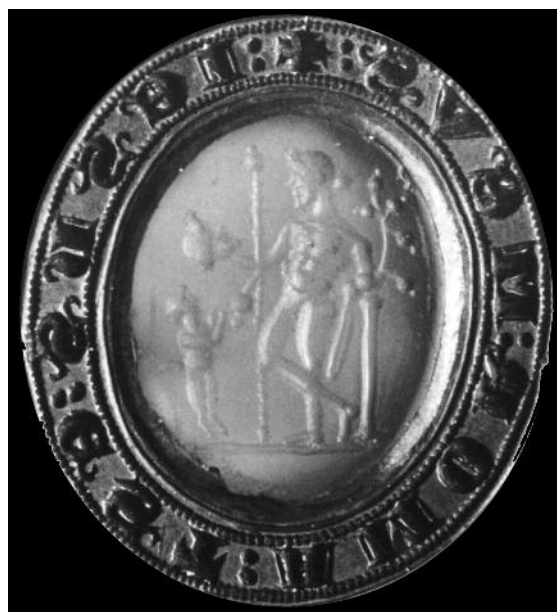
© British Museum, P&E 1923, 5-8.1.

À l'inverse, certaines associations d'intailles au nu et de légendes étonnent au premier abord, surtout en raison de la qualité des sigillants. Ainsi, de 1246 à 1260 au moins, trois abbés de Saint-Maur-des-Fossés utilisent au revers de leurs trois grands sceaux la même matrice sertie d'une intaille montrant un Silène grassouillet, ivre, allant dos au chemin, renversé sur un âne mené par un bacchant (fig. 7) 37 . L'iconographie est d'autant plus surprenante pour des religieux se trouvant à la tête de l'une des plus grandes abbayes d'Île-de-France qu'elle prête le flanc à une critique très commune à l'époque : l'ivrognerie et la paresse des moines 38 . La légende paraît du reste conforter cette image : ✠ GRA(tia) DEI SVM • ID •