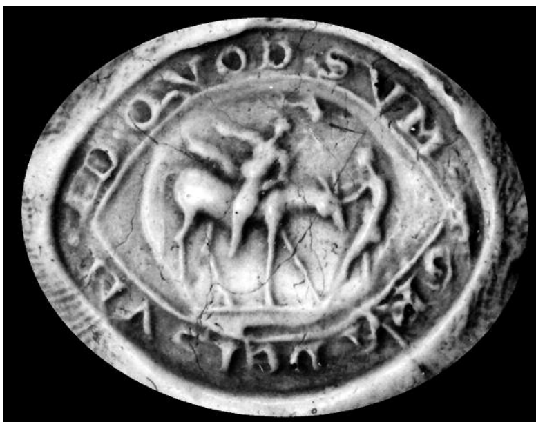
© Arch. nat. D 9054 bis. Cl. C. Simonet.