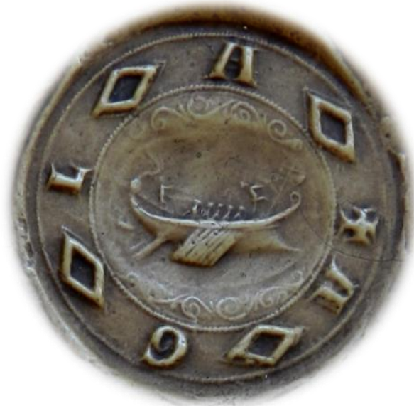
Ib. Contre-sceau (agrandissement) de Marguerite de Beaumont-Leicester (ANF, moulage sc/N56 bis )

Marguerite de Beaumont-Leicester possédait un autre sceau plus petit, connu par une empreinte unique 3 . Ronde et mesurant 33 mm, sa matrice offrait un champ orné de rinceaux et serti d'une intaille antique ovale de 20 mm sur 15 mm, soit une dimension assez honorable : si les plus grandes pierres gravées recensées par Demay 4 dépassent les 30 mm (un camée de Charles le Chauve atteint les 44 mm 5 ), leur taille moyenne est d'environ 15 mm. La gemme de Marguerite de Beaumont-Leicester était gravée d'une trirème, navire de guerre qui ornait parfois les intailles romaines anciennes. La légende circulaire ne mentionne pas le nom de la sigillante, la nature de son sceau ou une prière à la Vierge, occurrences les plus fréquentes. Elle déploie quatre lettres à la suite d'une croisettes, avec des mâcles de Quincy insérées entre chacune : / ✠ A ◊ G ◊ L ◊ A ◊ /.