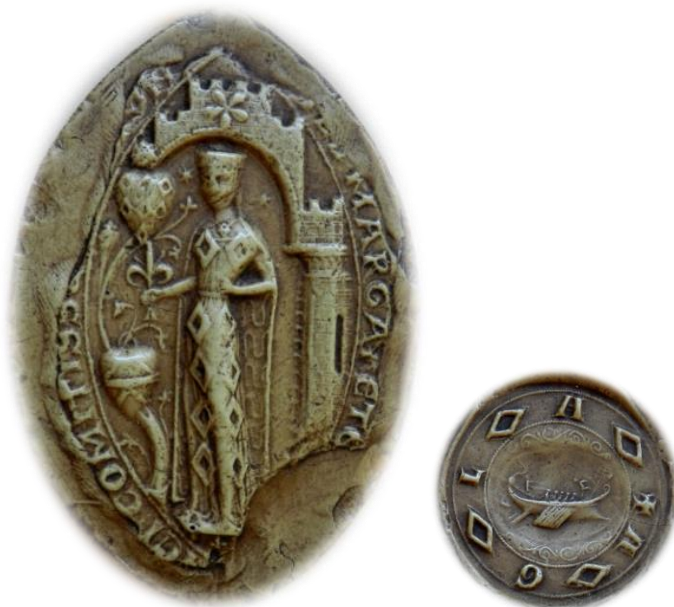
1a. Grand sceau et contre-sceau de Marguerite de Beaumont-Leicester (ANF, moulages sc/N56-56 bis )

Les sceaux de Marguerite de Beaumont-Leicester sont bien connus des sigillographes. Cette dame est descendante des seigneurs de Beaumont-le-Roger devenus comtes de Meulan, en Vexin français, puis comtes de Leicester ( voir annexe ). Elle est mariée avant 1180 à Saer de Quincy, seigneur britannique devenu le premier comte de Winchester vers 1207. Veuve en 1219, Marguerite de Beaumont-Leicester utilise un grand sceau en navette de 82 mm sur 51 mm. La matrice peut dater de la création du titre comtal de Winchester car la légende rappelle les titres de dame de Quincy et de comtesse de Winchester : / [SI]GILL'(um) MARGARETE [DE QVE]NCI . COMITISSE : W[INTONI]JEN[S'(is)] / 1 . La sigillante y figure en pied sous un dais architectural, tenant fleuron, vêtue d'une robe armoriée de mâcles. Deux écus aux armes sont suspendus à un arbre au tronc tourmenté : aux sept mâcles des Quincy en haut ; à la fasce accompagnée de deux chevrons, l'un en chef, l'autre en pointe , soit les armoiries de Robert Fitzwalter, en bas 2 .