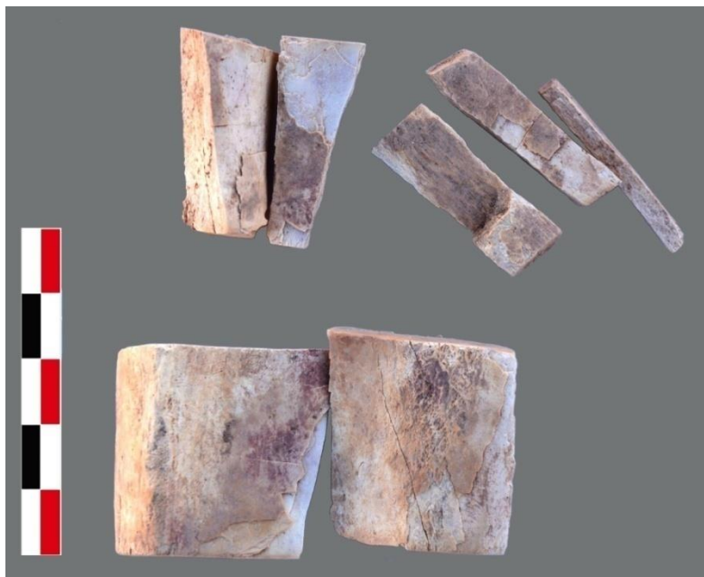
Figure 2 : Os de dromadaires découpés et décharnés découverts à Samut Nord.

Les dromadaires morts sur place, à Bir Samut ou Samut nord, étaient presque toujours consommés comme l'attestent les nombreuses traces de découpe et de décharnement (figure 2) sur les os (dromadaires et ânes étaient traités de façon identique, démembrés et désossés). Cette viande n'était habituellement pas consommée dans la vallée du Nil et les Grecs et les Égyptiens avaient sans doute quelques préventions envers la viande de l'animal (dans les sources classiques, on en évoque la consommation, mais uniquement chez les populations bédouines d'Égypte ou d'Arabie 13 ). Cela dit, les occupants du fort et de la mine ne perdaient sans doute aucune occasion pour s'assurer un apport en protéine animale et ces abattages occasionnels devaient fournir ponctuellement de grandes quantités de nourriture. Il s'agit la plupart du temps d'animaux de réforme (trop âgés ou blessés).