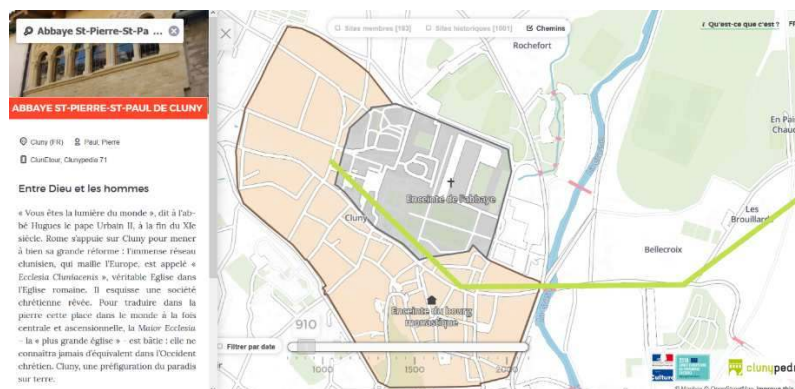
Figure 3 : Clunypedia, « chemin » (vert) depuis l'abbaye St-Pierre Saint-Paul de Cluny.

Les data sont filtrées par quatre entrées possibles de ressources – ces dernières sont organisées à partir de données historiques temporelles (date) modulables par l'utilisateur sur un temps long (plus de 1000 ans), à cela s'ajoute une double entrée « sites » différenciée (« sites membres », « sites historiques ») et enfin une entrée « chemins » qui relie plusieurs points, mais dont le code couleur (vert) diffère des sites clunisiens géolocalisés (rouge). Ces chemins (vert) en développement, géolocalisent des points d'intérêt (Figure 3) dans l'espace urbain et au-delà (voies communales), formant un circuit pédestre et routier de visite à l'instar d'un guide voyage.