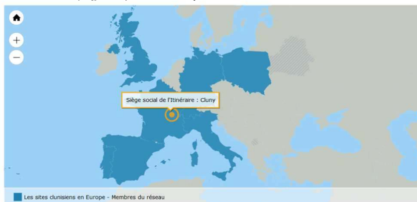
Figure 1 : Le réseau « Les sites clunisiens en Europe ».

Suite à la labellisation des sites clunisiens (2005), ce réseau acquiert une double reconnaissance patrimoniale – d'une part, celle d'itinéraire culturel européen (ICE) du Conseil de l'Europe issue des valeurs fondatrices de cette institution européenne prônant un dessin de paix entre les Nations puis celle de Grand itinéraire culturel. Ces mentions posent le cadre éthique et le champ d'action transnational quant aux dynamiques patrimoniales des itinéraires culturels européens en tant qu'objet de patrimonialisation bénéficiant d'une labellisation institutionnelle. Par ailleurs, notons que les critères d'éligibilité conduisant à l'obtention politique du précieux label ne précisent pas a priori de formes patrimoniales pré-retenues (matériel, immatériel, naturel) au processus de reconnaissance. Ils s'inscrivent plutôt dans une rémanence mémorielle de patrimoines européens comme identité locale à rayonnement européen. De même, notons que l'appellation « site clunisien » est sujette à une construction politique et citoyenne dont la finalité est de rassembler un ensemble de lieux matériels (prieuré, monastère, abbaye, doyenné, collège, seigneurie, etc.) épars en Europe réunissant des patrimoines (matériel, immatériel, naturel) d'une communauté monastique médiévale formant un réseau (Figure 1) cohérent ayant conduit à sa labellisation.