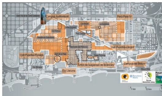
Figure n 1 : Plan de Poblenou et logos des entreprises publiques, 2010 .

l'incubateur de Barcelone. D sormais, des d compositions, apparitions, disparitions, remodelage d'ilot et l'imposition d'une tour symbole doivent permettre de r g n rer le quartier d'entreprise tout en recherchant la mixit  urbaine   l' chelle du district de San Marti incluant en grande partie les op rations de Poblenou 22@ ( Figure n 1 ).