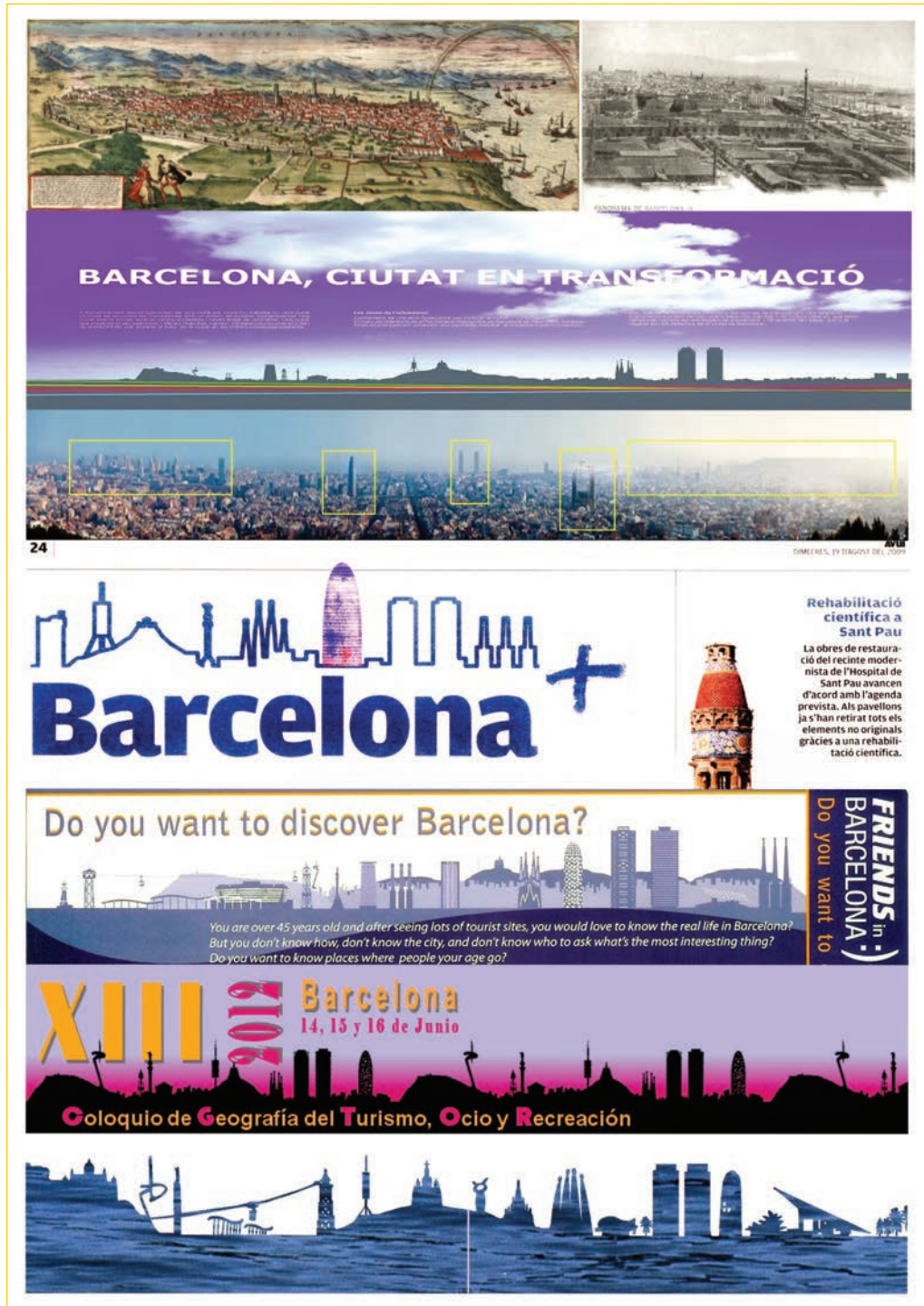
Figures n°6 : Incorporation de la Torre Agbar dans la silhouette de la ville : collage de panoramas identitaires. Panorama de Barcelone en 1535. La ville dans sa globalité depuis Montjuich. Anton van den Wyngaerde. Panorama de Barcelone en 1910, juste après l'exposition universelle de 1888, Le monument à Colomb. Panorama depuis l'intérieur des terres, 2010, PB, les 5 points focaux de localisation. Panorama, silhouette de la ville du journal Avui, 2009, Avec l'aimable autorisation du journal catalan®. Panorama, silhouette de la ville du journal, Barcelona Friends, 2010, ®. Panorama, silhouette de la ville du colloque de tourisme à Barcelone, 2012. Panorama, silhouette de la ville du port olympique et école de voile, Avui, 2008, brochure publicitaire ®