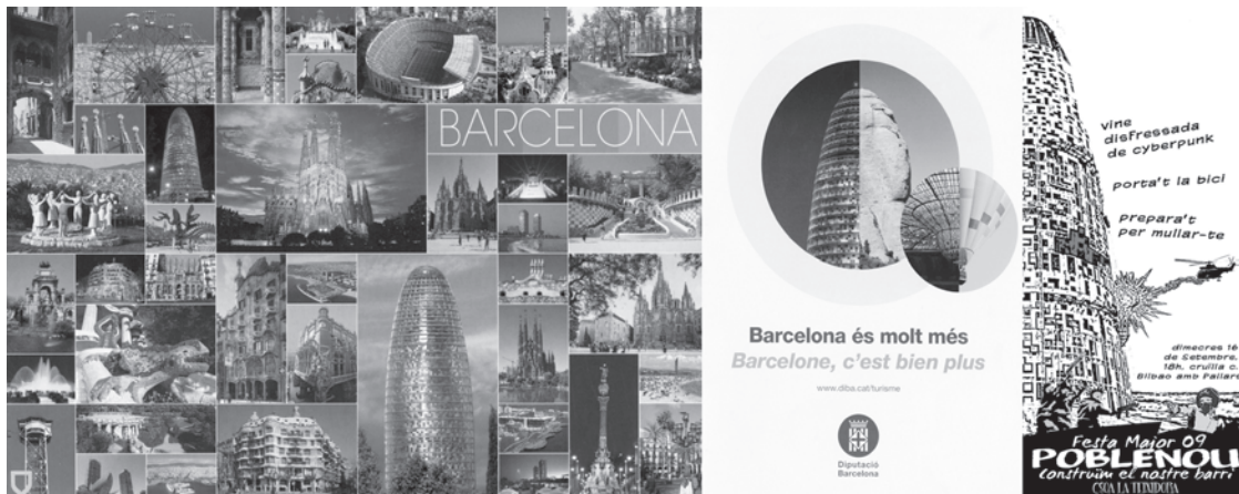
Figure n°5 : Carte postale mosaïque de Barcelone, Avec l'aimable autorisation d'Escut d'Or ® , « Barcelone, c'est bien plus », brochure n°11 de l'OTB ® , Invitation à la Festa Major alternative de 2009 de Poblenou « Viens déguisé en cyberpunk, apporte ta bicyclette, viens prendre un verre. Construisons notre quartier. » Flyers.

simplification d'une ville à ces quelques monuments phares permet dans certaines cartes postales de souligner le poids important de la tour Agbar comme monument représentatif de la ville. La tour est alors l'un des rares éléments contemporains, à côté des églises et des maisons de Gaudi ( Figure n°5 ). Les cartes mosaïques de Barcelone voient l'empreinte de la tour Agbar se répéter et tenir une place quasi identique à la Sagrada Família, elle figure même sur les affichettes annonçant des fêtes alternatives de quartier, et devient l'emblème de la principale brochure touristique de Barcelone distribuée à l'étranger rappelant ses origines légendaires.