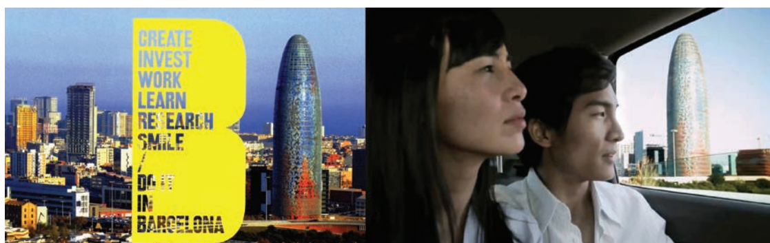
Figures n°4 : Publicité de la Barcelona Activa/22@. 2008, Barcelona Activa®. Avec l'aimable autorisation du 22@. Un jeune couple à la découverte de Barcelone. Image du spot publicitaire « Necesito España ». 2011. Avec l'aimable autorisation de l'OTE®