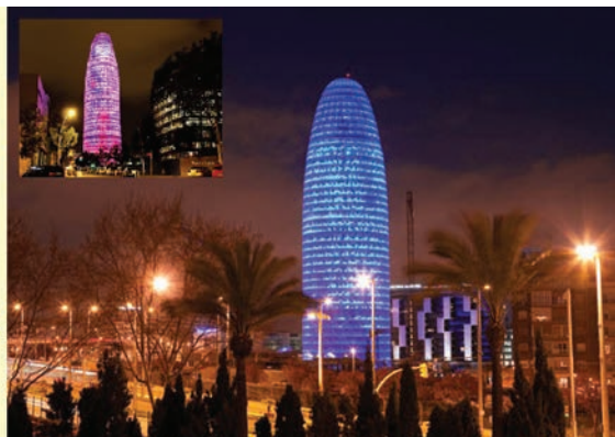
Figures n°3 : La Tour Agbar interactive : journée de l'autisme et de lutte contre le cancer du sein. Agbar 2010-1012 9 et Contre la Tour Agbar et le transfert des eaux de l'Èbre, 2007. « Ne nous trompons pas ! Le Transfert = appropriation de l'Eau et de l'argent public par la compagnie Agbar et la Caisse d'Épargne de Catalogne »

dans la tour, qui s'habille aux couleurs de la manifestation. Elle peut aussi devenir un compteur horaire géant pour l'annonce de la nouvelle année sur TVE Espagne monde, renforçant le soir de la Saint-Sylvestre l'identification de Barcelone avec la Tour Agbar illuminée pour l'occasion sur le modèle de Time Square à New York.