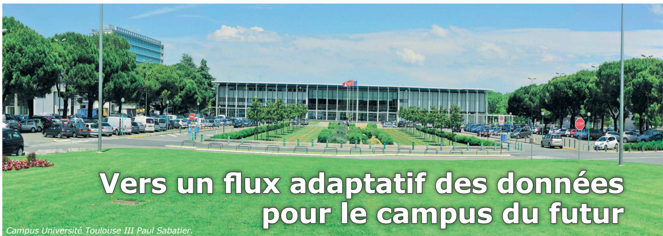
Campus Université Toulouse III Paul Sabatier.