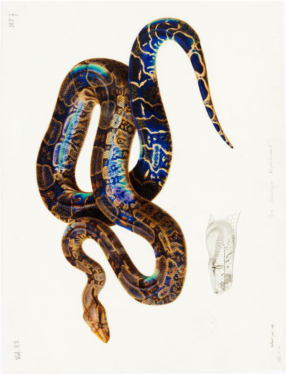
Figure 2 : Boa orophias , le Boa de Sainte-Lucie, vélin du Muséum national d’Histoire naturelle, peint par Antoine Jean Baptiste Vaillant en 1851.