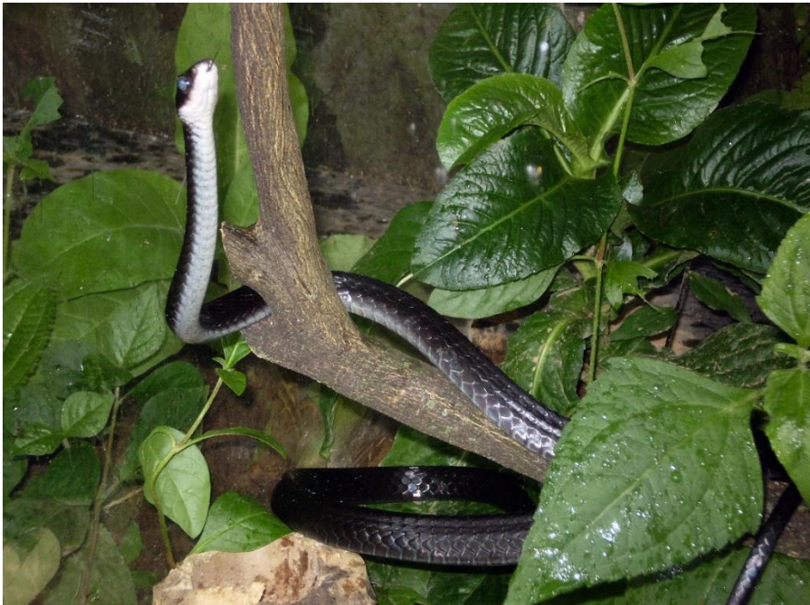
Figure 4 : Chironius vincenti , la Couleuvre de Saint-Vincent, photographée sur l'île de Saint-Vincent, septembre 2009.

Clelia clelia , espèce sud-américaine de l'Amazonie, des Guyanes, du Venezuela et de Trinidad est connue de Grenade par seulement quatre spécimens : un récolté en 1880 et déposé au Museum Comparative of Zoology d'Harvard, deux capturés par Lazell en 1964 et déposés à ce même Museum et un en 1967. Greer (1965) a décrit une sous-espèce, Clelia clelia groomei , à partir des deux spécimens de 1964. Dans sa révision très détaillée de toutes les espèces de Clelia , Zaher (1996) ne reconnaît pas la particularité de la sous-espèce C. c. groomei Greer, 1965. Depuis 1967, aucune Clelia clelia n'a été vue à Grenade malgré des recherches actives (Henderson & Berg 2006, 2011), le Gouvernement de Grenade a déclaré l'espèce éteinte sur l'île (Henderson & Powell 2018).