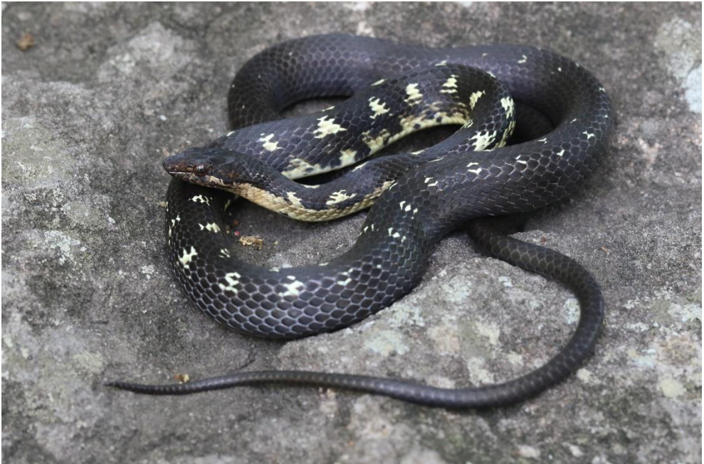
Alsophis sibonius , la Couleuvre sibonienne, photographiée à la Dominique, janvier 2020.

Erythrolamprus juliae juliae , the Dominican Julia's Ground Snake, photographed in Dominica, January 2020.