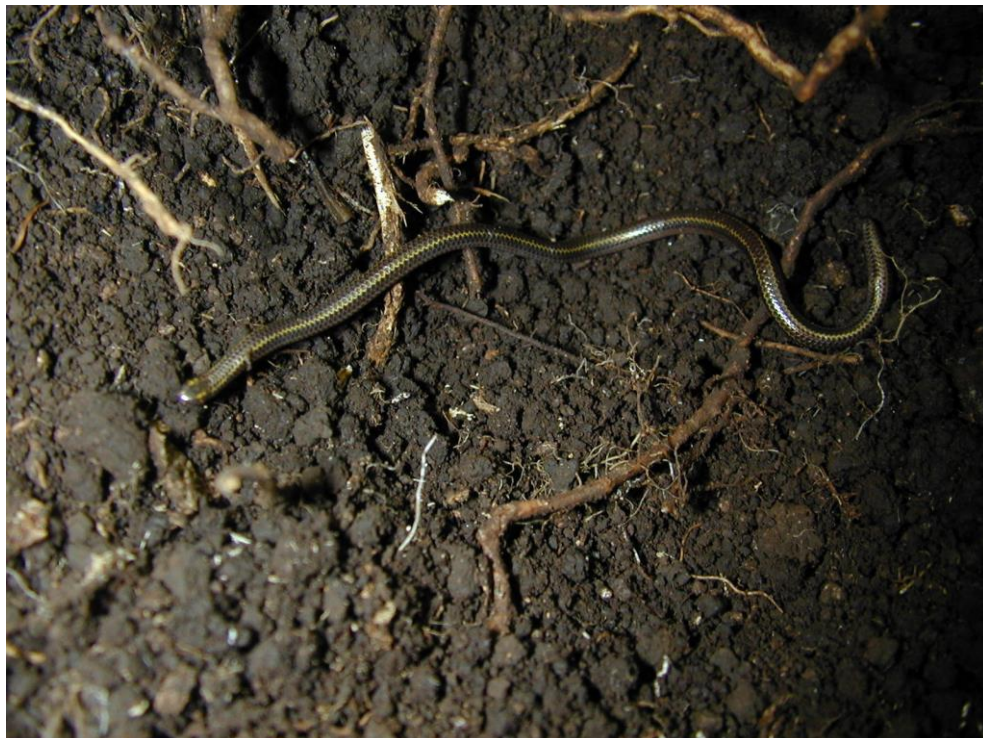
Figure 6 : Tetracheilostoma breuili , le Leptotyphlops de Sainte-Lucie, photographié aux Îles Maria, août 2006.

(Henderson & Powell 2006), probablement introduit avec du sable provenant de Guyana (Daudin & de Silva 2011). Depuis, des individus de cette espèce, introduits sans doute de la même manière, ont été vus sur d'autres îles des Grenadines : Union, Petite Saint-Vincent (Berg et al. 2009) et Carriacou (Henderson & Breuil 2012). L'espèce est arrivée aussi à Grenade, où elle est connue d'au moins cinq localités (Henderson & Powell 2018).