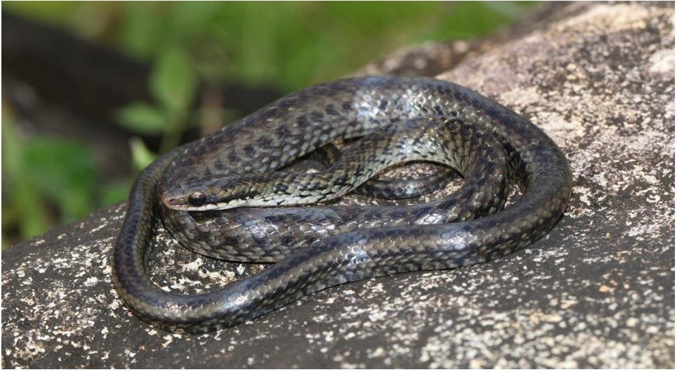
Erythrolamprus juliae juliae , la Couleuvre de Julia dominicaine, photographiée à la Dominique, janvier 2020.

Erythrolamprus juliae juliae , the Dominican Julia's Ground Snake, photographed in Dominica, January 2020.