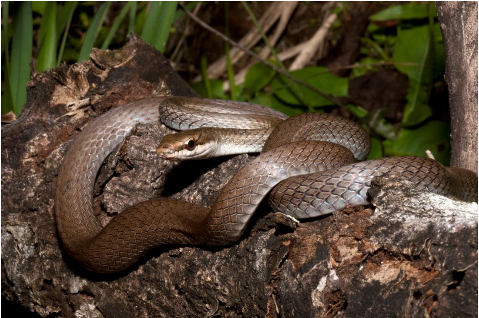
Figure 5 : Mastigodryas bruesi , la Couleuvre de Barbour, photographiée sur l'île Cariacou, Archipel des Grenadines, décembre 2005.

Mastigodryas bruesi (Fig. 5) est une espèce particulière à Saint-Vincent, les Grenadines et Grenade (Henderson & Powell 2018) ; ce Serpent est même présent sur l'île de Green, une petite île satellite de la Grenade. Il est arrivé malencontreusement vers les années 1970-80 à la Barbade, peut-être avec des régimes de bananes venant de Saint-Vincent (Underwood et al. 1999, Fields & Horrocks 2011), il y semble en expansion (Fields & Horrocks 2009, 2011).