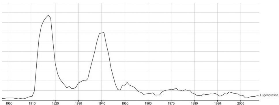
Figure 1 : Evolution de l'occurrence « Lügenpresse » de 1990 à 2016

M. Stürzenberger (activiste politique de PEGIDA) a tenu les propos suivants : « Berlin - Zentrale der Volksverräter » - « Berlin, la centrale des traîtres envers le peuple » lors du discours fêtant la deuxième année (2016) d'existence du groupe PEGIDA. Ils qualifient ainsi directement de nouveau les représentants gouvernementaux de dictateurs qui devront être punis pour leurs actes de trahison. En utilisant des termes comme « peuple » - « Volk » et « résistance » - « Widerstand », PEGIDA renforce encore ses accusations de trahison par l'usage d'une occurrence chargée historiquement dans l'histoire de l'Allemagne. Ainsi « Lügenpresse » - « presse mensongère » était parmi les mots favoris de J. Goebbels, ministre de propagande, qui l'utilisait pour dénoncer les critiques au régime nazi provenant des communistes et des juifs (cf. Vogel 2015). Ce terme fortement connoté est déjà utilisé dès le début du 20 ème siècle au cœur de mouvements populaires de l'époque et son usage équivaut à dire : La campagne mensongère de l'ennemi. Il apparaît également lors des campagnes de propagande de la RDA contre les idéaux de l'Ouest (cf. Buggisch 2015).