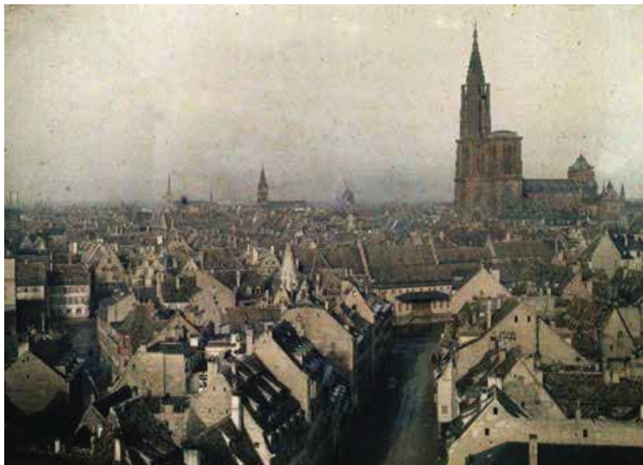
Fig. 1: La cathédrale de Strasbourg dans la ville, autochrome, s. d.

Ces outils pédagogiques s'avèrent de très intéressants témoignages de l'enseignement de l'histoire de l'art dispensé à Strasbourg à partir du début du xx e siècle 11 . D'après le programme annuel des cours 12 , le premier qui fut illustré de projections lumineuses a été donné durant le semestre d'hiver 1902-1903 par Georg Dehio, directeur de l'institut d'histoire de l'art et d'archéologie paléochrétienne (Kunstgeschichte und altchristliche Archäologie Institut) depuis 1893. Le cours, « erläutert durch Lichtbildprojektion » («expliqué au moyen de projection d'images lumineuses»), est alors indiqué comme étant public (öffentlich) et porte sur les monuments allemands du Moyen Âge ( Die deutschen Baudenkmäler des