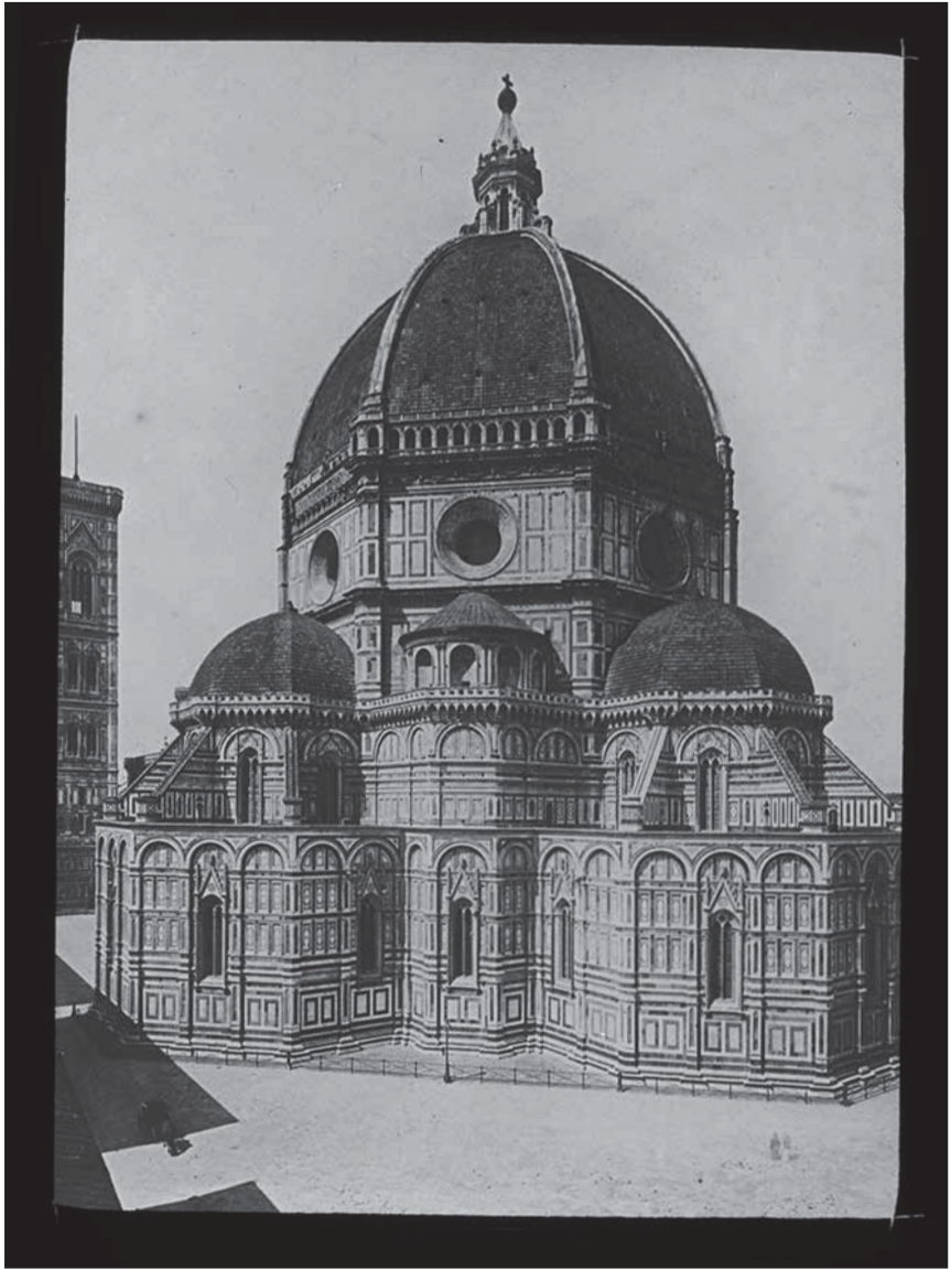
Fig. 2a : Florence, Duomo, plaque de projection, s. d.