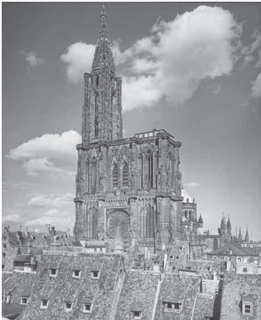
Fig. 4 : La cathédrale de Strasbourg, plaque de projection, s. d.