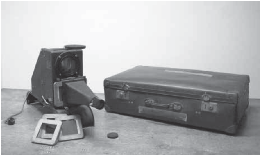
Fig. 3 : Épidiascope, s. d.

de l'art en Toscane à la fin du Moyen Âge et au début de la Renaissance»). Mais la collection de tirages photographiques montés sur carton, dont les enseignants se servaient avant la généralisation de la plaque de projection, est également très pauvre sur le sujet: elle ne compte que trois vues extérieures de l'ensemble de la cathédrale. Il est donc fort probable que l'enseignant ait utilisé pour son cours, grâce à un épidiastroscope [Fig. 3] qui permettait également la projection d'images sur fond non transparent, des dessins publiés en planches ou dans des ouvrages. À moins qu'il ne les ait montrés directement à son auditoire, comme cela est attesté ailleurs 18 et comme le recommandait Georges Perrot en 1899, l'obligeant alors à jongler avec l'éclairage de la salle :