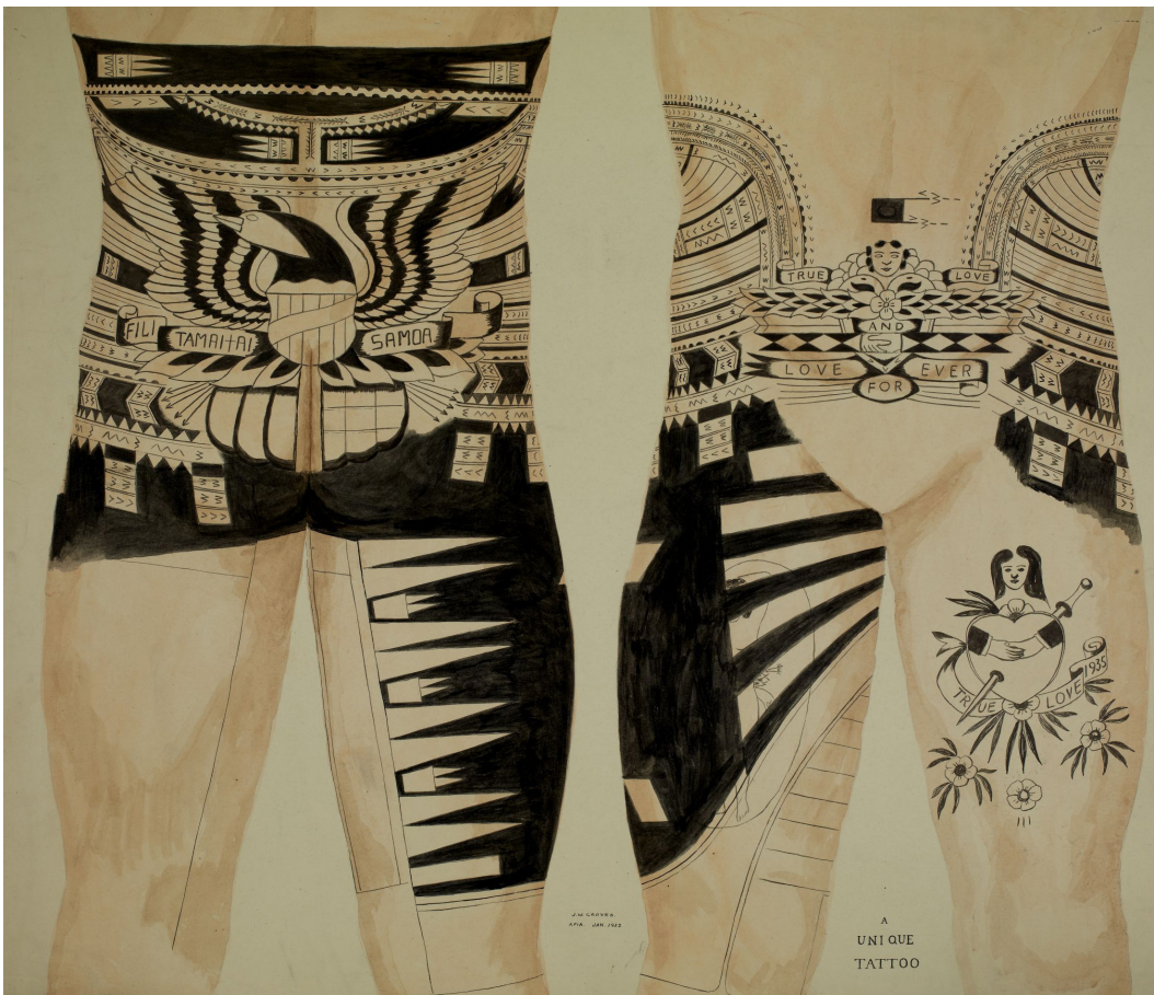
Fig. 3 : Reproduction d'un tatouage par J. Groves

sous la forme d'un mandat par la Société des nations, administrées par le dominion de Nouvelle-Zélande jusqu'en 1962. De janvier 1942 à février 1944, la présence d'étrangers sur le territoire samoan s'intensifia. Cette période représente une phase significative de l'histoire des transferts culturels relatifs au tatouage. En effet, pendant la guerre du Pacifique, jusqu'à 14 000 soldats américains ont pu être stationnés à Tutuila et à Upolu. Cette présence militaire a également offert aux Samoans de nouvelles opportunités économiques en fournissant un travail salarié à des centaines de personnes. De façon tout à fait remarquable, cette situation exceptionnelle semble avoir eu un impact sur la pratique du tatouage à Samoa puisque peu après la fin de la guerre, le tatouage traditionnel s'était manifestement mais temporairement enrichi d'images tirées de l'iconographie du tatouage américain, laquelle puise dans l'imagerie professionnelle, religieuse, romantique, patriotique et commémorative, en l'occurrence ici des aigles, des dagues, des motifs floraux, etc. (fig. 3). Parmi la collection des cinquante-six reproductions de