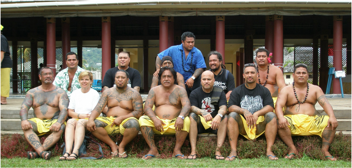
Fig. 4 : Tatoueurs présent à la cinquième convention internationale de tatouage à Apia, Samoa, 2012

de la colonisation et de l'évangélisation du Pacifique, avant d'être enfin valorisé par l'industrie mondialisée du tatouage pour son authenticité et sa permanence. Nous avons également voulu montrer dans quelle mesure ce sont les maîtres tatoueurs samoan eux-mêmes qui, de par leur statut et leur autorité incontestée en matière de tatouage rituel, ont été des acteurs clés des mutations qu'a connues la pratique, en prenant part aux grandes conventions internationales, en introduisant progressivement des changements techniques, en prenant des étrangers pour apprentis, etc. et finalement en organisant par eux-mêmes (et pour eux-mêmes?) la patrimonialisation du tatouage rituel 43 .