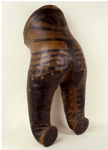
Fig. 2 : Peau tannée de Atofau

tatoués était une pratique répandue au tournant du XIX e siècle mais elle représente le premier et l'unique cas de tatouage samoan intégrant des collections muséales.