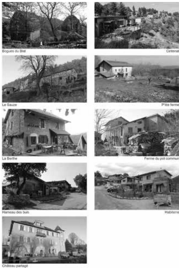
Fig. 1 Fotografias das nove projetos de habitação colaborativa em território rural.