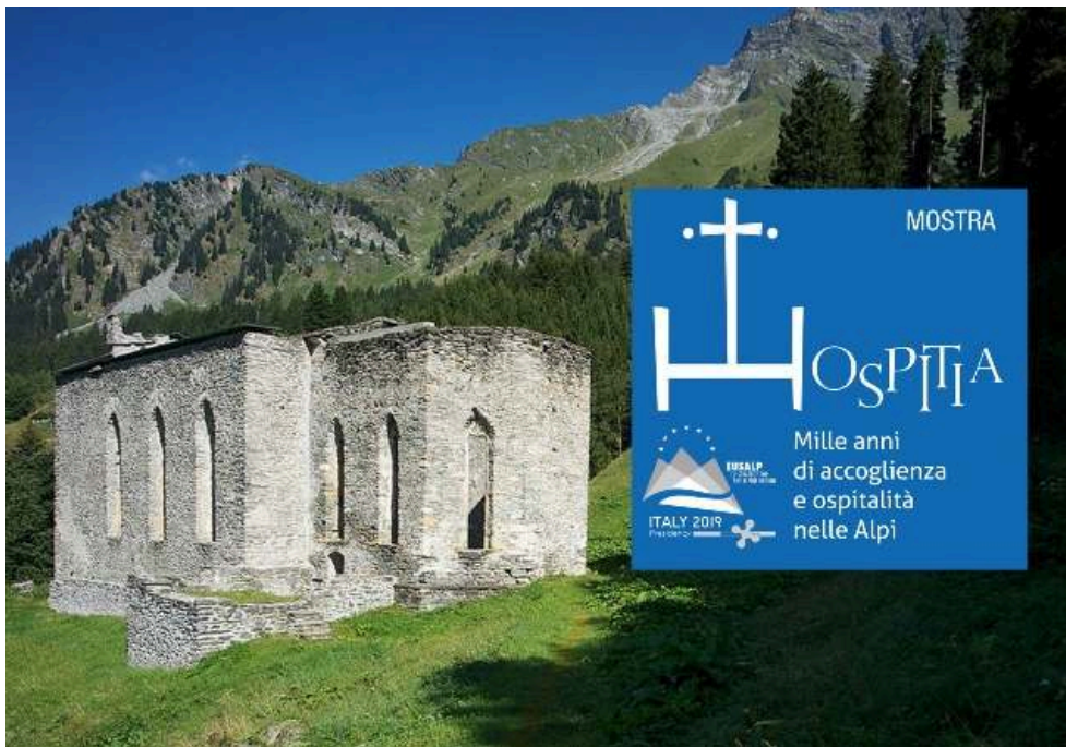
Poster della mostra Hospitia. Mille anni di accoglienza e ospitalità nelle Alpi (Milano, novembre 2019)