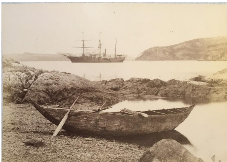
Misión Científica del Cabo de Hornos, 1882-1883. Pirogue remolcado en la playa frente a La Romanche anclado en Bahía Orange.