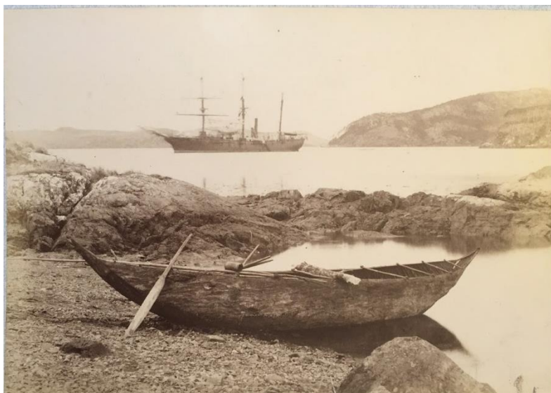
Misión Científica del Cabo de Hornos, 1882-1883. Pirogue remolcado en la playa frente a La Romanche anclado en Bahía Orange.