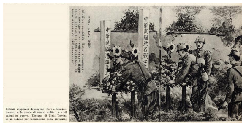
Soldati nipponici depongono fiori e bruciano incenso sulle tombe di nemici militari e civili caduti in guerra. (Disegno di Taki Tomita, in un volume per l'educazione della gioventù).