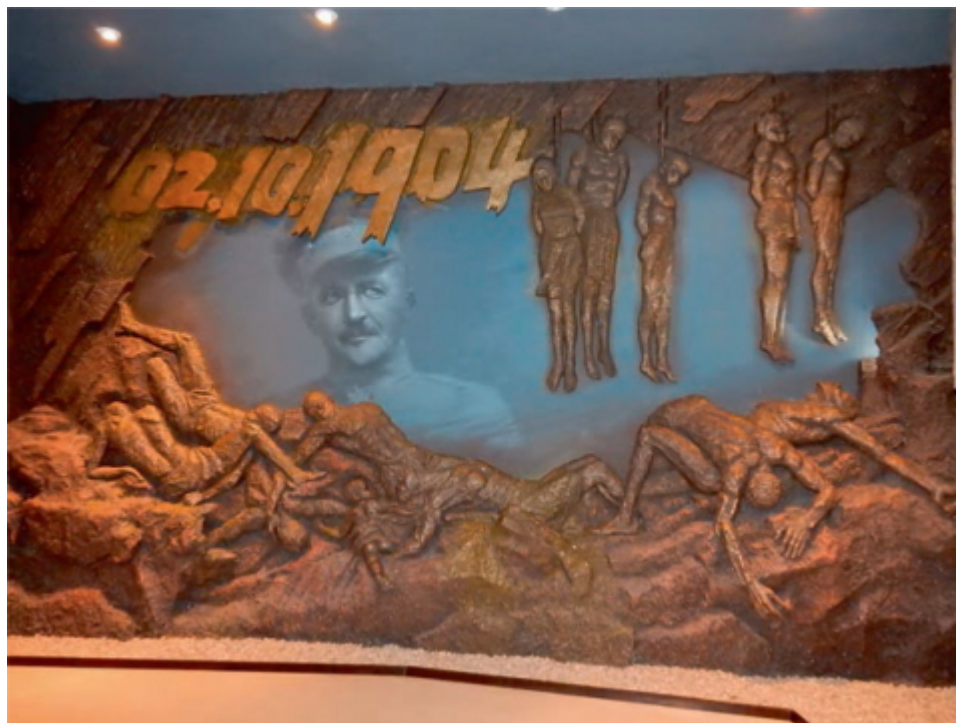
Figure 2 : Vue de la muséographie intérieure de l' Independance Memorial Museum , espace commémorant la guerre de 1904-1907.