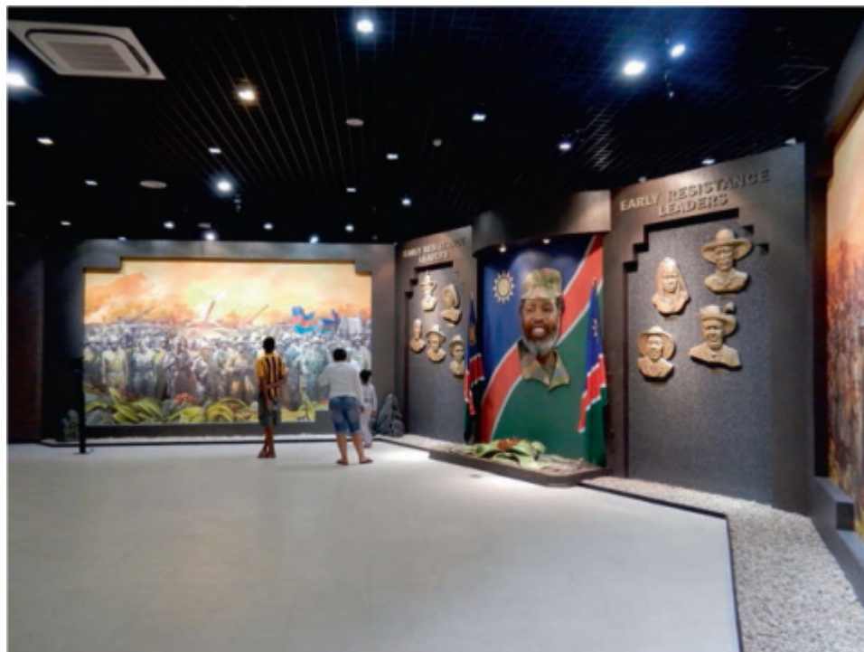
Figure 1 : Vue de la muséographie intérieure de l' Independance Memorial Museum , avec en fond une toile représentant l'armée de libération, sur le mur de droite, un portrait de Sam Nujoma entouré de bas-reliefs représentant les portraits des premiers résistants.