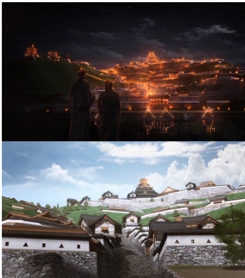
Fig. 6 : Images issues de la vidéo de restitution virtuelle du château d'Azuchi, 2014