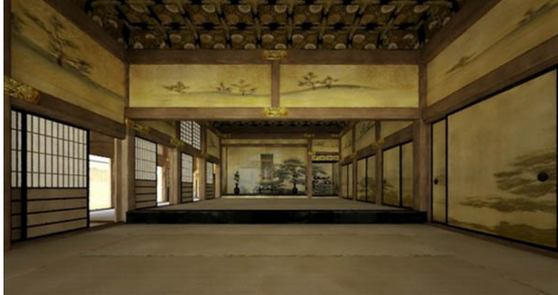
Fig. 10 : Projet Edo VR, vue intérieure du château d'Edo. © Avatra Inc.

expérimenter cette technologie, mais elle permet à l'utilisateur une sorte de voyage spatial et temporel, avec une disparition totale de l'interface. Le succès du projet Edo VR (Avatra), illustre l'intérêt du grand public à la fois pour la restitution mais aussi pour l'usage des technologies permettant d'expérimenter l'espace différemment. Comme expliqué par ses concepteurs, ce projet, à destination des écoles et des musées, vise à éduquer la population sur l'histoire de la ville de Tōkyō, et de lutter contre les idées reçues véhiculées parfois par le cinéma.