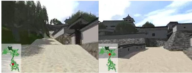
Fig. 8 : Projet de restitution virtuelle du château de Takatori, 2007

La narration se situe également dans la promenade architecturale proposée par la caméra, qui passe d'une navigation à hauteur d'homme ( walk through ) à une vue aérienne, permettant ainsi une compréhension globale du site. L'espace castral a en effet la particularité d'être composé de plusieurs enceintes, accessibles par de longs chemins bordés de hauts murs maçonnés. Cette caractéristique spatiale est souvent valorisée dans les projets de restitutions mais c'est le format vidéo qui permet le mieux de la mettre en valeur. Les images fixes présentent davantage le site dans sa globalité que les parcours qu'il contient. Dans le projet de restitution de Takatori par exemple, la promenade visuelle est accompagnée d'une carte du site qui permet au spectateur de suivre le chemin qu'il emprunte, facilitant ainsi grandement la compréhension spatiale du site.