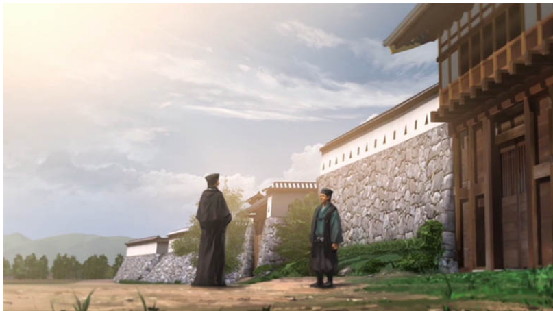
Fig. 7 : Arrivée de Luís Fróis à Azuchi, face au domestique qu'il suit pendant la visite, 2014

Dans le projet du château d'Azuchi (sous forme de vidéo), la restitution spatiale vient même servir de décor à la mise en scène d'un événement historique : la venue de Luís Fróis, missionnaire jésuite portugais proche d'Oda Nobunaga. Accompagné d'une piste son, le spectateur découvre le site, son histoire et son lien avec Nobunaga. La visite commence par une vision aérienne où l'on suit un corbeau qui survole la colline sur laquelle est érigé le château, avec la ville à ses pieds. L'oiseau nous emmène aux portes du château, au moment même de l'arrivée de Fróis à Azuchi. Le spectateur découvre ensuite le château à travers ses yeux, ceux d'un étranger dépaysé et émerveillé par ce pays et cette culture. Il suit son parcours et entend ses commentaires, ses exclamations sur la beauté du lieu et en apprend sur l'utilisation du château par les questions que Fróis pose au domestique. Cette mise en scène, exacerbée par le chant puissant des cigales et la lumière écrasante du soleil d'été, plonge le spectateur dans le Japon médiéval, à l'apogée de la puissance militaire de l'un des plus grands seigneurs de guerre que le pays ait connu.