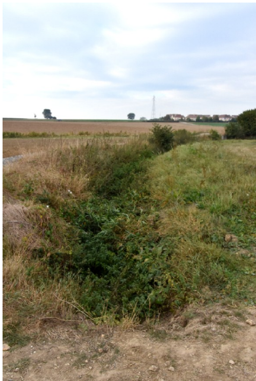
Figure 1. Ru (non nommé), affluent de la Biberonne à Moussy-le-Neuf (Seine-et-Marne, 2017)

Cours d'eau ou fossé de drainage ? Au centre de l'image, presque invisible et dissimulé par la végétation, le ru ne représente qu'un mince filet d'eau à cet endroit. Il résulte des écoulements en tête de bassin versant situés sur des terrains agricoles remis en cause par la nouvelle cartographie. Il était toujours considéré comme un cours d'eau en 2017 : la bande enherbée à droite de l'image est respectée par l'exploitant agricole et fait office de zone tampon avec le champ.