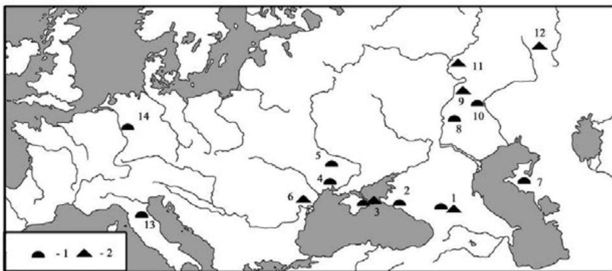
Рис. 1. Находки из Галайты (А - по Амброз, 1989. Рис. 38, 8-22) и карта (Б) распространения металлических седельных накладок типов Засецкая-Ахмедов 4 и Засецкая 16 – Ахмедов 5 в Восточной Европе (1- тип Засецкая-Ахмедов 4; 2 - тип Засецкая 16 – Ахмедов 5): 1: Галайты; 2: Дюрсо; 3: Керчь; 4: Ольвия; 5: Бабичи; 6: Ялпуг; 7: Алтынказган; 8: Покровск; 9: Владимирское; 10: Шипово; 11: Коминтерн II; 12: Солончанка I; 13: Равенна; 14: Крефельд-Геллеп