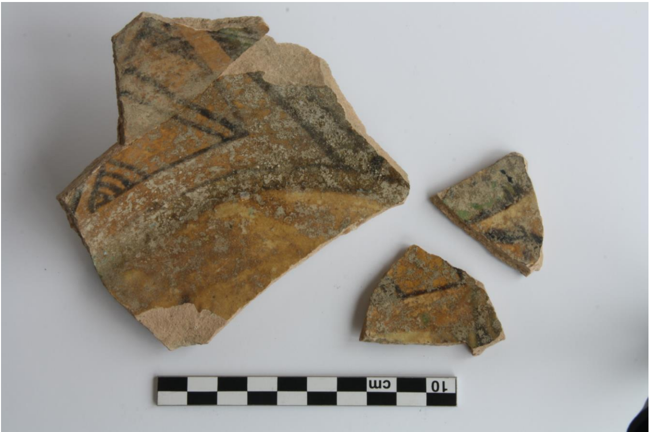
Fig. 2 : fond de plat avec décor au blason, XIII e -XIV e siècle