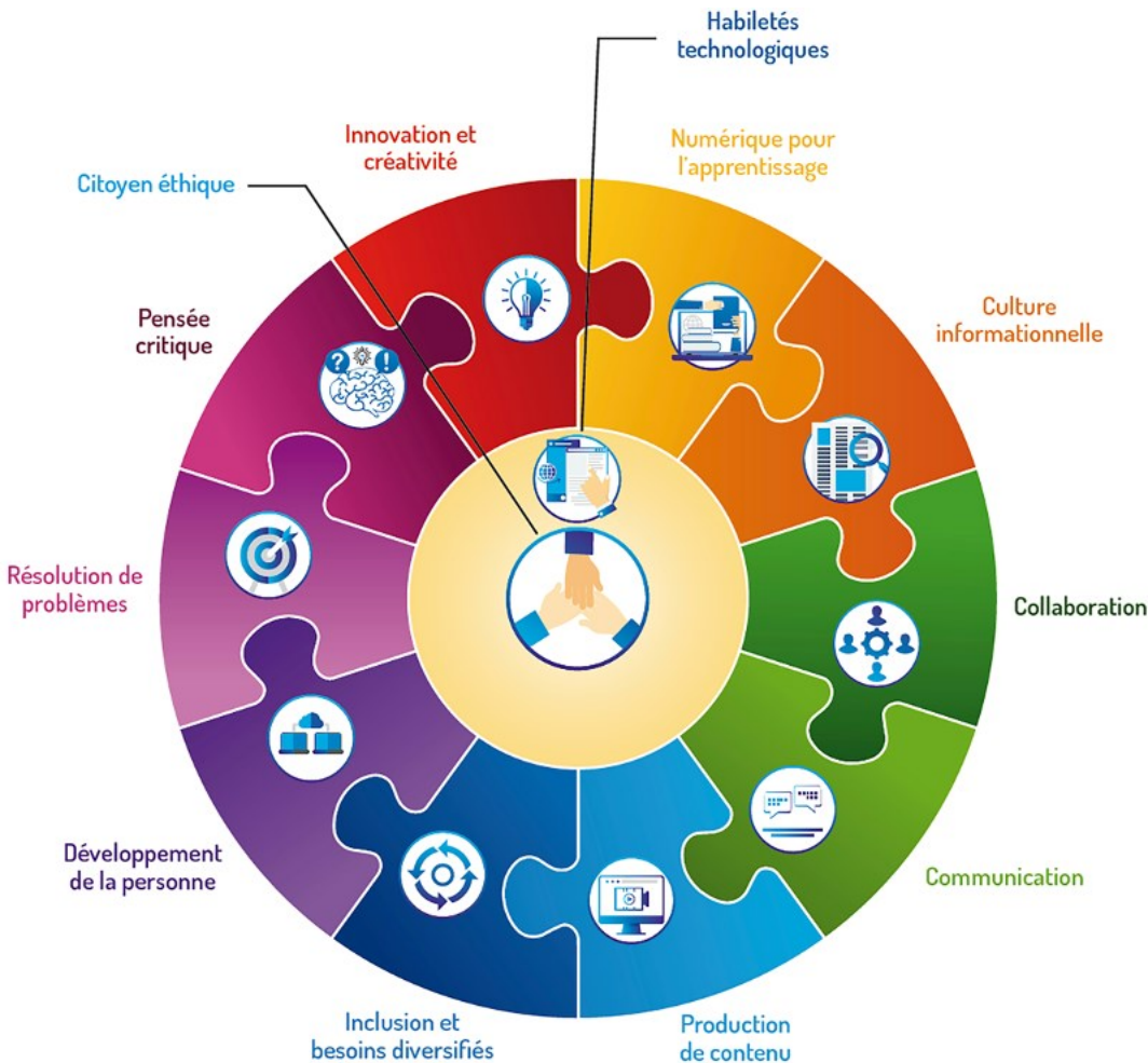
Figure 1 Représentation graphique du Cadre de référence de la compétence numérique

Le Cadre de référence de la compétence numérique a été alimenté par une analyse systématique de plus de 70 référentiels de compétences informationnelles et numériques du 21 e siècle provenant du monde entier. Tout en tirant parti de la richesse des travaux existants, il s'appuie sur une étude des tendances émergentes du numérique en éducation. Par rapport aux documents publiés à l'international, ce projet innove par sa compréhension globale de la compétence numérique. De plus, le choix de concevoir une seule compétence numérique facilite son intégration dans tout autre référentiel ou document se rapportant à l'enseignement et à l'apprentissage. Sur cette base, le Cadre se décline en 12 dimensions phares avec, comme dimensions centrales, Agir en citoyen éthique à l'ère du numérique et Développer et mobiliser ses habiletés technologiques autour desquelles s'articulent les autres dimensions (Figure 1).