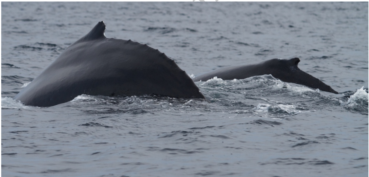
Figure 1 : Baleines à bosse photographiées à Saint-Pierre-et-Miquelon par Joël Détcheverry (membre de l'association FNE SPM). Dans les deux cas, un adulte, très probablement la mère, accompagne un baleineau. Les eaux de Saint-Pierre-et-Miquelon constituent une zone d'alimentation importante de l'espèce. Cette proximité adulte - jeune permet certainement un apprentissage intergénérationnel, qui peut se refléter ensuite dans l'existence de groupes génétiques comme nous l'avons montré en mer de Béring.