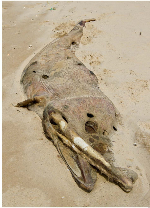
Figure 3 : Le spécimen "MauBs3", retrouvé en novembre 2013 en Mauritanie par Wim Mullié dans le cadre du programme "Biodiversité Gaz Pétrole" et identifié par la suite par code-barre ADN comme appartenant à l'espèce Balaenoptera omurai .