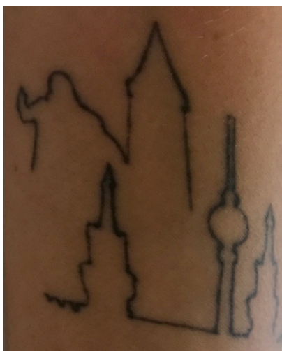
Figure 2 - Tatouage d'une ancienne étudiante Erasmus à Nancy : Fernsehturm berlinoise (partie inférieure), statue de Stanislas et tour de la Commanderie (en haut à gauche) – Avec l'accord de la propriétaire

d'accueil avec des élus et représentants des institutions, de visites gratuites de musées et de lieux culturels nancéiens et de temps de convivialité. Certains participants ont d'ailleurs témoigné de beaucoup d'émotion et de plaisir de retrouver Nancy. Une des participantes a en outre pu montrer aux participants le tatouage réalisé sur son avant-bras, comportant la Fernsehturm de Berlin à laquelle se juxtaposent deux objets emblématiques du patrimoine nancéien : la statue de Stanislas (située sur la place du même nom) et la silhouette de la « Tour de la Commanderie ».