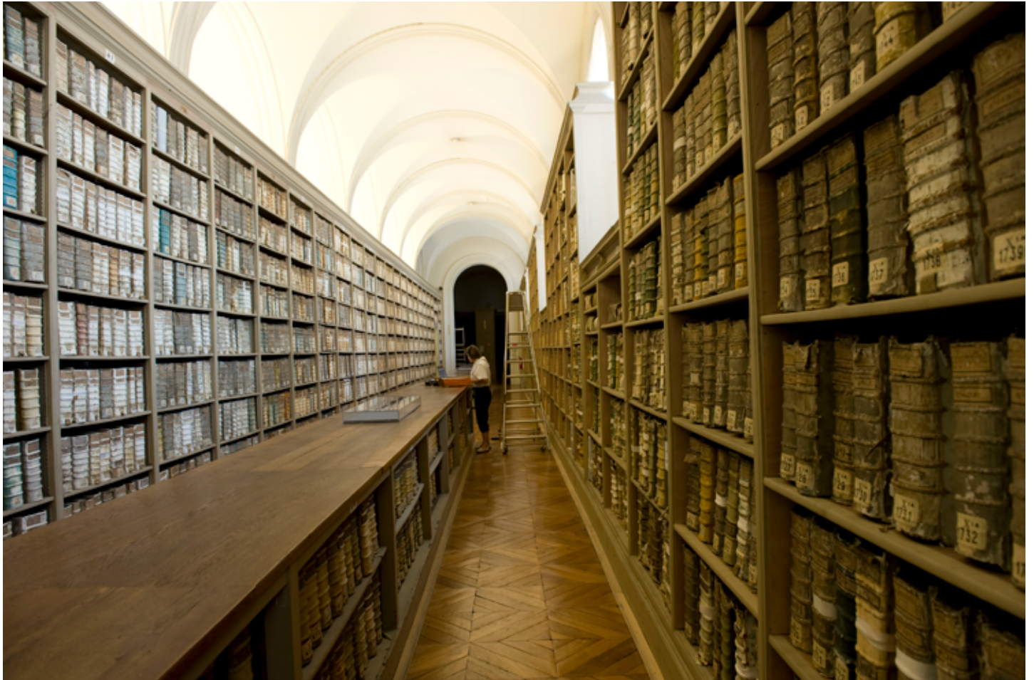
Fig. 1. Les registres de la célèbre galerie du Parlement des Archives nationales, illustrant la masse de documents préservés par l'institution.

conceptualisée par Aloïs Riegl 5 – est particulièrement prégnante dans le monde du patrimoine écrit, autant en termes de traces d'une utilisation passée que dans leur ontologie actuelle. À l'exception de certains ouvrages considérés comme presque intouchables et devenant ainsi des objets de musée 6 , les livres ont été lus et sont toujours lus. Les conservateurs-restaurateurs intervenant sur des livres reliés doivent donc composer avec une double valeur d'usage : ils doivent identifier et documenter les traces des différents emplois du document dans le passé, et intervenir en vue de son utilisation présente et future. La fonction de communication, intimement liée à la valeur d'usage et inhérente à l'existence des bibliothèques publiques et des archives, revêt une telle importance que le terme « restauration » est rarement approprié dans le cas des documents écrits. Les interventions les concernant relèvent presque exclusivement de la conservation (préventive et curative), voire de la réparation ou de la rénovation 7 ; et de la numérisation. L'usage peut parfois