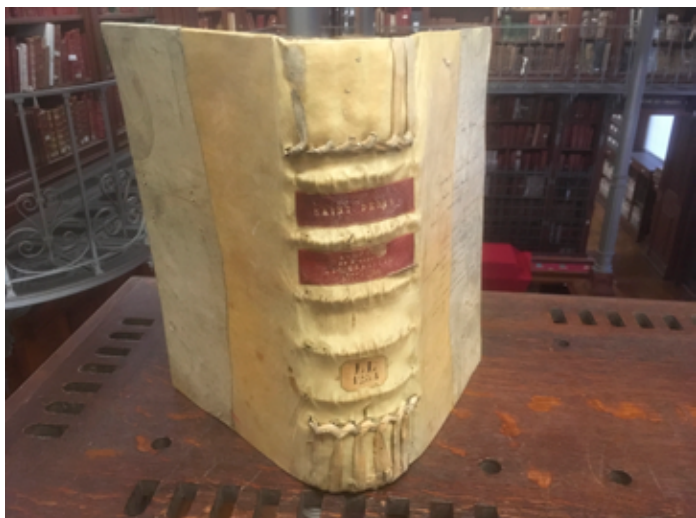
Fig. 6. Comptes de l'office des charités (1577-1586), Arch. nat. LL//1284, Abbaye de Saint-Denis.