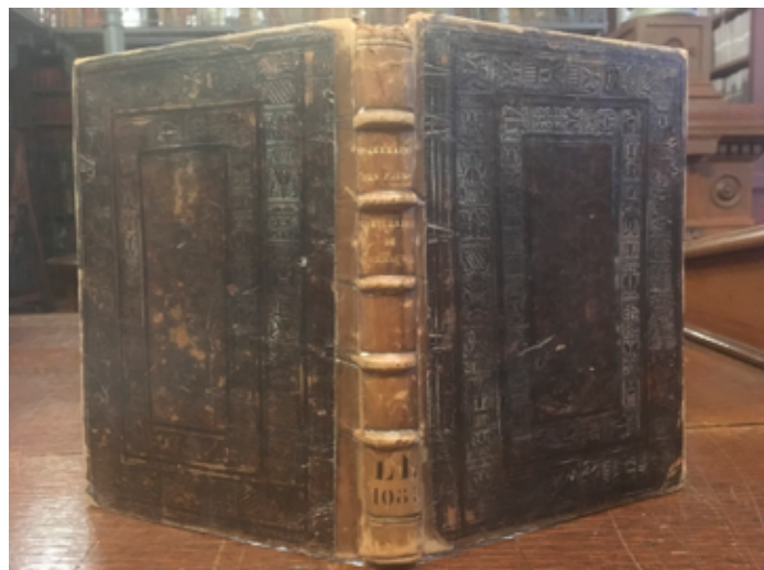
Fig. 7. Cartulaire de Montchauvet (XVI e siècle), Arch. nat. LL//1081, Abbaye de Saint-Germain-des-Prés.

autre. Cette abbaye a montré très tôt une volonté de classement et d'organisation de ses archives, et un soin particulier pour leur matérialité. Plusieurs de ces documents ont été envoyés à l'atelier de reliure avec pour instruction « à réparer ». L'analyse de l'un de ces objets montre trois caractéristiques : premièrement, les archives de l'abbaye ont effectivement été traitées avec beaucoup de soin au XVI e siècle puisqu'elles ont reçu une reliure estampée à froid, c'est-à-dire une reliure de grande qualité (fig. 7). Deuxièmement, cette reliure a été relativement bien conservée entre le XVI e et le XIX e siècle ; et troisièmement, on a souhaité la préserver au maximum dans les années 1860, puisque seul le dos a reçu une nouvelle pièce de cuir. Le texte – l'œuvre – n'est donc pas le seul objet de l'attention de nos prédécesseurs.