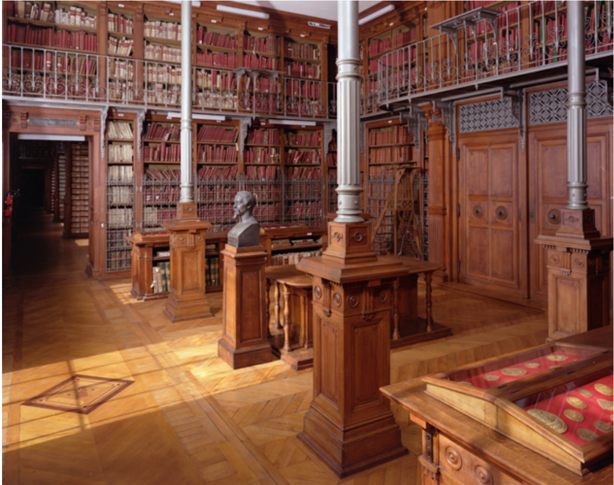
Fig. 4. La salle de l'armoire de fer du dépôt Napoléon.

alors que la première salle de lecture est ouverte au public au début des années 1840.