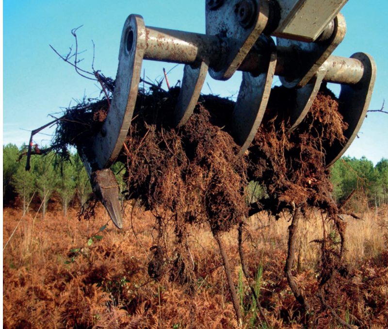
Arrachage de rhizomes de fougère au scarificateur réversible® Becker monté sur mini pelle.

La fougère aigle développe un « double » système racinaire continu et interconnecté. L'un se trouve plus en surface et l'autre plus en profondeur. Cette importante quantité de rhizomes répond facilement à la demande de la partie aérienne par ses réserves importantes. Selon les stations, la densité et l'épaisseur du réseau de rhizomes peut approcher les 90 % d'occupation des 30 premiers cm du sol.