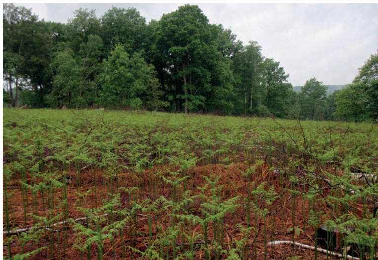
Les anciennes fougères sèches marron et les nouvelles verte sous forme de crosse.

La dynamique de la fougère et sa capacité de réaction aux outils sont maintenant connues. La seule solution durable, efficace et permettant d'endiguer sa concurrence, reste la prévention. Pour réussir à moindres frais un projet de régénération de peuplement (naturel ou plantation) il est indispensable de commencer par maîtriser avant tout, la fougère. ■