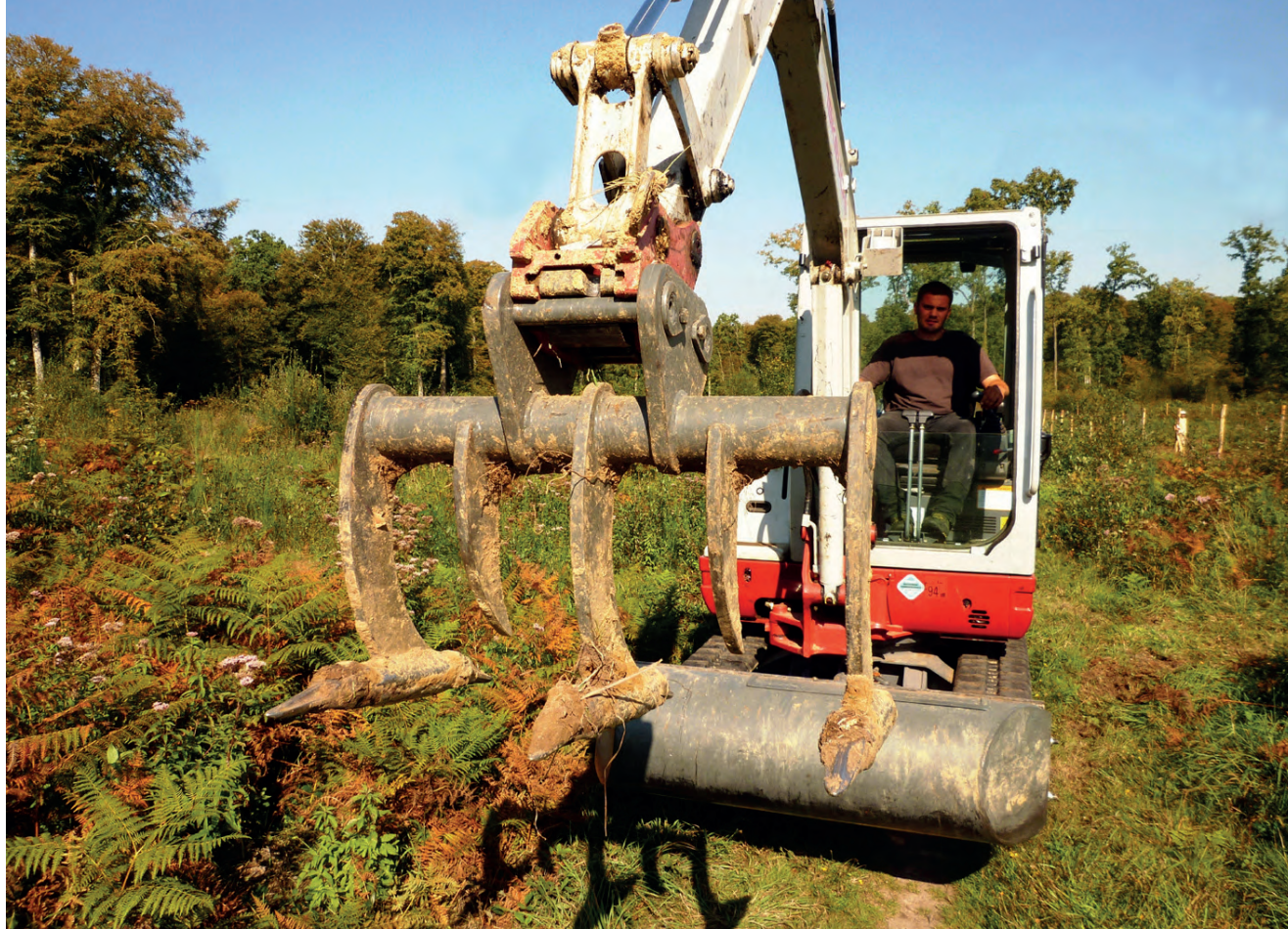
Le Scarificateur réversible® Becker sur minipelle.

pour un dégagement localisé et manuel. En rappel, l'action de couper la fougère aigle ne limite en rien sa dynamique, ce n'est qu'un moment de répit. L'idéal est d'utiliser des outils qui écrasent, ou mieux, brisent la fougère. Le rouleau d'un broyeur à axe horizontal qui ne tourne pas peut suffire pour créer un passage et limiter la repousse. Mais cela reste un outil lourd et peu adapté. Il existe un outil léger, le brise fougère ou le rouleau landais.