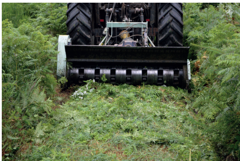
Broyeur à axe horizontal sans rotation roulant au sol.