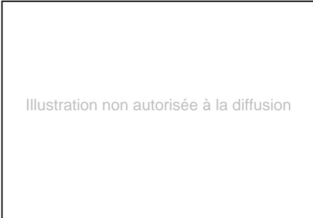
Tableau 5. Évolution des dépenses brutes par famille de produits