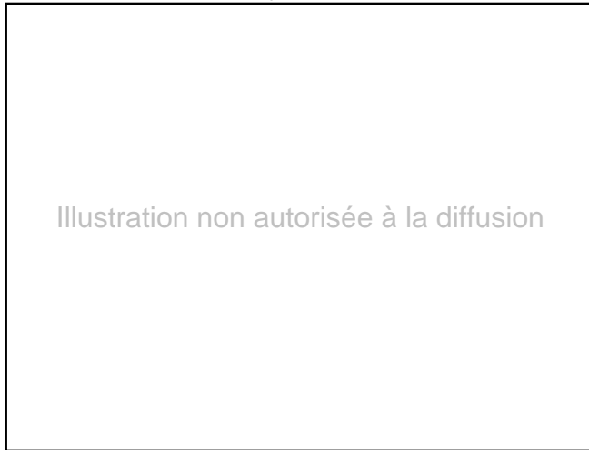
Tableau 6. Évolution des dépenses entre 1991 et 1994