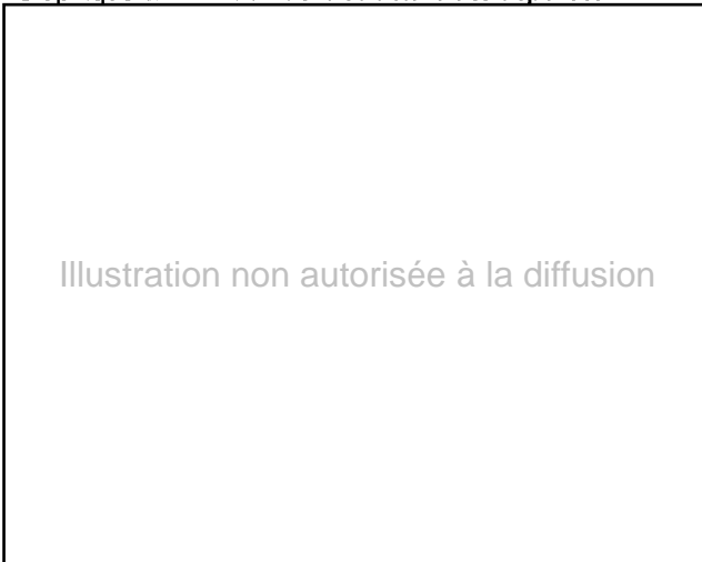
Graphique 2. Évolution de la structure des dépenses