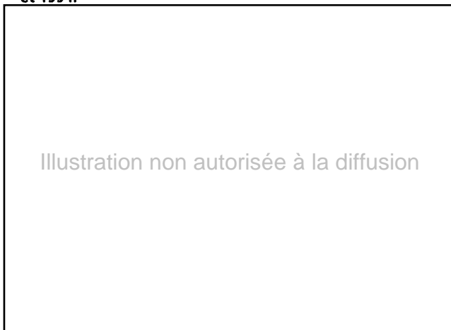
Graphique 3. Évolution des retours par pays entre 1991 et 1994.