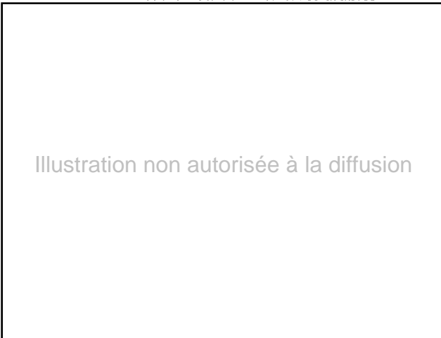
Tableau 7. Les concours nets aux " cultures arables "