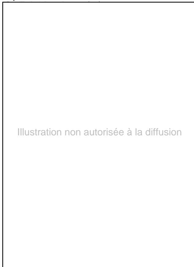
Tableau 2. Évolution des concours publics à l'agriculture depuis la réforme de la Pac

Les aides directes , au sein desquelles prédominent les subventions d'exploitation , représentent 28 % de l'ensemble des concours publics en 1991, et 72 % en 1995 ; leur montant global a été multiplié par trois