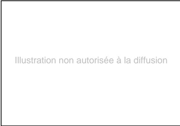
Tableau 5. Évolution des dépenses brutes par famille de produits