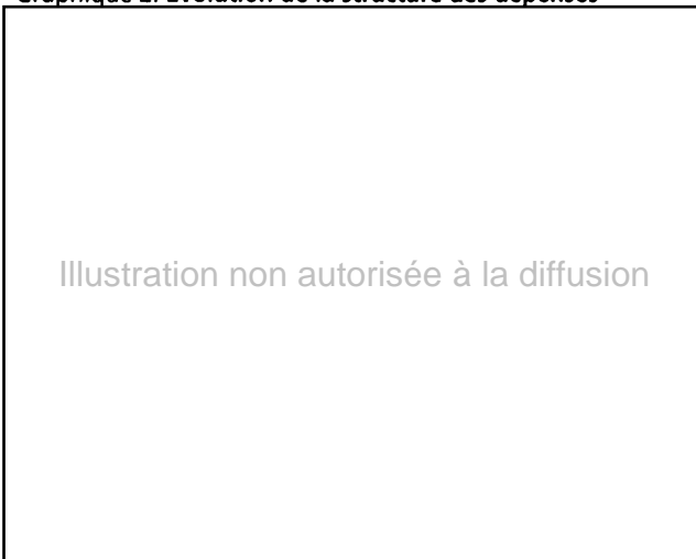
Graphique 2. Évolution de la structure des dépenses