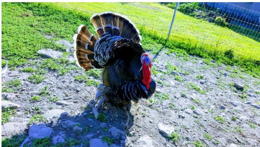
Figure 3 : Le dindon, comme centre d'attraction

Beaucoup de ces enfants ont des chiens ou des chats, et quand ils n'en ont pas, ils sollicitent les voisins : « Ma voisine me prête parfois sa chienne pour que je m'occupe d'elle ». Les voisins vivent d'ailleurs entourés d'animaux que les enfants viennent voir régulièrement.