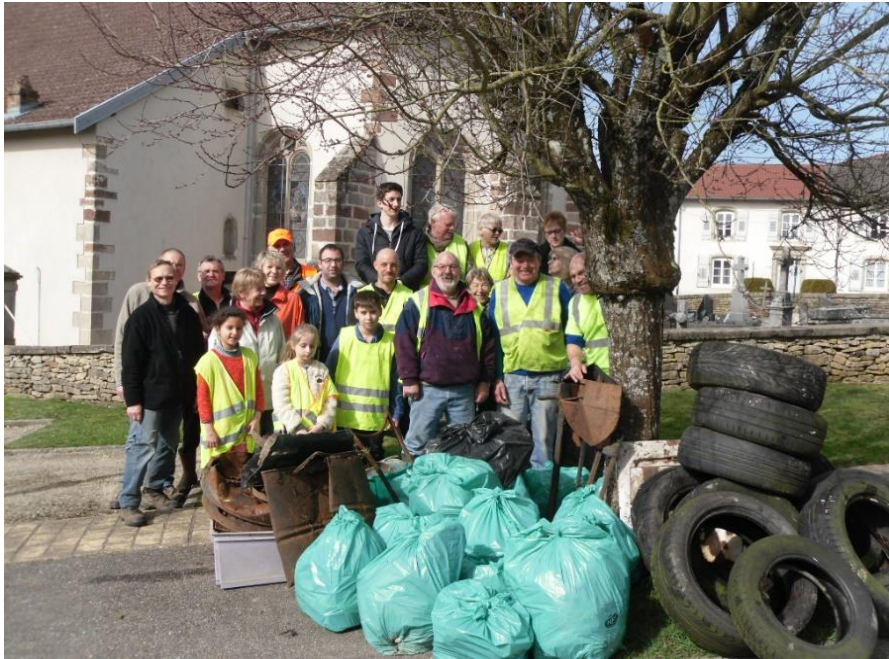
Figure 6 : Ramassage des objets abandonnés dans le périmètre du village

Lorsque nous constatons que les enfants ne sont finalement pas si nombreux dans les activités de l'association, il nous est répondu qu'ils ne sont pas différent des adultes : « Là encore il y a ceux qui viennent presque tout le temps, et ils sont trois ou quatre, il y a ceux qui viennent par intermittence et ceux qui ne viennent jamais ». Lors de ces différentes manifestations, il n'est pas rare de voir les adolescents à proximité, observateurs de ce qui se passe, présents à leur manière, mais présents quand même.