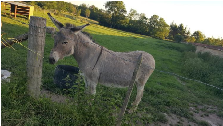
Figure 4 : L'ânesse Cannelle

Cannelle, l'ânesse, autre centre d'attention, est le plus souvent tranquillement installée dans son enclos, avec quelques moutons.