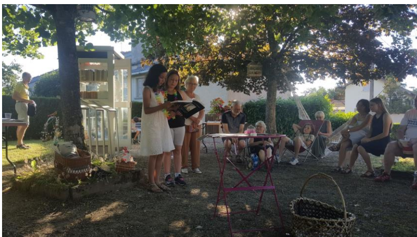
Figure 5 : Les enfants, lors de l'après-midi poésie, organisée par l'association Chèvre-Roche

La culture pour les enfants est une question qui a été posée au sein de l'association : « Il y a deux ans on s'est recentré. On a dit qu'il fallait qu'on fasse des choses qui concernent plus les enfants ».