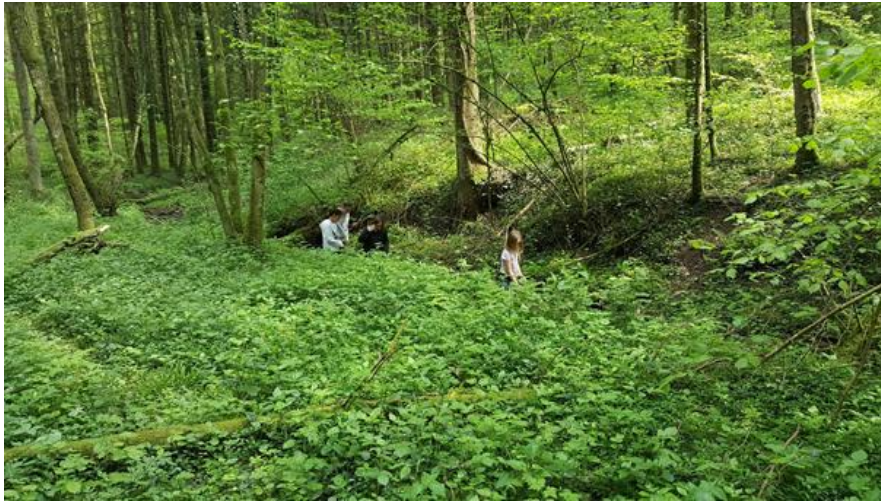
Figure 8 : Les enfants en marche vers la cascade sous la supervision d'un adulte.

Les enfants sont également attirés par tout ce qu'il y a aux alentours et par le chemin qui mène à la cascade.