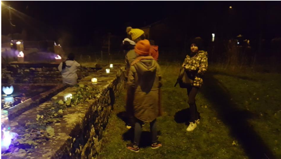
Figure 11 : Enfants près de la fontaine le soir de la soupe contée