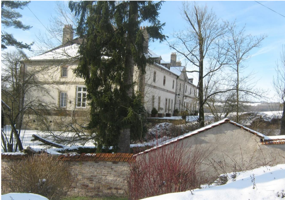
Figure 1 : Château de Thuillères

Son propriétaire, un entrepreneur de la région parisienne, participe régulièrement aux activités du village. Le régisseur du château est par ailleurs président d'une association caritative d'aide à Madagascar. Le château est régulièrement ouvert au public. Les habitants de Thuillères y sont accueillis avec bienveillance. Pourtant, certains d'entre eux n'y sont jamais allés.