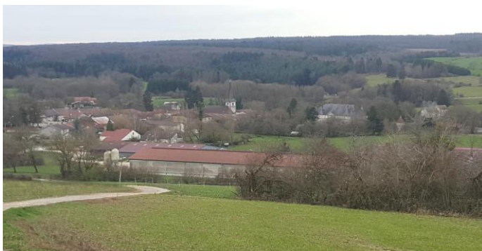
Figure 3 : Le village vu du sentier qui mène aux antennes-relais le surplombant

Lorsque nous observerons le village en prenant un peu de hauteur, nous le ferons à partir de la manière dont les habitants peuvent le voir d'un coteau ou d'une colline et le décrire comme leur lieu d'habitation et de vie.