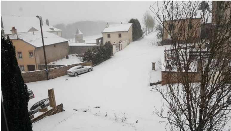
Figure 6 : Y-aura-t-il encore de la neige à Noël ?

Les enfants nous parlent beaucoup de balades ou de promenades lorsqu'on les questionne sur leurs activités : « Moi ce que je préfère c'est être à l'extérieur, on fait du bricolage, du vélo, on va en forêt, on est beaucoup plus libres » ; « J'adore aller observer les animaux, avec les copines on réussit maintenant à imiter le cri du dindon ». Thuillières et ses alentours sont perçus comme un grand terrain de jeu limité géographiquement par les interdictions des parents. L'image du village comme espace sécurisé pour les enfants varie selon les parents. La peur varie également de famille en famille. Plus la peur des parents est prégnante, moins l'enfant peut explorer le territoire, moins il est en relation avec la nature et les autres enfants du village. Cela peut directement jouer sur son attachement à Thuillières. La peur n'est cependant pas seulement le fait des familles venant de l'extérieur. Elle est également genrée, notamment avec la peur de l'enlèvement pour les filles, même chez les parents des « enfants du village ».