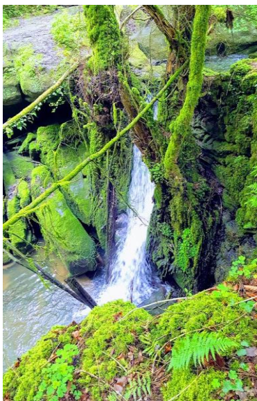
Figure 7 : La cascade dans le bois

La cascade est située au cœur d'un bois : « J'aime Thuillières parce qu'ici il y a la cascade ». Elle est alimentée par une petite rivière qui passe tout à côté de l'ancien ermitage de Chèvre-Roche. La cascade se situe environ à 15 minutes de marche du village. Il est possible d'y accéder à vélo mais les conditions d'accès sont parfois difficiles, surtout lorsque les sentiers sont détrempés. Les garçons peuvent y aller seuls. Les filles n'y vont jamais sans un adulte.