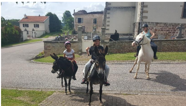
Figure 5 : les enfants chevauchant Bourriquet et Nénette

Elle est montée par les enfants lorsqu'ils sont accompagnés d'une voisine. Mais le plus souvent celle-ci sollicite ses propres animaux, Bourriquet et Nénette.