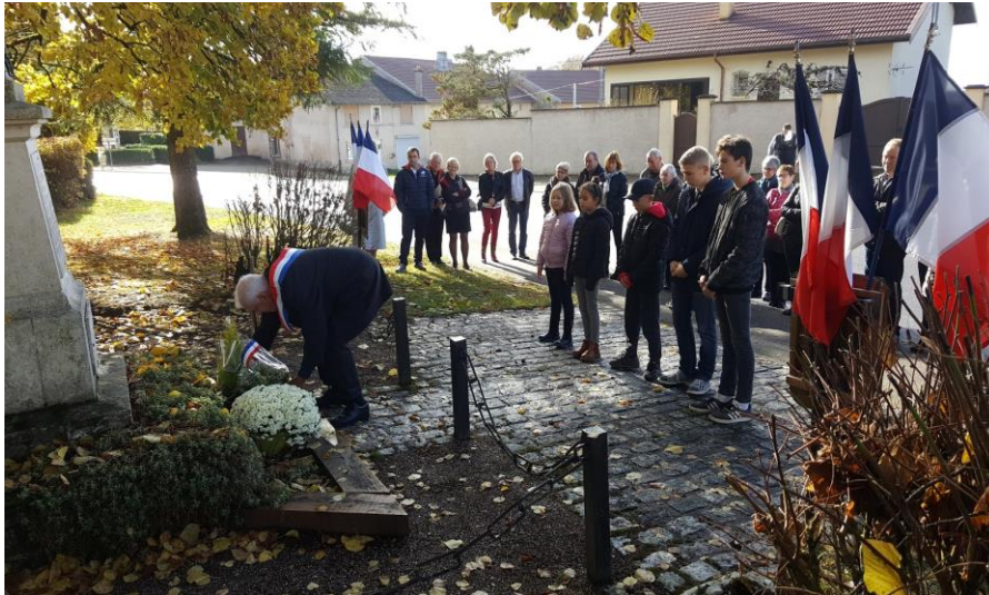
Figure 7 : dépôt de gerbe du 11 novembre par le maire du village, avec des enfants du villages et des habitants

Dans le cadre du village, même si elles sont complémentaires, les activités de la mairie et des associations sont séparées, et c'est sans doute important, aux yeux des membres de l'association : « Même si la mairie subventionne l'association, on doit garder notre indépendance et notre droit de ne pas seulement nous adresser aux habitants du village ».