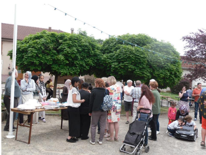
Figure 4 : Fête du village, 2019, avec participation de l'association "Vivre ensemble" de Mirecourt

En 2019, lors de la fête patronale dont le thème est « Traditions d'ici et d'ailleurs », l'association « La vie ensemble » de Mirecourt a été invitée à offrir le thé à la menthe, des pâtisseries et des gourmandises préparées et servies par une trentaine de personnes de sept nationalités différentes : Maroc, Kosovo, Syrie, Turquie, Japon, Serbie et Albanie. Dans le contexte des élections européennes qui ont vu dans le village un mouvement de repli à travers des votes eurosceptiques ou nationalistes, cette visite est hautement symbolique.