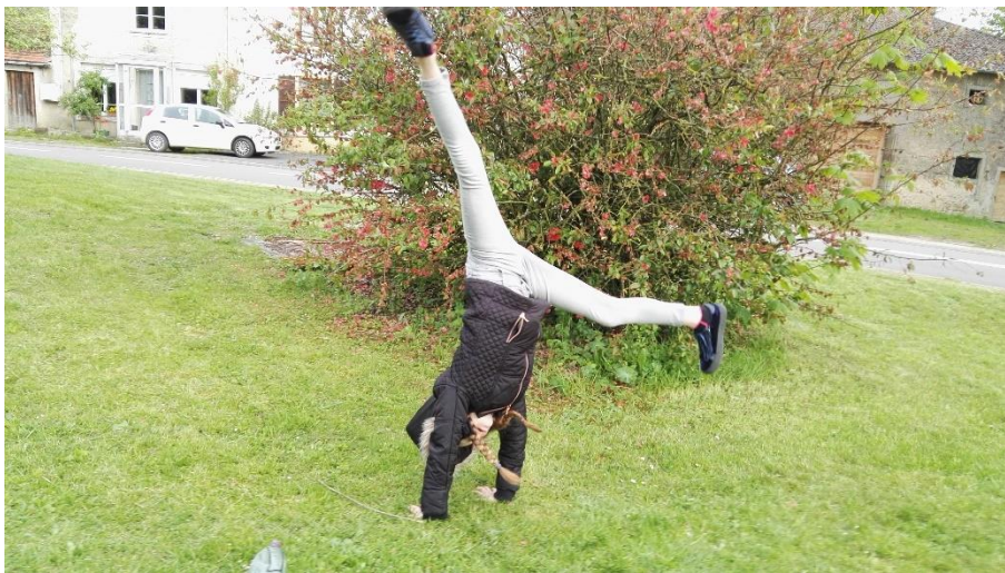
Figure 10 : enfant à l'abord de la fontaine

Les enfants observent parfois les adolescents de loin, de l'arrêt de bus à proximité ou de la maison de l'une d'elle. Les adolescents se sont un temps servis du parapet de la fontaine pour faire des figures acrobatiques, en se projetant en avant ou arrière. Les enfants sont plus raisonnables. Ils se contentent de faire la roue ou des roulades et de passer ce qu'ils appellent du bon temps : « A la fontaine, on discute, on prend des photos et on s'amuse ».