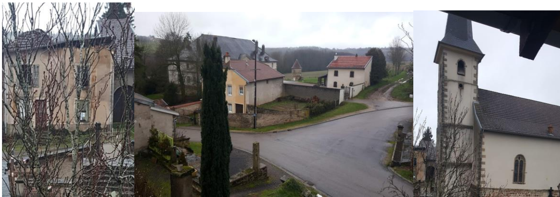
Figure 2 : Vue de la fenêtre, rue de l'église

Même vu de la même fenêtre, le village est par ailleurs contrasté, avec des regards très différents sur les choses de la vie dans le village. Avec des sens qui peuvent paraître contradictoires, sauf à considérer que ces contradictions supposées forment le terreau d'une forme d'existence dans le village. Le village peut apparaître doux et accueillant, dur et fermé, moderne ou archaïque, selon les fenêtres ouvertes et le regard que l'on pose. Ne pas chercher à montrer la complexité du village, si tant est qu'elle est avérée, serait à ce titre une erreur manifeste.