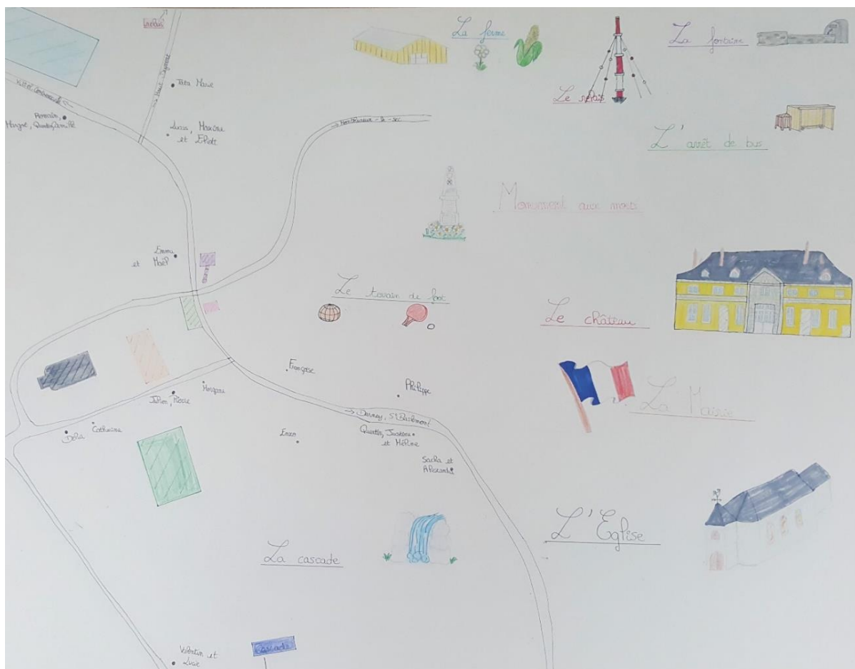
Figure 2 : Représentation du village par une adolescente

Nous rappelons que nous avons défini la mobilité, en termes de potentialités d'actions, comme un chemin et un cheminement dans la tête. En observant les enfants, les adolescents et les jeunes adultes et en analysant leurs conduites et leurs discours, en relations avec les chemins dessinés dans le village et dans les têtes, nous pourrions mieux comprendre quels cheminements deviennent possibles dans la perspective de leurs mobilités futures.