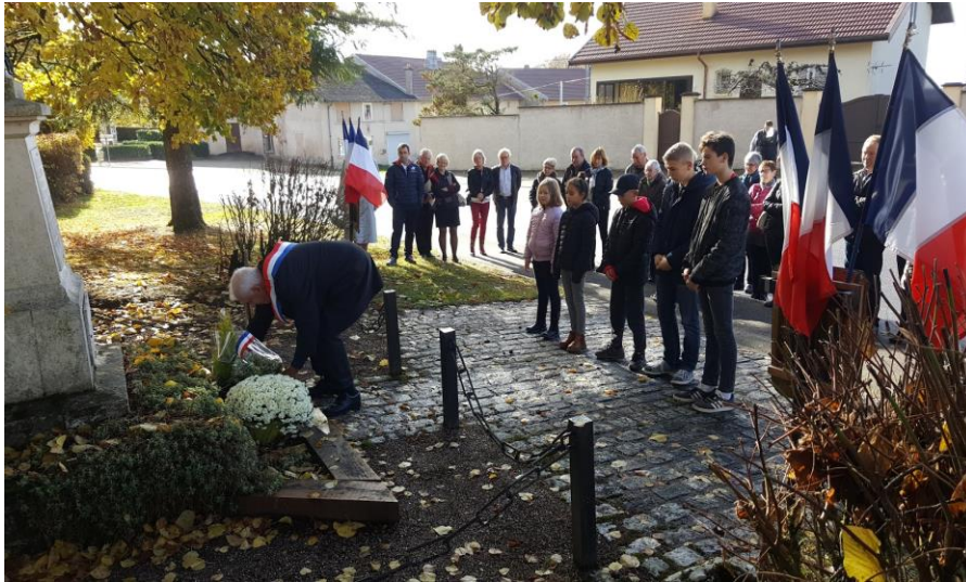
Figure 7 : dépôt de gerbe du 11 novembre par le maire du village, avec des enfants du villages et des habitants

Dans le cadre du village, même si elles sont complémentaires, les activités de la mairie et des associations sont séparées, et c'est sans doute important, aux yeux des membres de l'association : « Même si la mairie subventionne l'association, on doit garder notre indépendance et notre droit de ne pas seulement nous adresser aux habitants du village ».