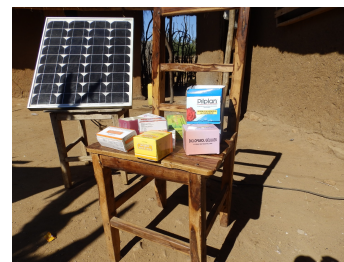
Source : point de vente informel en milieu rural (on y voit notamment le PiiPlan – pilule contraceptive)

Comment, dans ce contexte, favoriser l'accès des femmes et des professionnels aux informations sur les modes d'utilisation adaptés du misoprostol pour réduire les risques ?