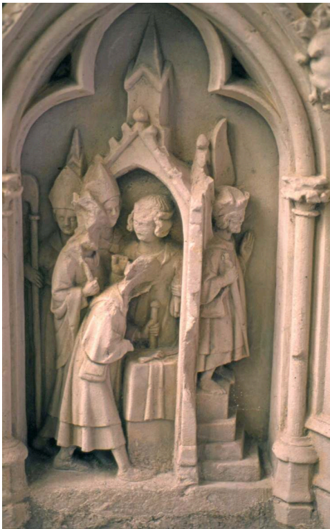
Fig. 4 – Fécamp, abbaye de la Trinité, tombeau de Thomas de Saint-Benoît, détail, début du XIV e siècle