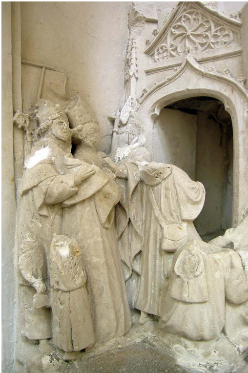
Fig. 3 – Fécamp, abbaye de la Trinité, Pas de l'ange , détail de la scène sculptée, 1420

entrepreneuriale. L'épisode fondateur n'est pas décrit précisément par les commanditaires, qui se contentent d'indiquer le thème de la sculpture – « l'ystore de la dedicasse » –, le nombre de personnages nécessaires – « jusquez au nombre de sept ymagez » –, leur dignité – « Evesquez, archevesquez, duc et pelerin » – ainsi que le cadre dans lequel doit se tenir la scène – « une apparence d'église ». La scène finalement sculptée comporte six figures principales et quatre figures annexes à la place des sept personnages initialement prévus (fig. 3).