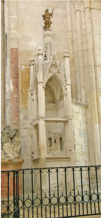
Fig. 2 – Fécamp, abbaye de la Trinité, Pas de l'ange , vue d'ensemble, 1420