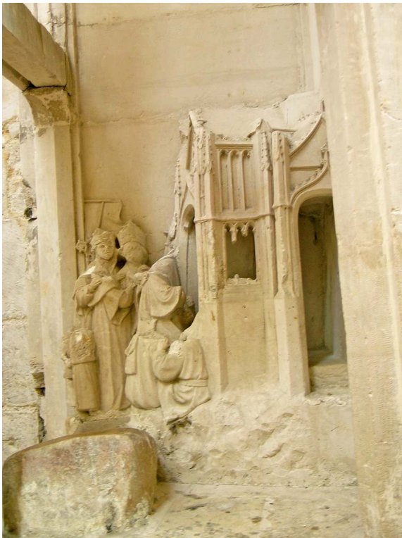
Fig. 5 – Fécamp, abbaye de la Trinité, Pas de l'ange , détail de la scène sculptée en vue latérale, 1420