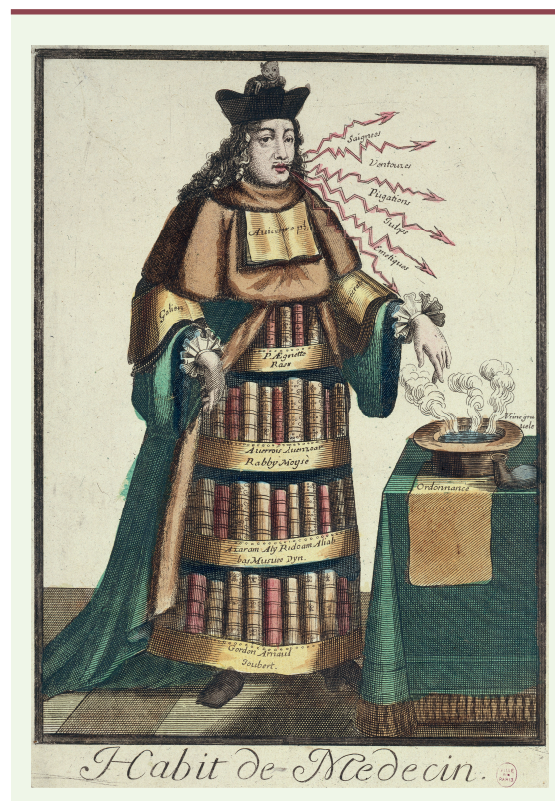
Figure 1. « Habit de Médecin » (vêtement allégorique avec attributs professionnels). Gravure sur cuivre, de Nicolas de Larmessin (1632/38-1694). De la série : « Les Costumes Grotesques : Habits des Métiers et Professions », Paris 1695, fol. 34, © Paris, Bibliothèque Nationale. http://parismuseescollections.paris.fr/fr/musee-carnavalet/oeuvres/habit-de-medecin (© sous licence CC 0).

D'autres outils, comme ArchiveSpark destiné à opérer l'extraction de données pour permettre des opérations de fouille de texte par exemple sont actuellement à l'étude 17 . Conscient que son succès sera proportionnel à leur simplicité d'utilisation, l'enjeu pour la MHL est à présent de développer « a user-friendly web interface ».