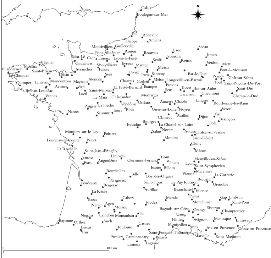
Villes ayant un imprimeur ou libraire (1470-1600)

avec l'imprimeur, et assurait la commercialisation du tirage. Il devint également la figure la plus visible sur le livre lui-même puisque son nom fit l'objet de mentions proéminentes, éclipsant souvent le nom de l'imprimeur, simple exécutant. Ce libraire-éditeur commercial avait bien évidemment une place un peu différente de celui que l'on connaît aujourd'hui, il était le publisher que l'on retrouve dans les analyses du domaine anglais. Cette figure explique une évolution importante dans le marché du livre lors de cette troisième phase : la publication d'éditions par des associations de plusieurs libraires.