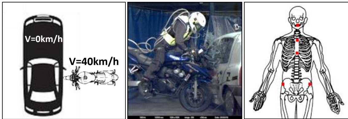
Figure 1: Configuration de l'impact d'un essai crash-test et positions des capteurs accélérométriques sur le sujet