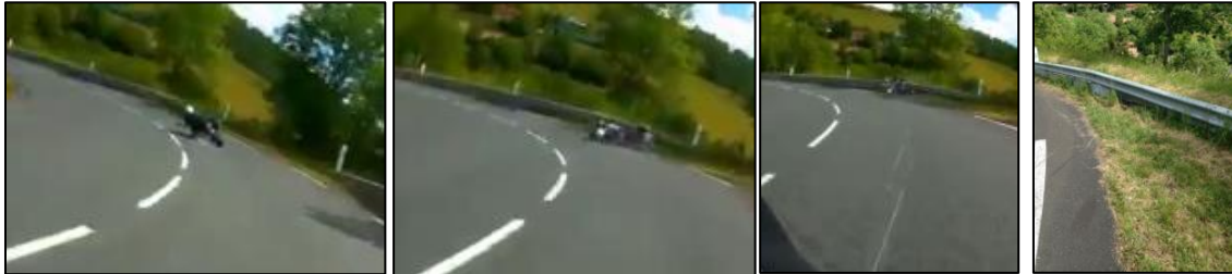
Figure 3 : Cas d'accident n°2, photos de l'accident, déformations de la glissière

La reconstitution cinématique de l'accident à partir des informations recueillis a permis de fournir les éléments suivants :