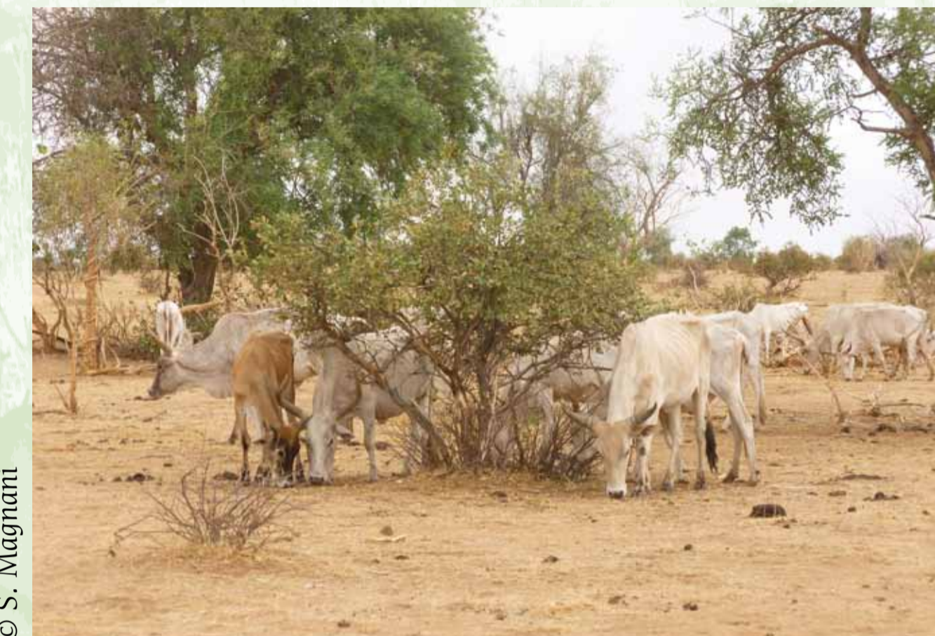
Vaches en pâture, saison sèche 2013