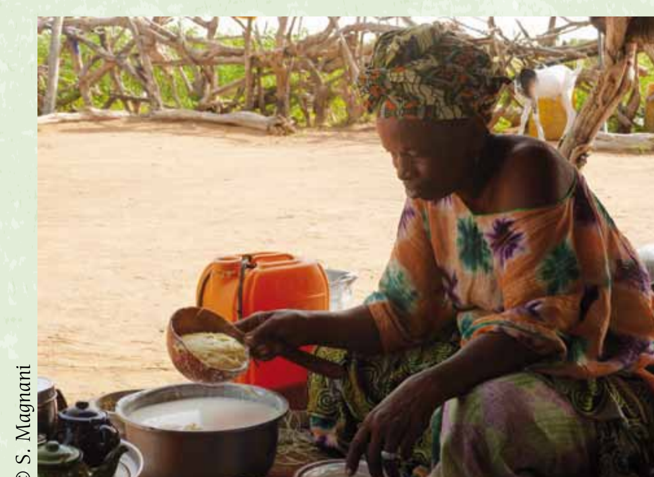
Fabrication de beurre pour la famille