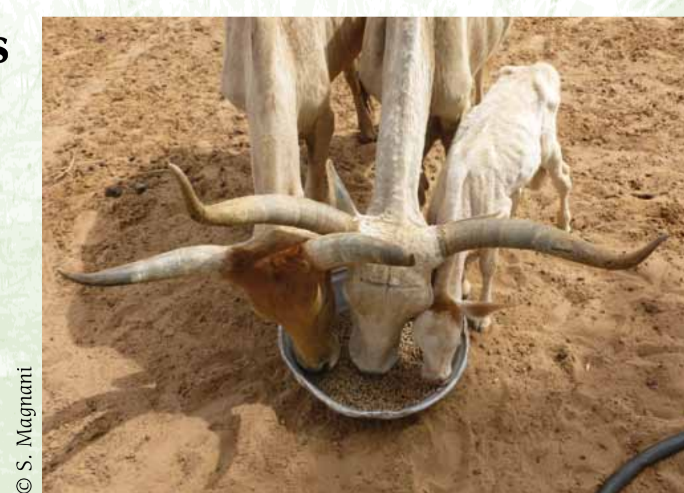
Usage de concentrés, saison sèche 2012