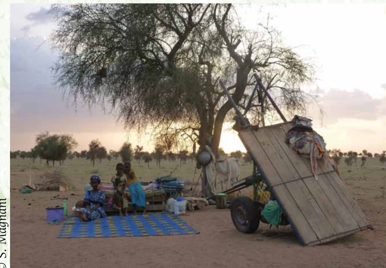
Famille en transhumance, saison sèche 2013