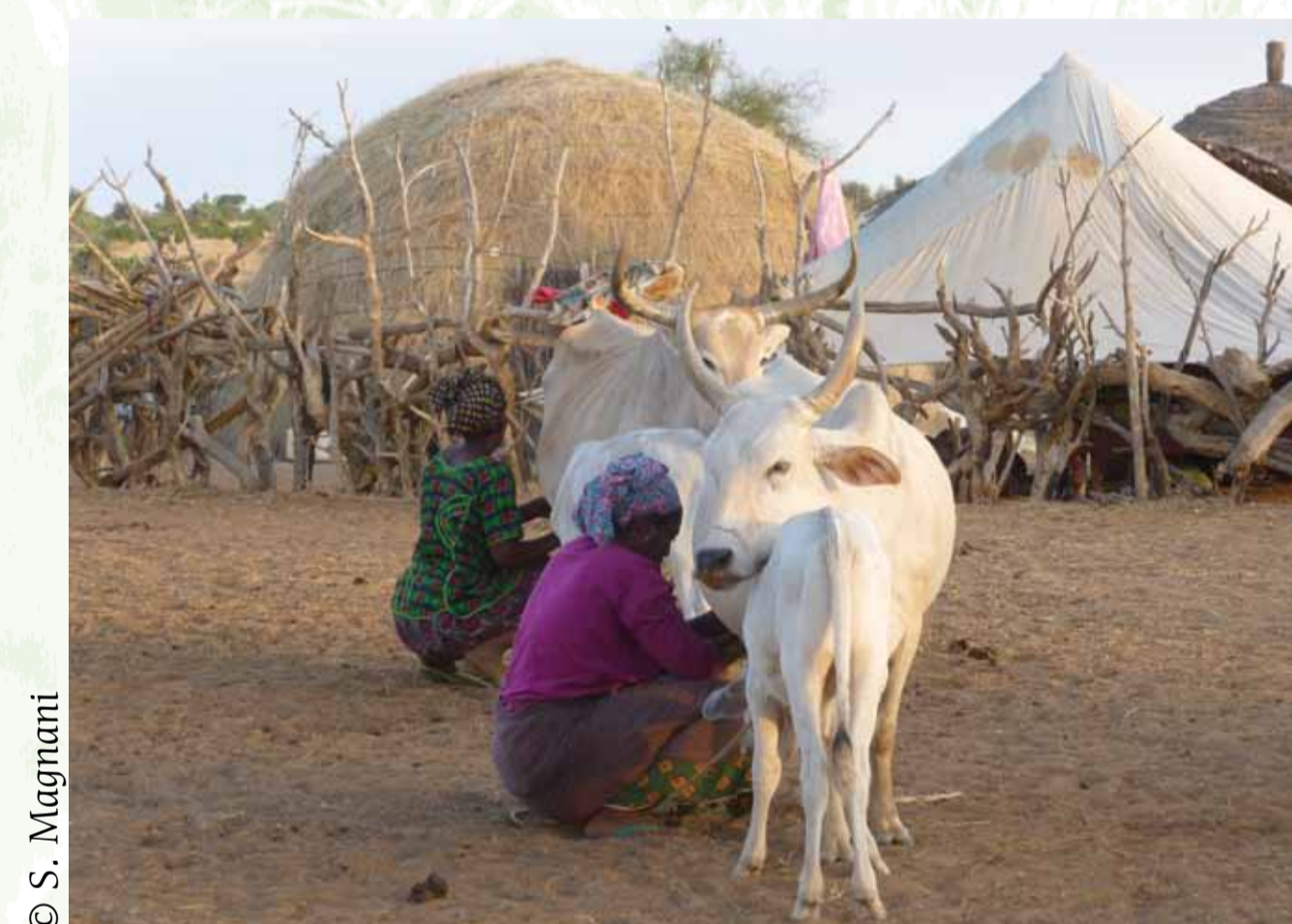
Traite au campement, Novembre 2013