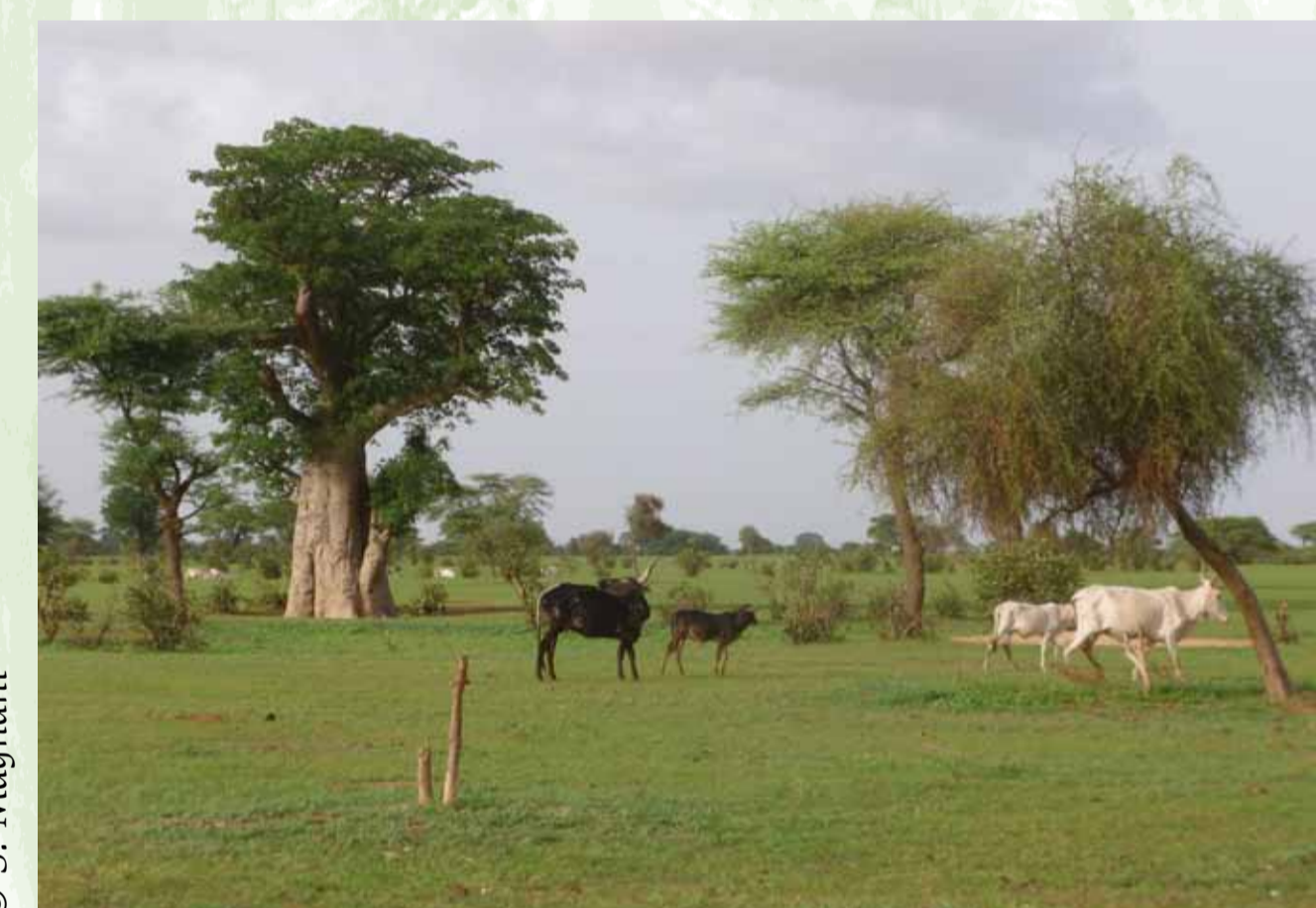
Pâturages, saison des pluies 2012