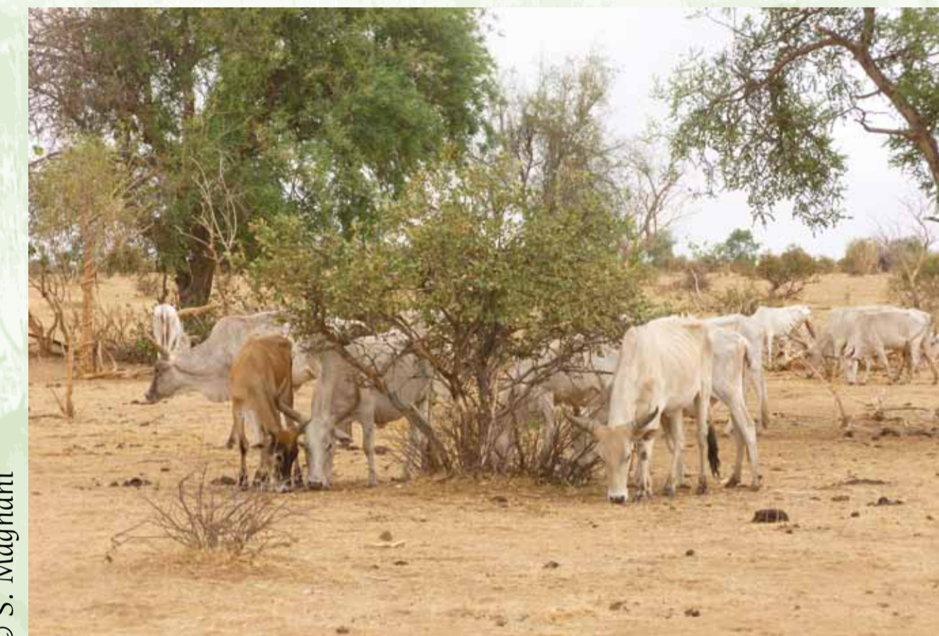
Vaches en pâture, saison sèche 2013