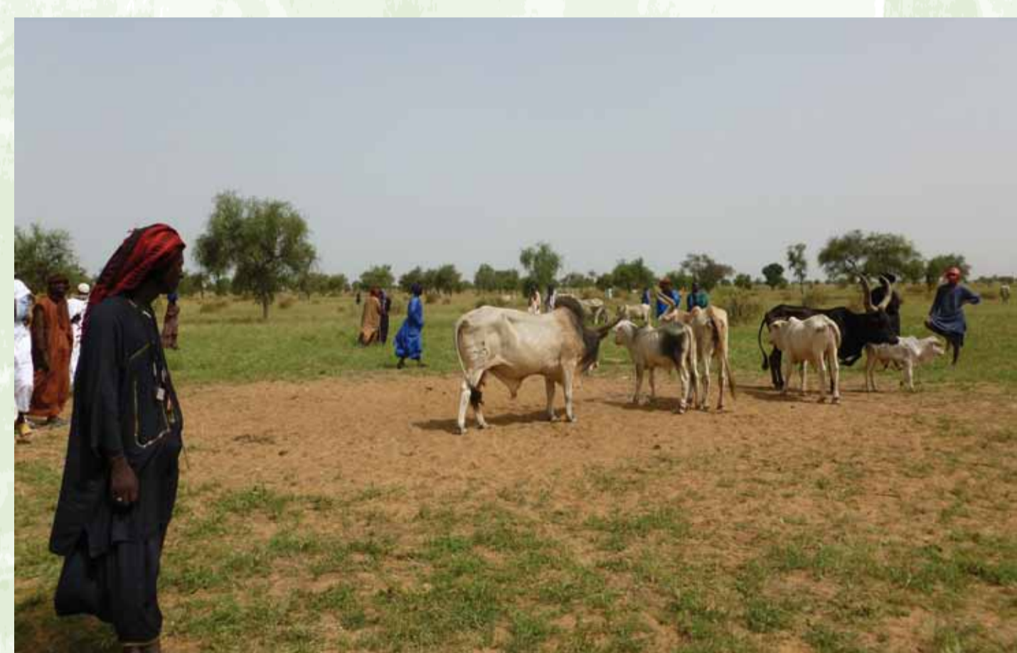
Bovins en vente au marché de Niassanté, Septembre 2013