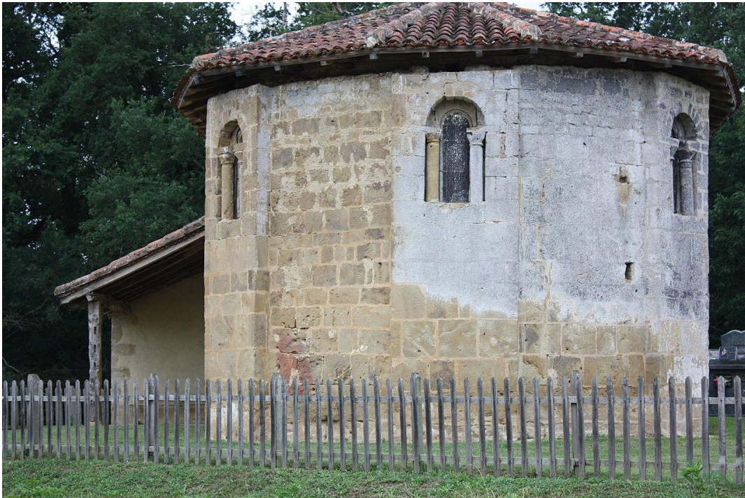
Fig. 1 : Belloc-Saint-Clamens, église Saint-Clamens, le chevet.