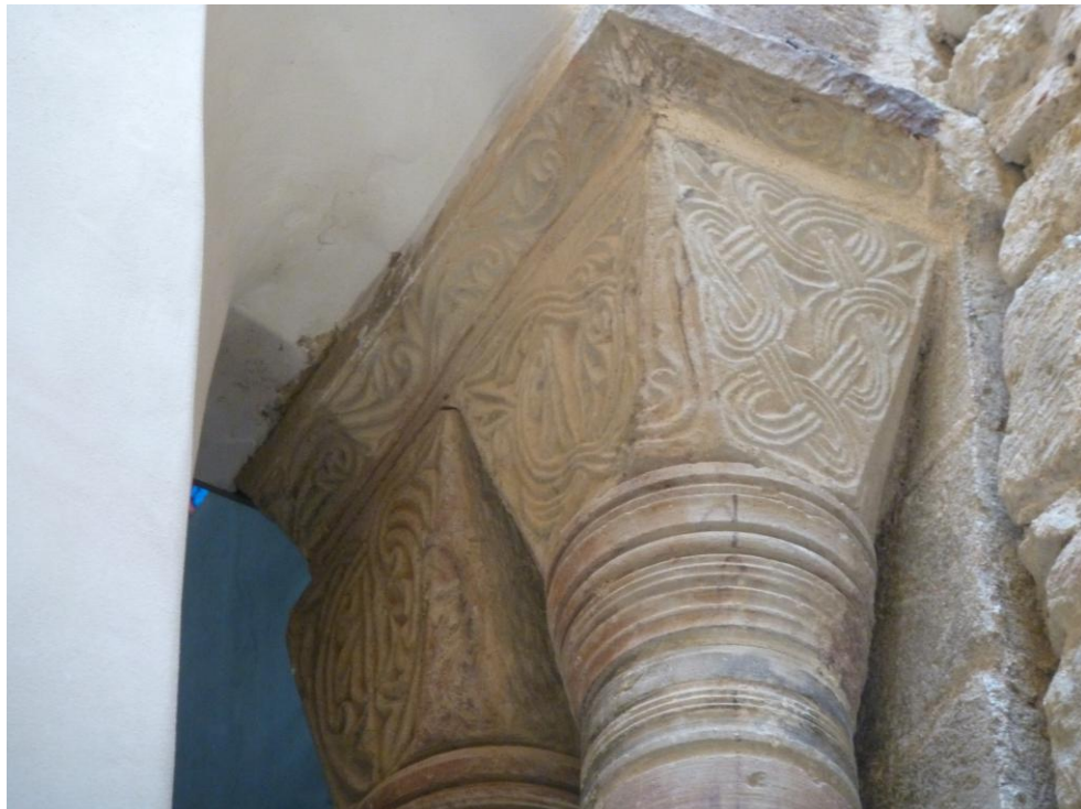
Fig. 10 : Saramon, ancienne abbatale, la tour Saint-Victor, les deux chapiteaux situés côté nord.