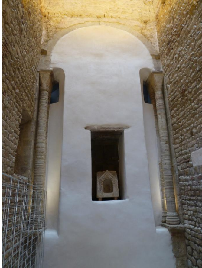
Fig. 7 : Saramon, ancienne abbatale, la tour Saint-Victor, détail de l'élévation.