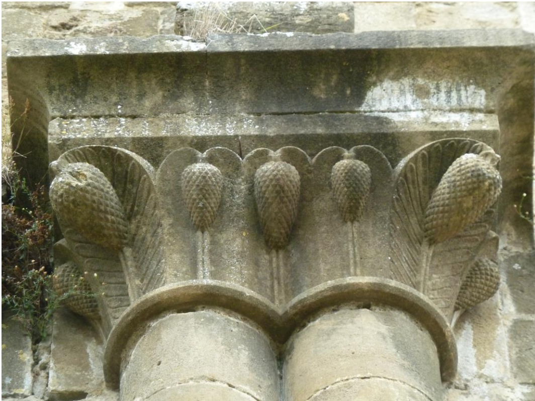
Fig. 6 : Marciac, église paroissiale, chapiteau double provenant de la Case-Dieu.